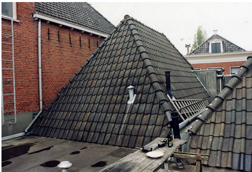
Het dak gezien vanaf de achterkant.

De mezzanino heeft drie lage vensters met getoogde bovendorpels en uitstekende houten onderdorpels.