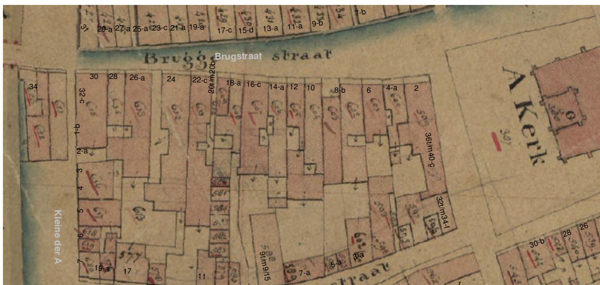
De kadastale kaart uit omstreeks 1830 met daarop aangegeven de moderne huisnummering.

Op het minuutplan van omstreeks 1830 is het huidige voorhuis te zien met een binnenplaats met aan de linkerkant een gang en daarachter een L-vormig achterhuis dat zich uitstrekte achter de oostelijke buurman Brugstraat 10. Het perceel heeft achteraan een dubbele breedte en strekte zich uit tot aan de Schuitemakerstraat. Aan deze straat is op het perceel een dwars geplaatst gebouw aangegeven.