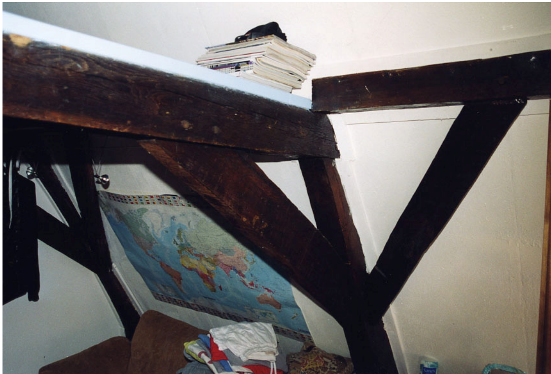
Een van de eikenhouten kapgebinten.