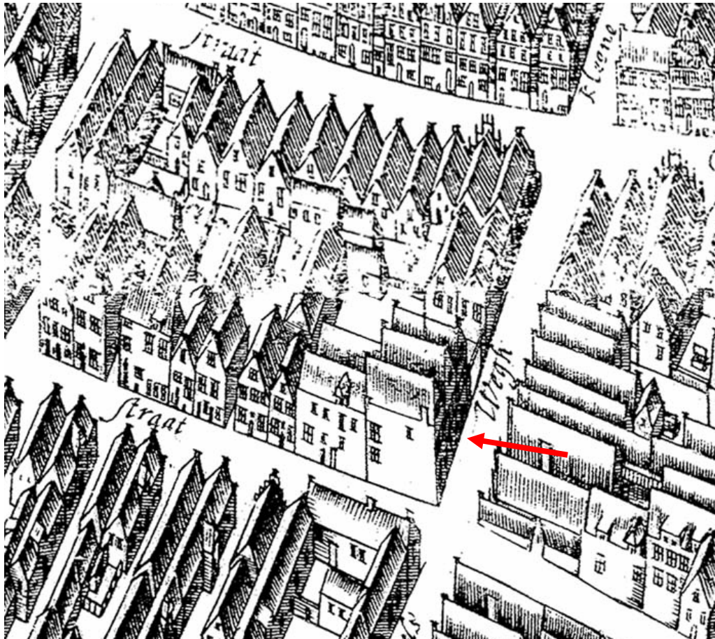
Uitsnede van de kaart van Hauboïs uit omstreeks 1643.

Het huis had aan de rechterkant de gang en de trappen en aan de linkerkant de stookzijde. Althans in de latere situatie zitten de gang en trappen rechts.