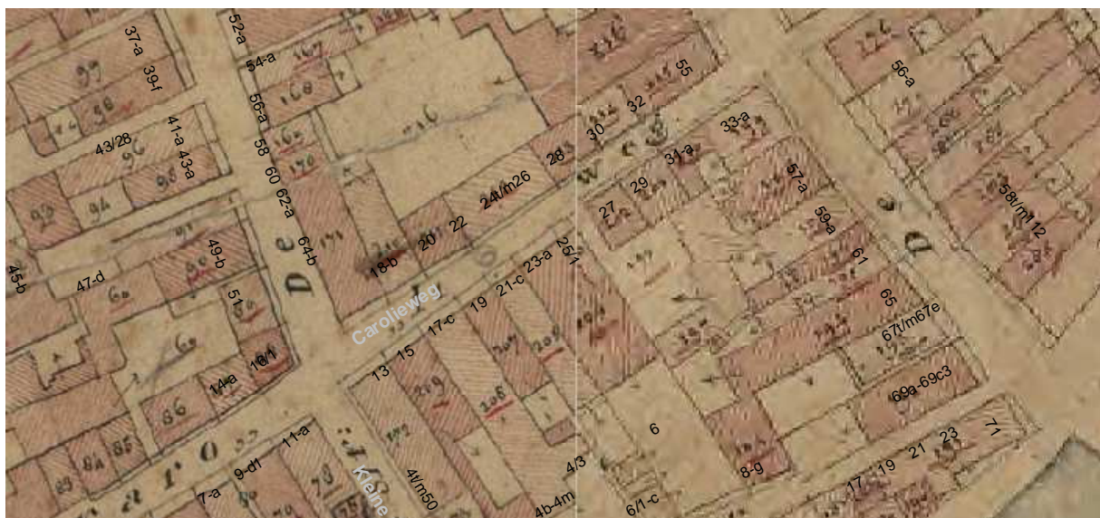
Uitsnede minuutplan van de gemeente Groningen uit omstreeks 1830 met daarop aangegeven de moderne huisnummering.

De kaart van Hauboïs van ca. 1643 toont op de plek van Carolieweg 18 een diep huis met zadeldak met een diep achterhuis. Van dat achterhuis zijn geen sporen gevonden.