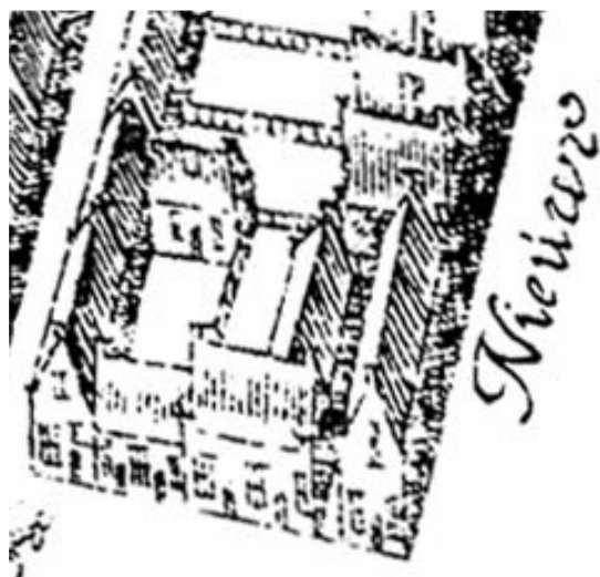
De hoek van het Schuitendiep (onder) met het Damsterdiep (toen Nieuwe Steentilstraat genaamd, rechts) op de kaart van Hauboiss uit omstreeks 1643. Het noorden is op deze kaart links.

Op de kadastrale minuut van circa 1830 staat het huis Damsterdiep 4 afgebeeld als een voorhuis (een dwarshuis), zonder achterterrein. De L-vormige achterbouw hoorde toen bij het buurpand, Damsterdiep 6; deze was toegankelijk via een gang tussen de panden Schuitendiep 98 en 100. Wellicht behoorde deze achterbouw vanouds bij Damsterdiep 6.