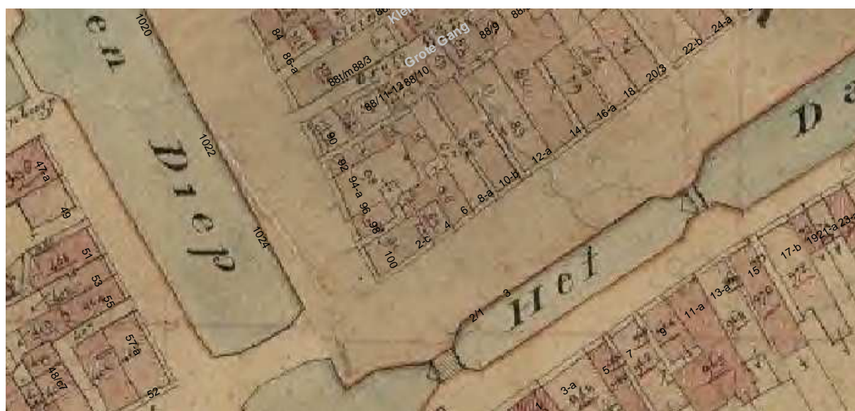
De kadasterkaart uit omstreeks 1830 met daarop aangeven de moderne huisnummering.

Vrijwel zeker bestond het voorhuis reeds uit twee bouwlagen met een zadeldak, evenwijdig aan de straat. Aan de hand van de balklagen op de eerste en tweede verdieping wordt dit gebouw gedateerd in de 18de eeuw (of mogelijk de late 17de eeuw). De achterbouw was aanvankelijk smaller, zo kan worden opgemaakt uit de gevels en balklagen. In eerste opzet was dit een rechthoekig gebouw tegen de rechter helft van het voorhuis, bestaande uit een deels onderkelderde begane grond, een verdieping en een kap. De vorm van de kap is niet bekend, aangezien deze in de late 19de of vroege 20ste eeuw is gesloopt. Vóór 1830 moet een uitbreiding hebben plaatsgevonden, waarmee de achterbouw een L-vormige plattegrond kreeg.