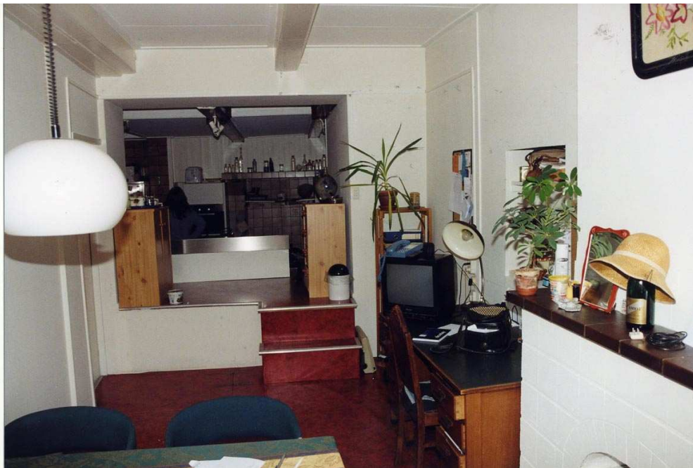
De begane grond gezien naar achteren. Onder het hoger gelegen gedeelte is de kelder van Damsterdiep 6.

Het rechter deel van het voorhuis is onderkelderd. Deze kelder is een rechthoekige ruimte, verlicht via twee kelderlichten in de voorgevel. Opvallend is het feit dat het oostelijke kelderlicht een veel steilere afzaat heeft dan het westelijke, wellicht in verband met kolenstort. De zoldering bestaat uit een enkelvoudige balklaag van gekantrechte naaldhouten balken. De balklaag is recent versterkt door middel van tussenbalken. De toegang bestaat uit een luik in de vloer van de begane grond. Dit luik bevindt zich op de plaats, waar zich eertijds een keldertoegang bevond (opgenomen in een kastenwand achter in de woonkamer op de begane grond). Verder zijn geen bijzonderheden gesignaleerd.