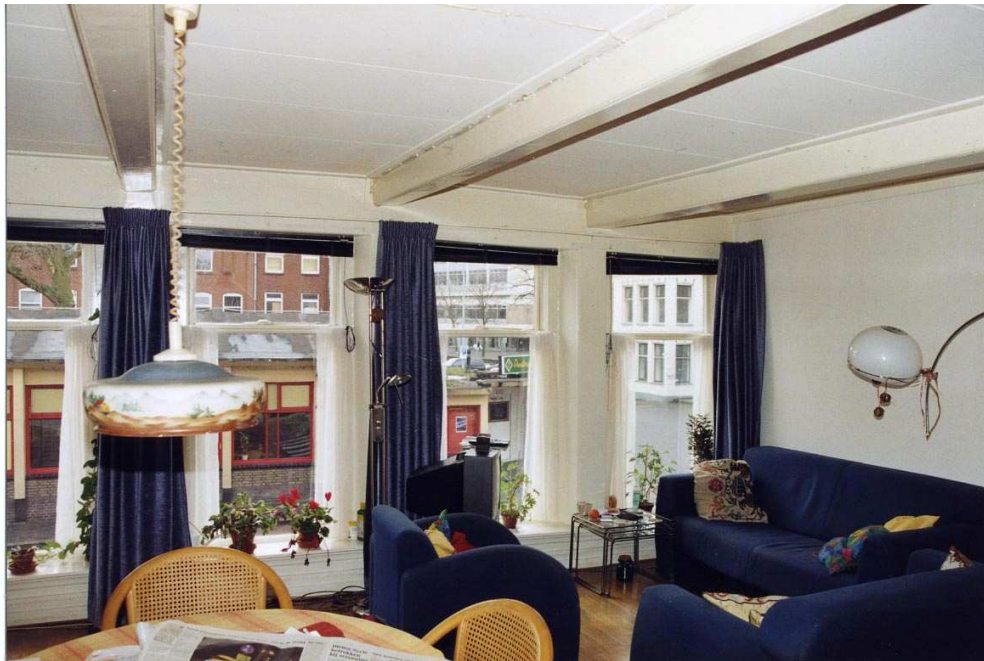
De verdieping gezien naar de voorkant.

De woonkamer is nu een ongedeelde ruimte, maar de twee deuren achter in de middenmuur maken duidelijk dat de oorspronkelijke woonkamer iets kleiner was. Achter in deze kamer bevond zich een kastenwand, die ook een volwaardige keldertoegang bevatte. De achterste deur in de middenmuur gaf toegang tot het keldertrappenhuis. De schouw tegen de rechter zijgevel staat in het midden van deze iets kleinere woonkamer. De mantel heeft omstreeks 1940 een bekleding van tegels en baksteen gekregen. Om een doorgang naar het achterhuis te maken is de kastenwand gesloopt, waarna een brede doorgang in de achtergevel is gemaakt.