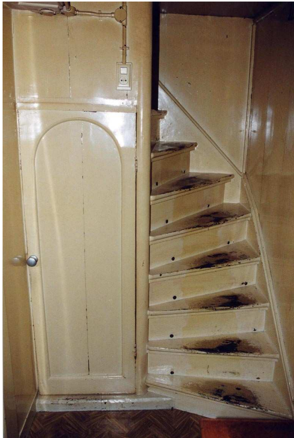
De trap die van de verdieping naar de zolder voert.