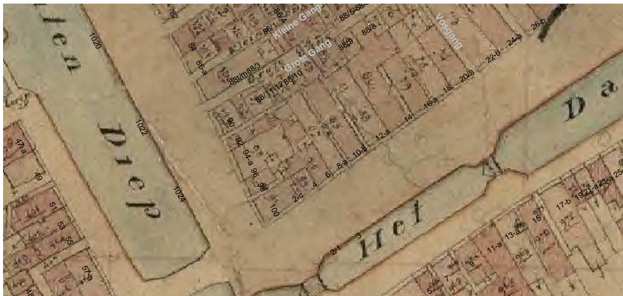
De Kadasterkaart van omstreeks 1830 met daarop aangeven de moderne huisnummering.

Op de kadastrale minuut van circa 1830 heeft het huis zijn huidige contour, bestaande uit een voor- en achterhuis. Voor- en achterhuis worden verbonden door een tussenlid, links op de binnenplaats. Tegen het achterhuis stond een smal uitstek (links). Opvallende afwijking ten opzichte van de huidige situatie is het feit dat het huis aan de westzijde een aanbouw bezat, gelegen achter Damsterdiep 4. Deze aanbouw was bereikbaar via een gang vanaf het Schuitendiep (tussen Schuitendiep 98 en 100). Het moet niet worden uitgesloten dat deze aanbouw al sedert de bouwtijd bij het pand hoorde.