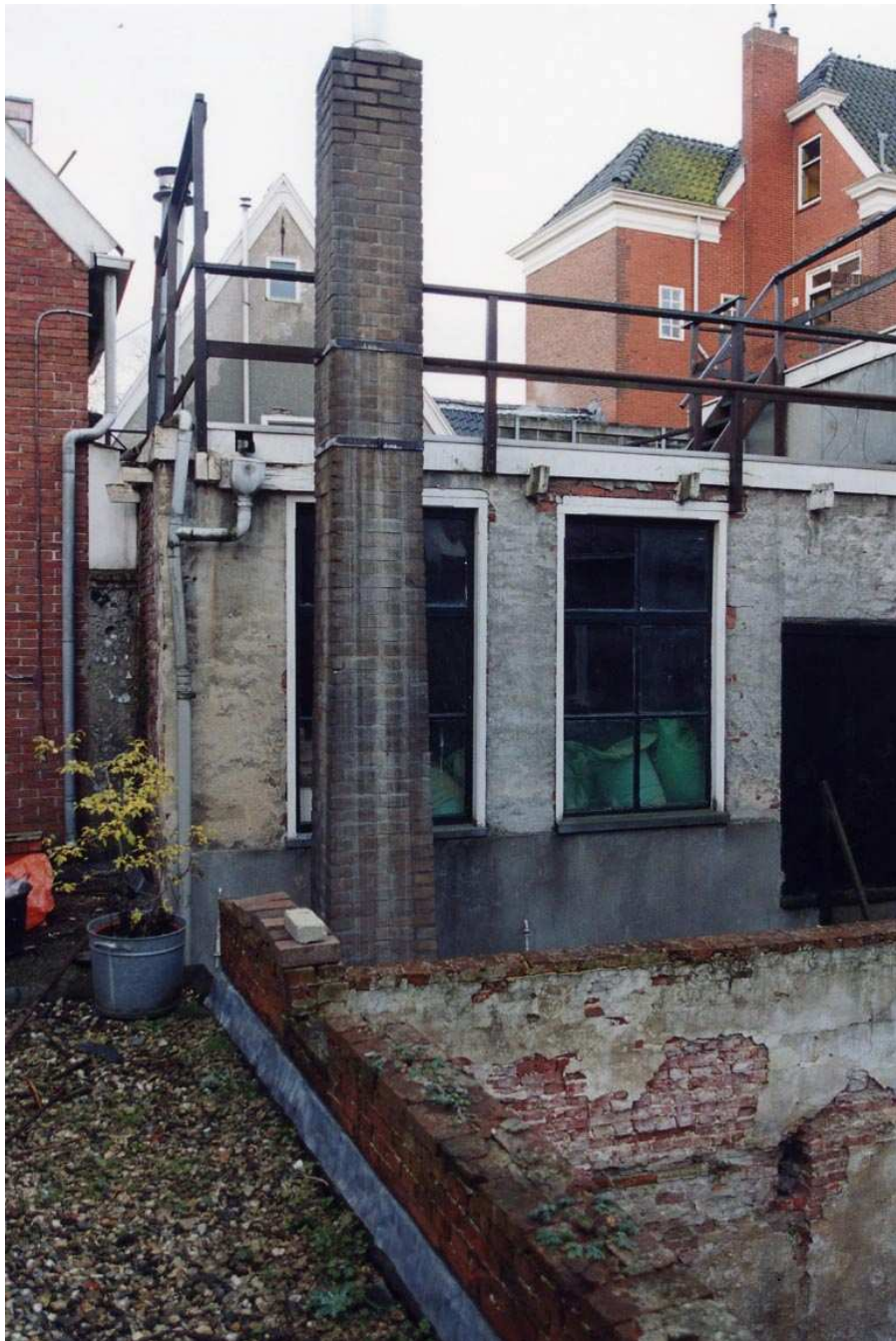
De achtergevel van het achterhuis met daarachter zichtbaar de top van de achtergevel van het voorhuis.

De gevel wordt afgesloten door een omgekorniste lijst, bestaande uit een architraaf, fries en kroonlijst.