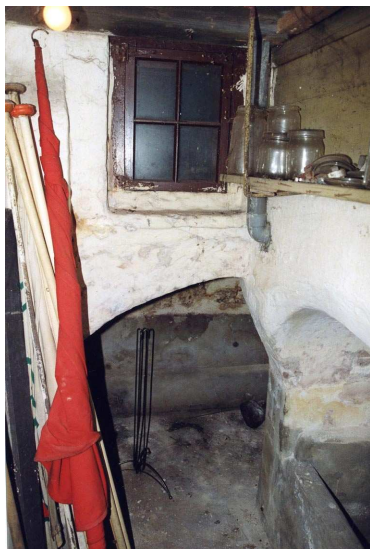
De kelder die onder het buurpand Damsterdiep 4 ligt.

De kelder van Damsterdiep 6 ligt onder het achterhuis van Damsterdiep 4. Uit de kadastrale minuut van circa 1830 blijkt dat dit achterhuis toentertijd ook al bij Damsterdiep 6 hoorde. Wellicht bestond deze situatie reeds sedert de bouw van het huis in de late 17de of vroege 18de eeuw. De kelder bestaat uit een hoge 'gang' met een vlak houten plafond, waarnaast twee lage dwarsruimten met tongewelven (haaks op de straat) en waarachter een ruimte met een korfbooggewelf (evenwijdig aan de straat). Een bakstenen trap vormt de ontsluiting van deze kelder (19de eeuw?). De hoge gang werd aangelicht door een venster met een vierruitsraam, dat uitzag op een binnenplaatsje (19de eeuw). Op twee plaatsen viel het metselwerk op te nemen, namelijk in de gangwand en de tussenwand van de twee dwarsruimten. Het baksteenformaat bedraagt (24½) 25½-26½ x 11½-12 (13) x 6-6½ cm. Op grond hiervan is een datering in de 17de eeuw mogelijk. De gewelven zijn uitgevoerd in 'geeltjes'. De vloer is geheel afgewerkt met cement.