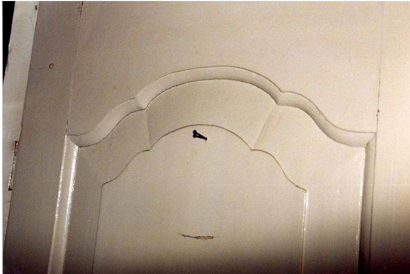
Detailfoto van een 18 e eeuwse deur.

een schouw, voorzien van een 19de-eeuwse zwartmarmeren schoorsteenmantel (met roodmarmeren decoraties) en een taps toelopend rookkanaal uit circa 1960. Ook de vensterwandbetimmering hoort tot de 19de-eeuwse opzet, maar is bij latere verbouwingen aangepast.