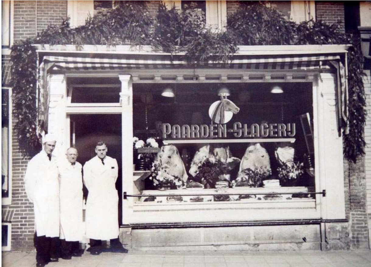
De vroegere winkelpui uit de late 19 e eeuw (privécollectie van de eigenaar van het pand).

(dezelfde of een kort daarna volgende) verbouwing zijn de kapconstructie, de indeling en het interieur van het voorhuis grondig vernieuwd. Ten tijde van deze verbouwing behoorde de westelijke aanbouw (weer?) bij Damsterdiep 4, uitgezonderd de kelder. Ook het trappenhuis bevindt zich in de bouwmassa van Damsterdiep 4. Eveneens is in de 19de eeuw is het achterhuis verhoogd tot twee bouwlagen met een plat dak.