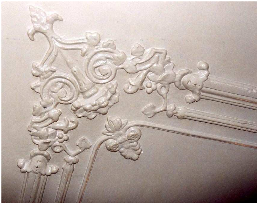
Een hoekornament van het stucplafond in de voorkamer op de verdieping.

De eerste verdieping is heringedeeld in 2005, waarbij alleen de (19de-eeuwse) voorkamer min of meer ongewijzigd is gehandhaafd. Van de interieur-afwerking in deze kamer zijn de schouw met zwartmarmeren schoorsteenmantel en gestucte kroonlijst en het stucplafond met plint- en perklijst, hoekornamenten en een rijk gedecoreerd middenornament behouden gebleven. Van de achterkamer is het samengestelde venster noemenswaard, waarvan het glas-in-lood in de bovenlichten is voorzien van sierlijke geometrische decoraties in geel en paars (circa 1920).