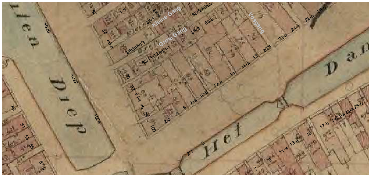
De kadastrale kaart van omstreeks 1830 met daarop aangegeven de moderne huisnummering.

Het achterhuis van Damsterdiep 8 moet uit de late 18de eeuw of vroege 19de eeuw dateren, zo blijkt uit het metselwerk van de achtergevel (begane grond). 2 Kenmerkend is de toepassing van klezortjes in de neggen van de vensters. Volgens de kadastrale minuut van circa 1830 was het volledige terrein van het pand bebouwd, tot en met de achtergevels van de panden aan de Grote Gang. Het achterste deel van deze bebouwing is in de loop van de 19de eeuw verzelfstandigd.