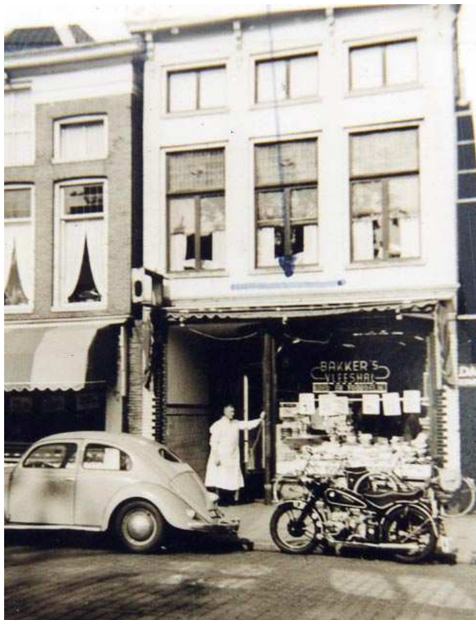
Damsterdiep 8 op een foto uit 1958.