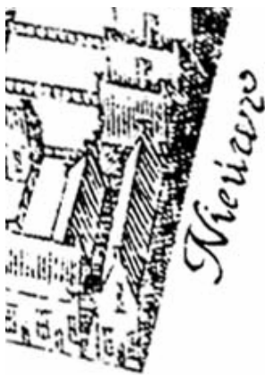
De hoek van het Schuitendiep met het Damsterdiep (toen Nieuwe Steentilstraat).