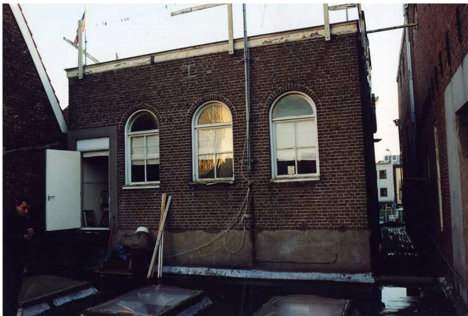
De achtergevel gezien vanaf het platte dak van het achterhuis.

De achtergevel van het hoofdgebouw is een tweelaags langsegevel, afgesloten door een houten boeiboord. De (gepleisterde) begane grond gaat vrijwel geheel schuil achter een éénlaags aanbouw. De verdieping uit 1909/1910 is uitgevoerd in schoon metselwerk. Opvallend zijn de drie rondboogvensters, voorzien van vierruitsramen met halfronde bovenlichten. De deuropening is van secundaire oorsprong. Niet alleen zijn kozijn en deur van betrekkelijk recente datum, ook is er sprake van een breed 'manchet' van pleisterwerk.