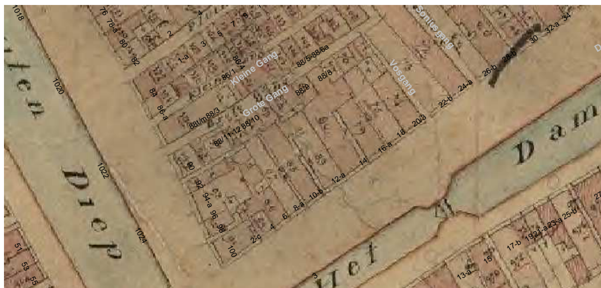
De kadastrale kaart uit omstreeks 1830 met daarop aangegeven de moderne huisnummering.

Op de vogelvluchtplattegrond van Groningen door Haubois uit 1643 staat ter plaatse van Damsterdiep 12 een diephuis getekend, vermoedelijk bestaande uit één bouwlaag met een zadeldak (haaks op de straat). Op de kadastrale minuut van circa 1830 staat een grote, ongedeelde bouwmassa getekend, ter grootte van het huidige voor- en achterhuis en inclusief de eenlaags aanbouw aan de achterzijde. Vermoedelijk bestond het hoofdgebouw (voor- en achterhuis) nog steeds uit één bouwlaag met een kap. In de huidige situatie heeft de begane grond een afwijkende gevelafwerking, namelijk pleisterwerk in plaats van schoon metselwerk.