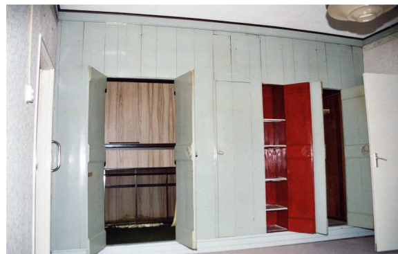
Afb. 4. Engelberterweg 62, bedsteewand in de kamer.

Het huidige woongedeelte bestaat uit twee delen, gescheiden door een tussenmuur die de oorspronkelijke scheiding vorm tussen woon- en bedrijfs gedeelte. Vóór de tussenmuur ligt een kamer met tegen de achterwand een originele bedsteewand. Onder de vensters is een eenvoudige doch fraaie betimmering aangebracht.