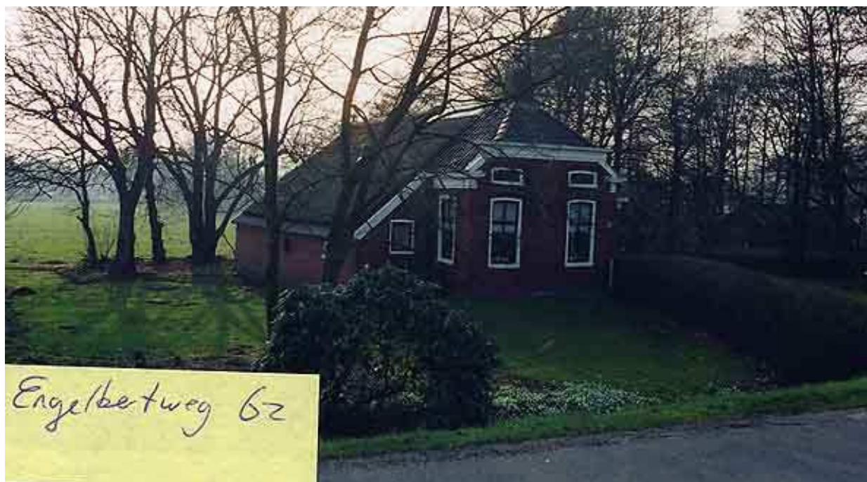
Afb. 1. Aanzicht Engelberterweg 62; foto: Imre van der Gaag, collectie dienst RO/EZ.