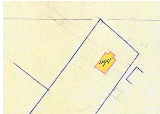
Afb. 4. Gegevens afkomstig van het kadaster. Hulpkaart 19, gemeente Noorddijk sectie G, opgemaakt en deugdelijk verklaard Augustus 1887.