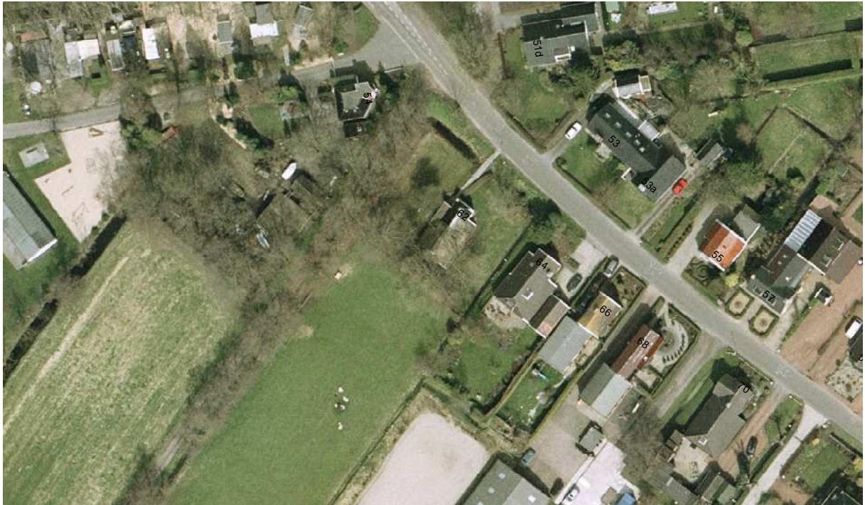
Afb. 2. Luchtfoto Engelberterweg 62; foto: afdeling GEO-informatie gemeente Groningen.

Voor het onderzoek naar de bouwgeschiedenis is gebruik gemaakt van het bouwdoos van de dienst Ruimtelijke Ordening en Economische Zaken van de Gemeente Groningen dat teruggaat tot omstreeks 1900. Tevens zijn hulpkaarten en bijbehorende veldwerken van het kadaster geraadpleegd die de ontwikkeling van de hoofdvorm van de boerderij vanaf 1830 tot heden weergegeven.