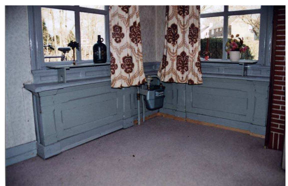
Afb. 4. Engelberterweg 62, betimmering onder de vensters.