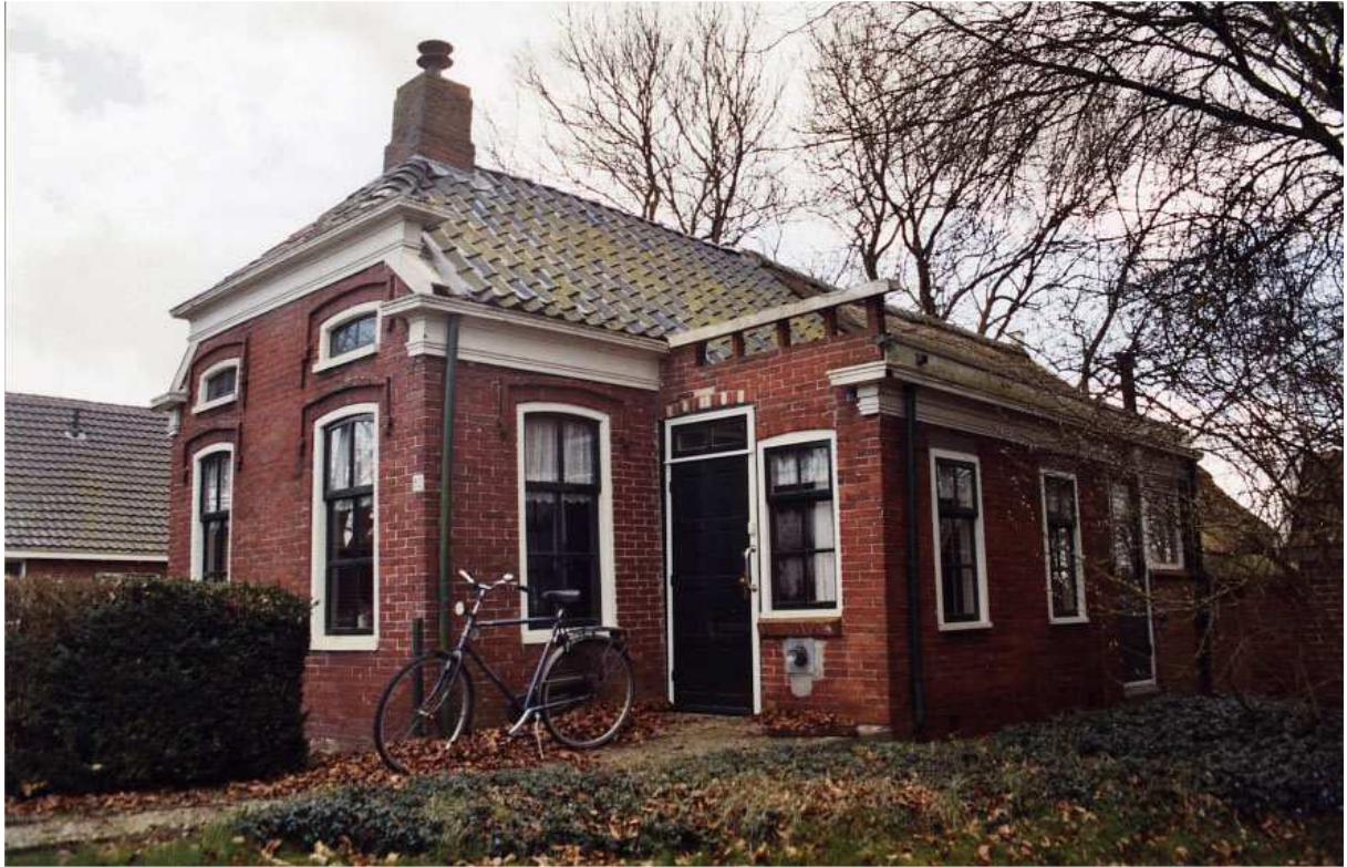
Afb. 6. Voor- en rechterzijgevel Engelberterweg 62; foto: Marcel Verkerk, dienst RO/EZ.