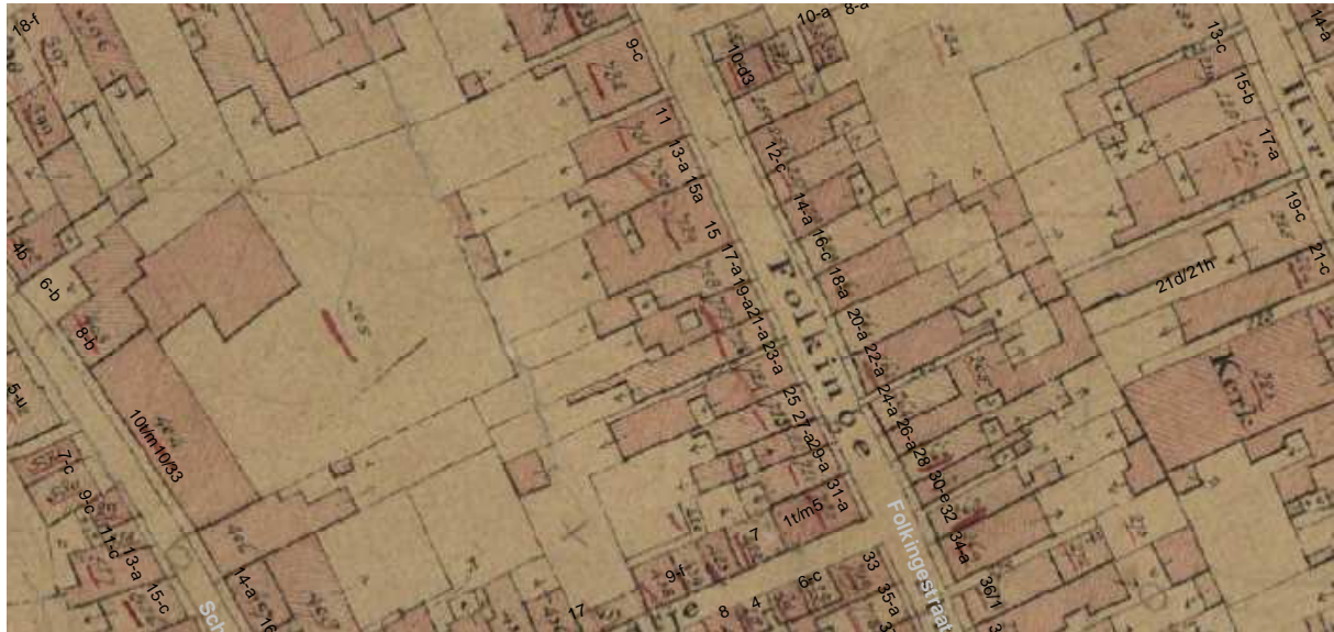
De kadastrakaart uit omstreeks 1830 met daarop aangegeven de moderne huisnummering.

De kaart van Haubois (ca. 1643) geeft ongeveer op de plaats van het huidige pand een dwars huis aan. Dit dwarse huis komt niet goed overeen met het huidige voorhuis dat een kort diep huis van twee bouwlagen lijkt te zijn. Hoe oud de kern van dit korte diepe huis is, is niet geheel duidelijk. Wellicht is het huis kort na het maken van de kaart van Haubois 'gedraaid' en met een verdieping verhoogd. De ankers in de voorgevel suggereren althans een 17de-eeuwse datering voor de kern van dit huis. De linkermuur die mandelig is met de nr. 21 heeft een vrij oude begane grond (15de of 16de eeuw) en een 17de-eeuwse ophoging. Een en ander kan tenminste afgeleid worden aan de bouwgeschiedenis van nr. 21 in de zuidmuur van dat pand.