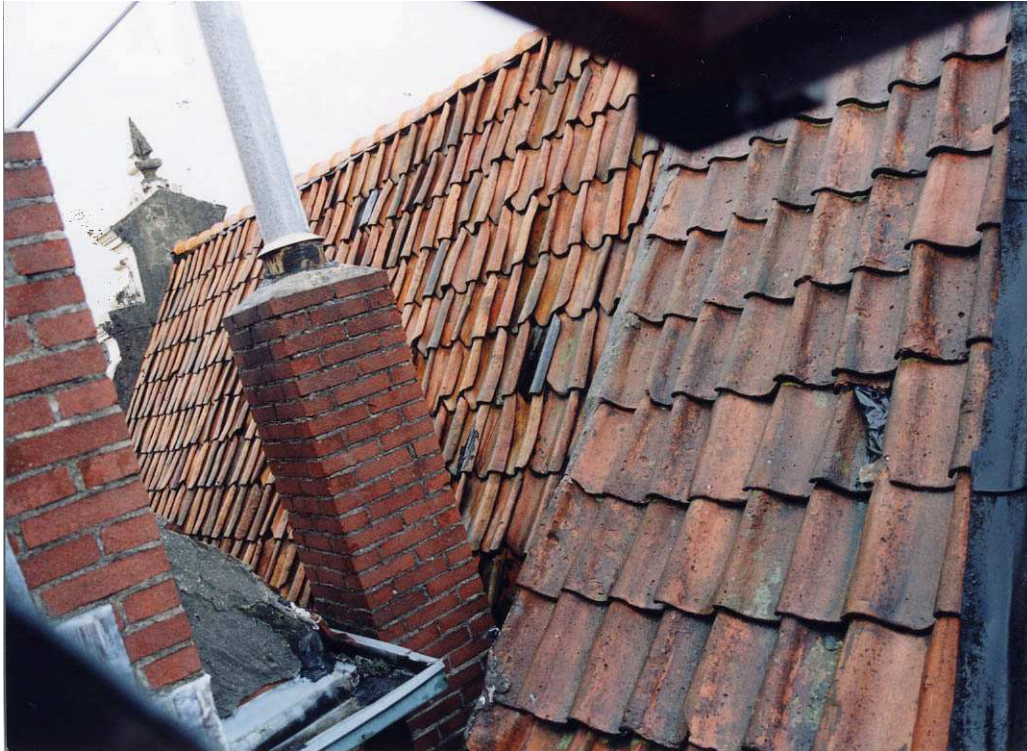
Het noordelijke dakvlak van het voorhuis waarop zowel linksdekkende als rechtsdekkende oudhollandse dakpannen zijn gelegd.