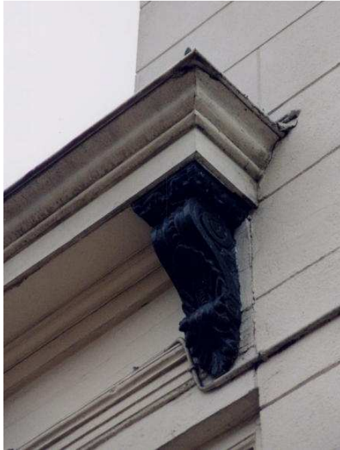
Afb. 4; fraaie console onder de lijstgoot aan de gevel aan de Rademarkt. Onduidelijk is of de console gemaakt is van hout of van terra cotta, foto Imre van der Gaag.