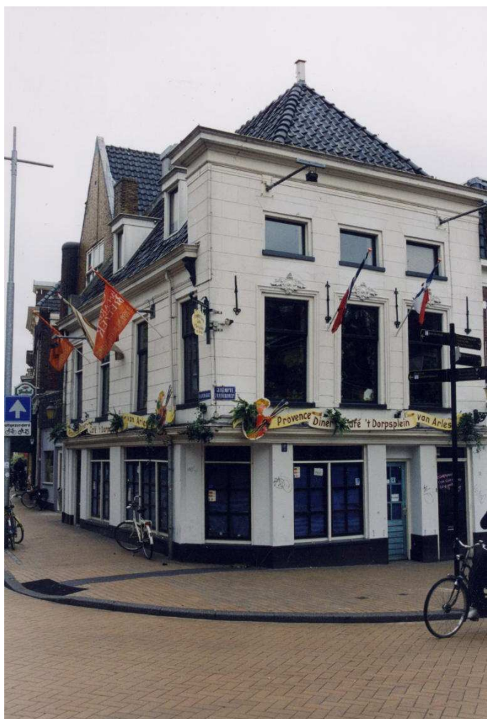
Afb. 1; voorgevel gezien vanaf het Gedempte Zuiderdiep, foto Imre van der Gaag.