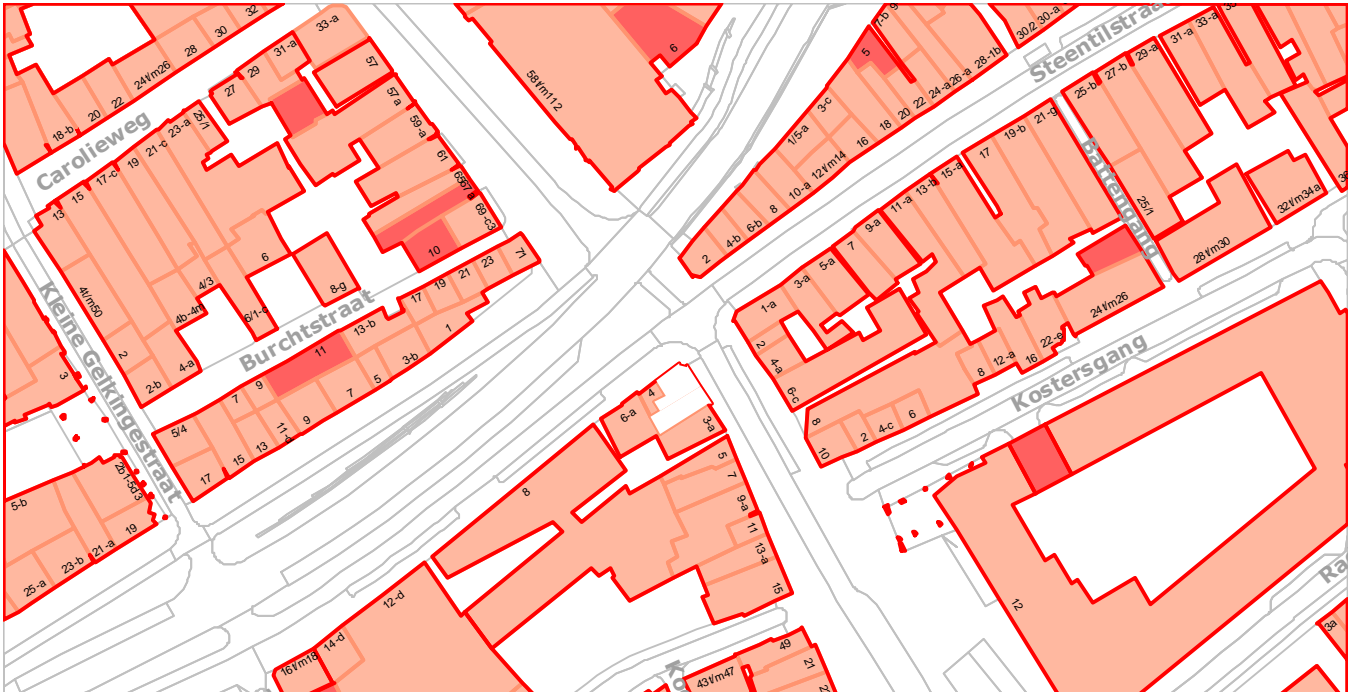
Afb. 2; Huidige situatie met in zwart aangegeven de panden Gedempte Zuiderdiep 2 en Rademarkt 1.

Aangezien het bouwdoos van de dienst Ruimtelijke Ordening en Economische Zaken van de Gemeente Groningen niet te traceren was kon hier voor het onderzoek geen gebruik van gemaakt worden. Wel is gebruik gemaakt van een verbouwingstekening uit de jaren 70 van de vorige eeuw die in het bezit is van architectenbureau Van Helden.