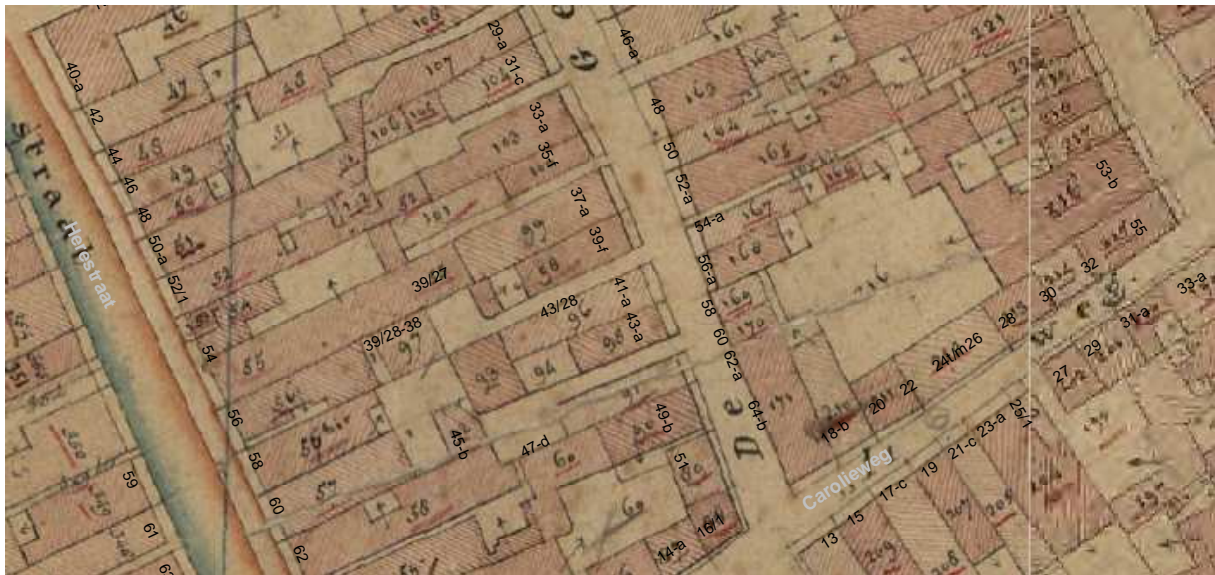
De kadasterkaart uit omstreeks 1830 met daarop aangegeven de moderne huisnummering.

In de 18de eeuw (of uiterlijk de vroege 19de eeuw) moet het huis ingrijpend zijn gemoderniseerd, zoals nu nog geconcludeerd kan worden uit diverse vensters in de zijgevel. Reeds genoemd is de gedeeltelijke vernieuwing van het metselwerk van de eerste verdieping van de noordelijke zijgevel. Vermoedelijk werd de voorgevel in deze periode verbouwd tot de huidige drielaags lijstgevel