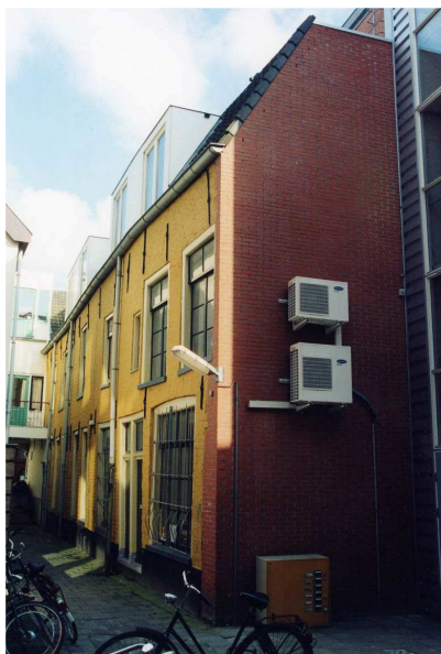
De noordelijke zijgevel gezien in de richting van de Gelkingestraat.

Door de afwerking van de voorgevels van de panden Gelkingestraat 39 en 41 en de doorgaande kap (evenwijdig aan de straat) lijkt sprake te zijn van een samenhangend complex, waarvan de overbouwde poort de midden-as vormt. In de verdere opzet van de panden is dat niet het geval.