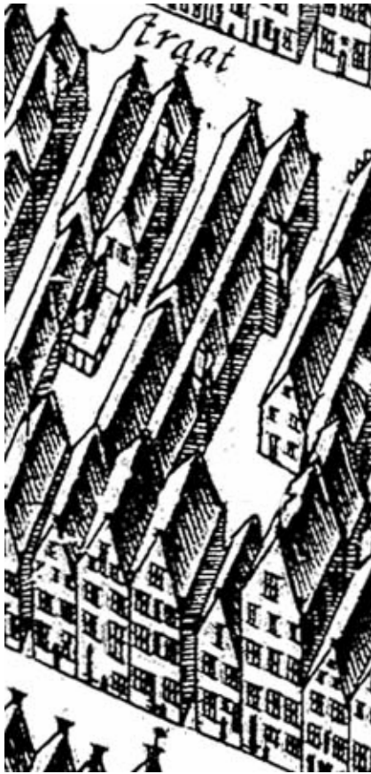
De kaart van Hauboys uit omstreeks 1643, het noorden is op deze kaart links. Boven is een stukje van de Gelkingestraat te zien en onder de gedeelte van de oostwand van de Herestraat. Daartussen is rechts het Munsterstraatje afgebeeld en in het midden de Sieboldsgang.