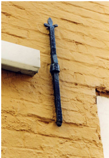
Een van de ankers in de noordgevel. Dit ankertype werd in de 17de eeuw veel toegepast.

De eerste verdieping bevat eveneens verschillende typen vensters. De voorste twee vensters met zesruitsschuiframes hebben een 19de-eeuws karakter. Dan volgt een venster uit de 20ste eeuw, eveneens voorzien van een zesruitsschuifraam. Mogelijk is dit venster vernieuwd bij de renovatie in de jaren tachtig van de 20ste eeuw. Het daarop volgende venster stamt uit de 19de eeuw. Het onderraam van dit venster is vernieuwd in de 20ste eeuw, het 19de-eeuwse bovenlicht vertoont nog de sporen van een vierdeling. Het kleinere venster met zesruitsschuifraam (behorend bij het magazijn van de winkel)