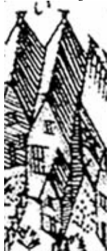
Grote Kromme Elleboog 16 op de kaart van Haubois uit circa 1643.

Het voorhuis heeft een oude kern die is gebouwd als een diephuis met één of twee bouwlagen en een steil zadeldak. Het is niet duidelijk of het gehele huis onderkelderd was. In later tijd is in ieder geval het achterste deel onderkelderd, waarbij de onderkeldering zich niet uitstrekte onder de gang ernaast. Van dit gebouw is in ieder geval de achtergevel (gezien de dikte van 50 cm) en zijn mogelijk ook de zijmuren bewaard gebleven. De linkersijmuur is volgens de huidige eigenaar van kloostermoppen gemetseld. Het is opvallend dat het pand gemeenschappelijk muren heeft met de burens aan weerszijden. Hierbij lijkt de linker (zuidelijke) muur in ieder geval bij het pand zelf te horen. Het dwarse zuidelijke buurpand is er vermoedelijk tegenaan gebouwd. Aan de andere kant is de situatie onduidelijk.