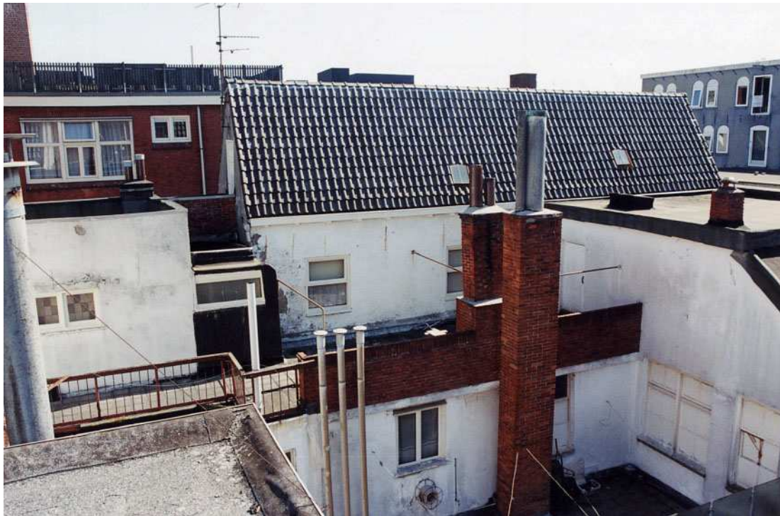
Links het eerste achterhuis en daarachter het tweede achterhuis met zadeldak.

De tweede verdieping is verdeeld in twee kleine kamers (waarvan de voorste is ingericht als keuken), omsloten door een L-vormige gang, en een grote achterkamer. Van de interieur-afwerking zijn met name de Bruynzeeldeuren, het overhoekse schouwje in de achterkamer en de inbouwkasten in de gang het noemen waard, alles uit de jaren dertig of veertig van de 20ste eeuw. Voor het overige is de afwerking zeer sober en eenvoudig, respectievelijk gemoderniseerd. De tussenruimte tussen voor- en achterhuis wordt ingenomen door een soort terras, dat uitloopt in een balkon aan de oostzijde.