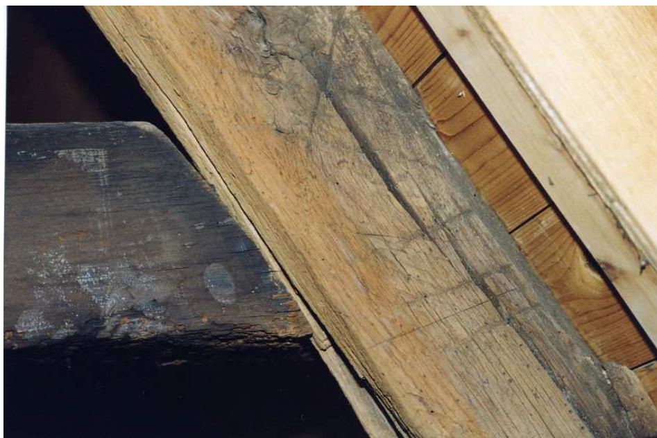
Foto boven: de balklaag boven de begane grond. Foto onder: een telmerk op een van de 15 e eeuwse eikenhouten sporen.

De vloering is slechts bereikbaar via een laddertrapje. Op dit niveau zijn de originele eikenhouten sporenparen met hanenbalken behouden gebleven, eertijds genummerd van 18 t/m 25. De