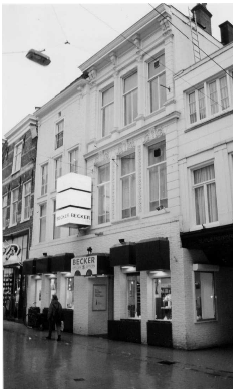
Voorgevels Herestraat 9 (rechts van de blokvormige neonreclame) en 11 met rechts het Koude Gat.