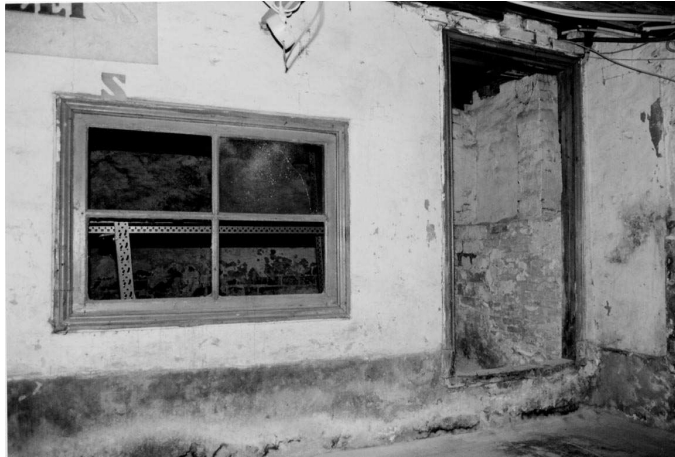
Herestraat 11, kelder met de dwars geplaatste scheidingswand tussen het voorste en het achterste gedeelte van de kelder.

De balklaag van de begane grondvloer van het achterste gedeelte van de kelder is licht uitgevoerd. De balken rusten rechts op langs de muur gemetselde poertjes. De balklaag in het voorste gedeelte bestaat uit gekantrechte naaldhouten balken die deels zijn omkist. De omkisting is negentiende eeuws. Ook deze balklaag rust rechts op poertjes. Het voorste gedeelte van de vloer is van beton, versterkt met ijzeren binten. De grote bint is vermoedelijk van gietijzer en is in verhouding tot de hoogte opvallend smal, bovendien is de doorsnede van de balk a-symmetrisch. Dit is mogelijk in 1923 aangebracht toen de winkel een nieuwe etalagepui kreeg in Amsterdamse Schoolstijl.