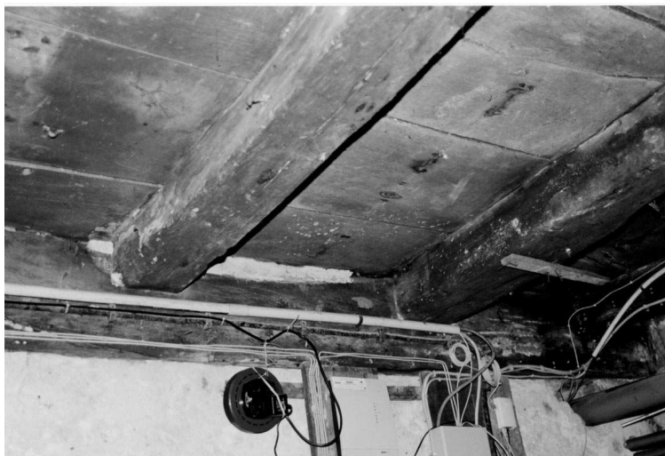
De eikenhouten onderslagbalk met ingepende dwarsbalken waar overheen de originele vloerdelen liggen.

Een uitsparing in de muur van de voorgevel, rechts naast de middenondersteuning laat zien dat hier vroeger de toegang vanuit het Koude Gat was gesitueerd. Het trapje naar deze toegang is nog aanwezig. Aan de andere kant van de midden ondersteuning is een dichtgemetselde muuropening te