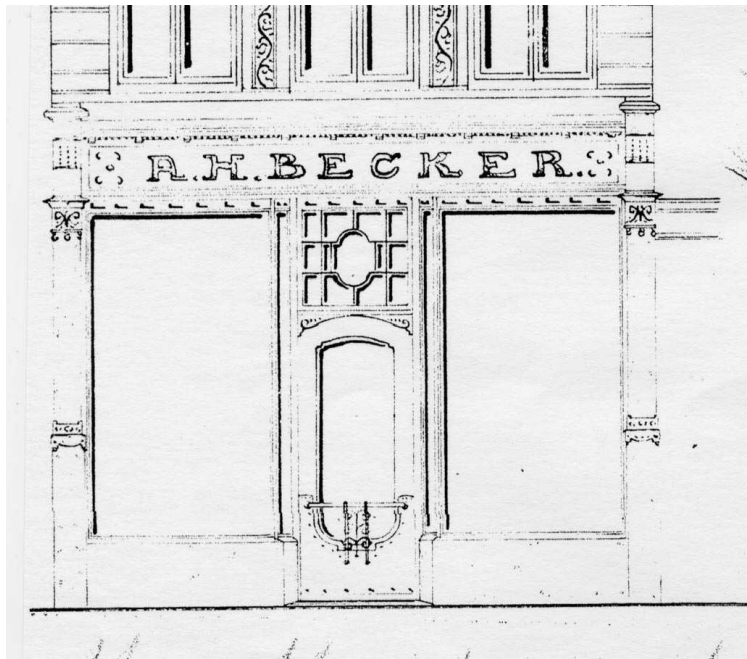
Herestraat 9 pui in de voorgevel ontworpen in 1914 door architect A. Th. van Elmpt.

De verbouwing was noodzakelijk omdat in dit pand de instrumentenmakerij A.H. Becker werd gevestigd waarvoor dit pand in 1913 werd gekocht 1 . Daarvoor was de instrumentenmakerij aan de Stoeldraaierstraat gevestigd geweest waar A.H. Becker in 1865 de zaak begon.