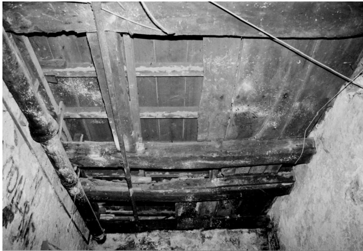
Overzicht van het linker deel van de eikenhouten balklaag met vloerdelen. Links voor is een raveling te zien met daarboven de moderne vloer die over de oude vloer is aangebracht.

De eikenhouten balklaag van de begane grondvloer van het pand aan het Koude Gat stamt uit de middeleeuwen en bestaat uit een zware onderslagbalk met daarin gepend lichtere dwarsbalken waar overheen brede eiken vloerdelen liggen. Vermoedelijk zijn de ingepende dwarsbalken met een toognagel van boven af vastgezet aan de onderslagbalk. De onderslagbalk wordt ondersteund door een later gemetselde muur, achteraan ontbreekt de onderslagbalk en zijn de dwarsbalken direct in de muur opgelegd. Waarschijnlijk liep de onderslag oorspronkelijk wel door tot de achtergevel en werd vermoedelijk in het midden ondersteund door een standvink in plaats van de huidige muur. Bouwsporen die deze veronderstelling bewijzen zijn evenwel nog niet gevonden. De vloerdelen hebben een verbinding door middel van een halfhoutse overlap. De vloerdelen zijn bijzonder breed, tot maximaal 56 cm. De onderkant van de balken en vloerdelen is met dodekop rood ingesmeerd. Op de brede vloerdelen zijn nog restanten van een plavuizenvloer aanwezig. Hier overheen is een modernere houten vloer gelegd. Rechts achter ontbreekt een deel van de oude vloer, hier is de balklaag 20 ste eeuws. In dit moderne gedeelte bevindt zich ook de trap naar boven.