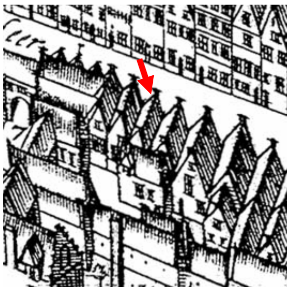
De kaart van Haubois uit omstreeks 1643.

Bij deze verkenning bleek het pand Herestraat 17 inderdaad ouder te zijn dan 1850, zoals reeds was verondersteld bij de bouwhistorische inventarisatie van de binnenstad in 2002 (categorie 2: vermoedelijk ouder dan 1850). De linker zijgevel bevat op de eerste verdieping metselwerk uit vermoedelijk de 16de eeuw (10-lagenmaat van 87 cm). Op ditzelfde niveau is ter hoogte van de wand tussen de voorkamer en de tussenruimte een eikenhouten balk aangetroffen, die waarschijnlijk onderdeel is van een oude balklaag in het huis. Waarschijnlijk behoorde deze balk tot de zolderbalklaag van een tweelaags pand (met een veel lagere eerste verdieping dan nu het geval is).