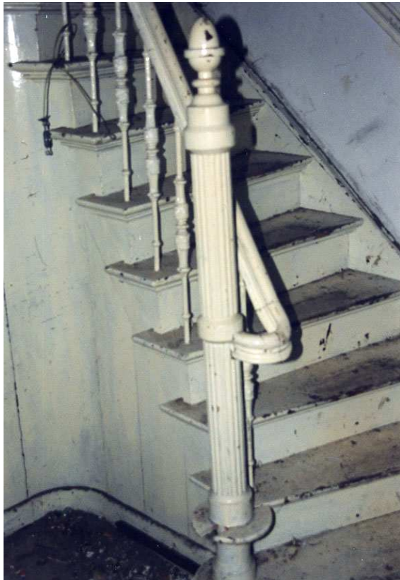
De 19 e eeuwse trap op de eerste verdieping.

betekent dat de eerste verdieping voorafgaande aan de 19de-eeuwse verbouwingen minder hoog was dan nu het geval is.