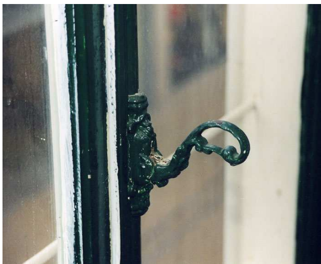
Een van de bijzondere 19 e eeuwse espanoletten van de vensters in de voorgevel op de tweede verdieping.

Het trappenhuis heeft een royale opzet met een forse vide naar de eerste verdieping. Verlichting bestond aanvankelijk uit een bovenlicht in het plafond. In de afgesloten ruimte naast dit trappenhuis bevindt zich de steile steektrap naar de zolder.