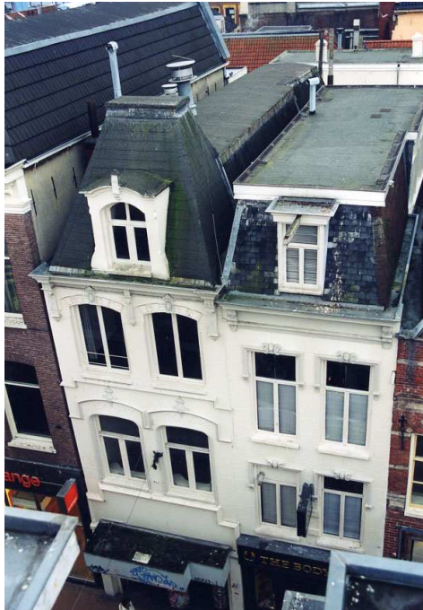
Voorgevel en dak, Herestraat 17 is het linker pand.

Van de achtergevel gaan de begane grond en een deel van de eerste verdieping schuil achter het aangebouwde achterhuis. Het zichtbare deel van de eerste verdieping bevat een stolpraam met een twee-ruitsbovenlicht (late 19de eeuw), dat recent is geblindeerd. De tweede verdieping van deze gevel is in het laatste kwart van de 20ste eeuw voorzien van een nieuwe cementpleisterlaag. Het venster en de deur (naar het platte dak van het achterhuis) zijn eveneens van recente datum.