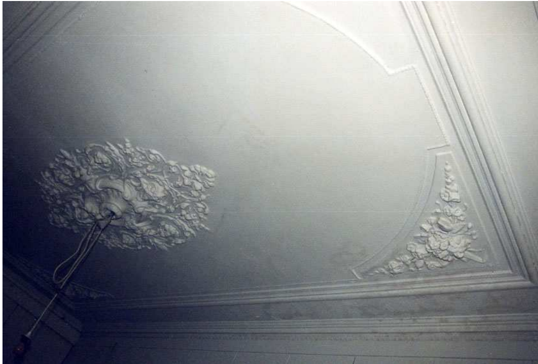
Het stucplafond van de voorkamer op de eerste verdieping.

Onder het voorhuis bevindt zich een langgerekte, lage kelder met een zoldering van gewapend beton. In het voorste deel van de kelder zijn de aanzetten van een gesloopt gewelf te herkennen (ongeveer 2/3 van de oppervlakte). De zijwanden zijn opgetrokken uit baksteen van een tamelijk fors formaat, waarvan alleen de dikte viel op te meten: 7 cm. In het achterste deel van de kelder ontbreken de aanzetten van het gesloopte gewelf. Mogelijk had dit deel van de kelder een houten zoldering. In de voorgevel is de contour van een toegang vanuit de Herestraat te zien, die zich links in de gevel bevond (zuidzijde). Deze toegang is terugliggend dichtgemetseld. De huidige keldertoegang bevindt zich aan de achterzijde. De vloer is geplaveid met baksteen.