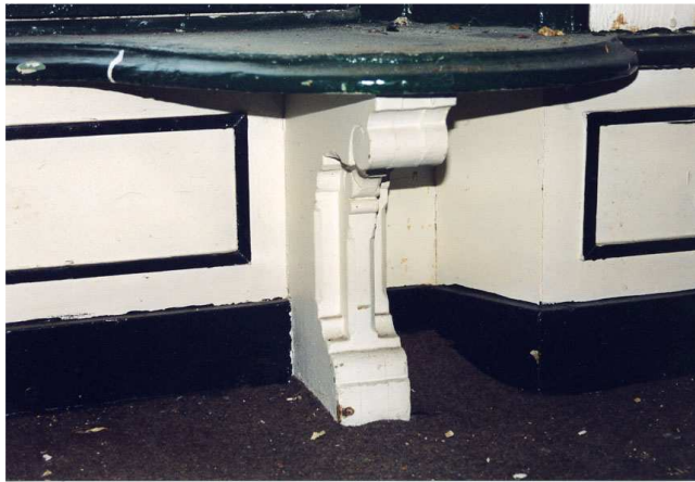
Een van de zitbanken voor een venster op de tweede verdieping.