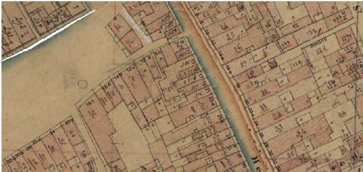
De kadastrale kaart uit omstreeks 1830 met daarop aangegeven de moderne huisnummering.

In de rechter zijgevel bevindt zich een opmerkelijke sprong, die zou kunnen wijzen op een totstandkoming in twee bouwfases of achterwaartse uitbreiding van het huis. Op de vogelvluchtplattegrond van Groningen door Haubois (1643) valt op deze plek namelijk een tweelaags diephuis met een zadeldak te herkennen. Achter dit huis en het ter linkerzijde gelegen huis Herestraat 19 staat een dwarsgericht achterhuis (met de kap evenwijdig aan de straat). Op de kadastrale minuut van circa 1830 staat op deze plaats een iets groter gebouw getekend, waarvan het eigendom is verdeeld over de panden Herestraat 13 en 17. Het pand Herestraat 15 is korter dan deze beide panden.