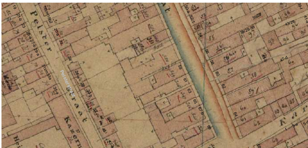
De kadastrale minuut van omstreeks 1830 met daarop aangegeven de moderne huisnummering.

Op de kaart van Haubois uit ca. 1643 wordt het huis met een zadeldak afgebeeld met de steeg aan de noordzijde. Ook wordt een diep achterhuis aangegeven, waarachter een dwars eenlaags gebouw stond. Op het minuutplan van ca. 1830 is het voorhuis goed herkenbaar. Achter het voorhuis was aan de linkerzijde een ondiepe aanbouw waarin zich in 1926 een trappenhuis bevond. Naast deze aanbouw was een even ondiepe binnenplaats. Deze toestand bestond nog tot in de 20ste eeuw. De bebouwing daarachter die mogelijk met het bij Haubois aangegeven achterhuis overeen kwam, hoorde toen bij het noordelijke buurpand.