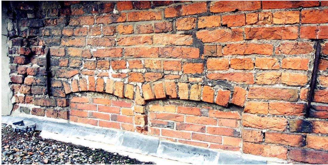
De bovenkant van het dichtgemetselde kruiskozijn in de zuidgevel.

de 15de eeuw dateren, waarmee tevens deze gevel gedateerd kan worden. De halfsteens invulling van dit kruisvenster zou 18de- of 19de-eeuws kunnen zijn.