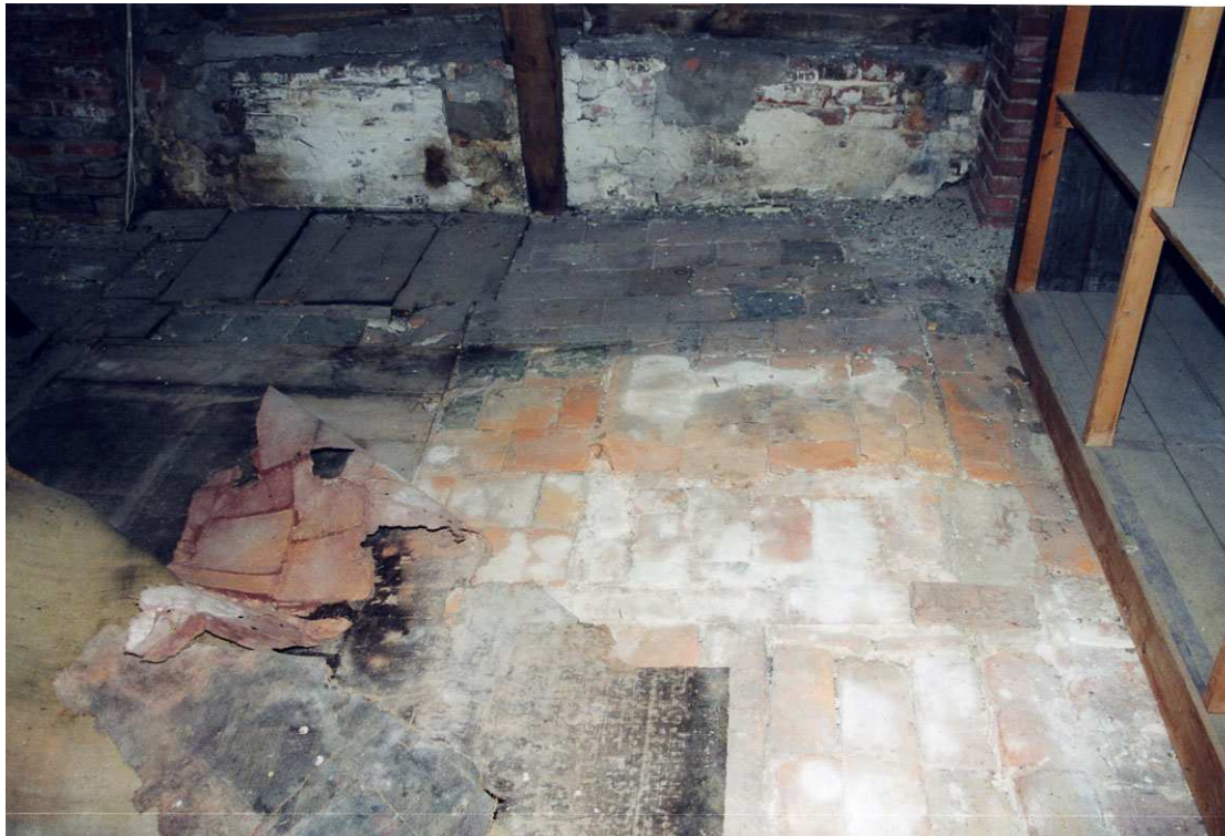
Een deel van de zolder heeft een bakstenen vloer.

De zoldervloer is vermoedelijk van oudsher een bakstenen vloer geweest die op de balken en ribben heeft gelegen. Een deel hiervan is bewaard gebleven in het vijfde en zesde vak in een soort rookkamer. De stenen meten ca. 28-28,5 x 12,5-13 cm.