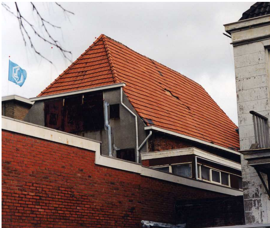
De achtergevel en zuidelijke zijgevel gefotografeerd in 2002.

De rechter (noordelijke) zijgevel is geheel van cementpleister voorzien en deels ingebouwd door de overbouw van het achterste deel van de steeg waar de trap zich bevindt. De gevel staat opvallend naar het zuiden uit het lood en kan net zo oud zijn als de linkerzijgevel. Ongeveer halverwege de gevel bevindt zich op de verdieping een moderne hijsdeur en een uitgemetselde schoorsteen.