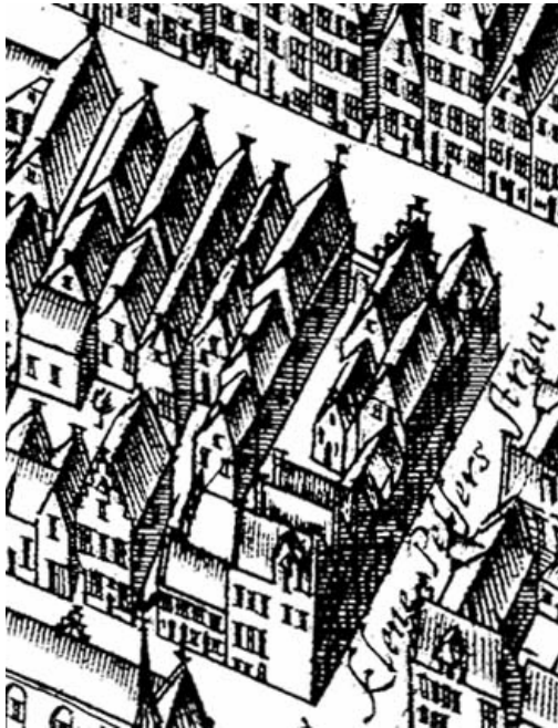
Detail van de kaart van Haubois uit omstreeks 1643 (het noorden op deze kaart is links). Herestraat 59 is het zevende huis gerekend vanaf de hoek met de Kleine Pelsterstraat.

Het is ieder geval duidelijk dat het huidige bouwvolume van het huis in het midden of de tweede helft van de 15de eeuw in één keer een doorgaande kap kreeg. Het is niet geheel duidelijk of toen het huis in één keer nieuw gebouwd werd of dat het in feite ging om een voorhuis en een achterkamer (wellicht van verschillende bouwdata) die toen verenigd werden onder één kap. Het is zeer wel denkbaar dat het huis een oudere kern heeft. Ook het gebruik van het aan één stuk gesmeedde anker, dat 14de-eeuws kan zijn, suggereert oudere stenen bouwfasen cq voorgangers.