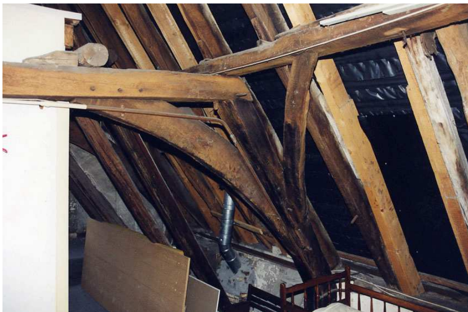
De kapconstructie van het voorste gedeelte van het voorhuis.

Deze constructie bestaat uit eikenhouten sporenparen, die oorspronkelijk elk waren voorzien van twee hanenbalken. Diverse hanenbalken zijn verdwenen. De sporenparen worden mede ondersteund door de vlieringen, die zijn opgelegd op een stelsel van acht spanten in de vorm van enkelvoudige schaargebinten met krommers. De lage borstweringen zijn gepleisterd. Slechts ter plaatse van