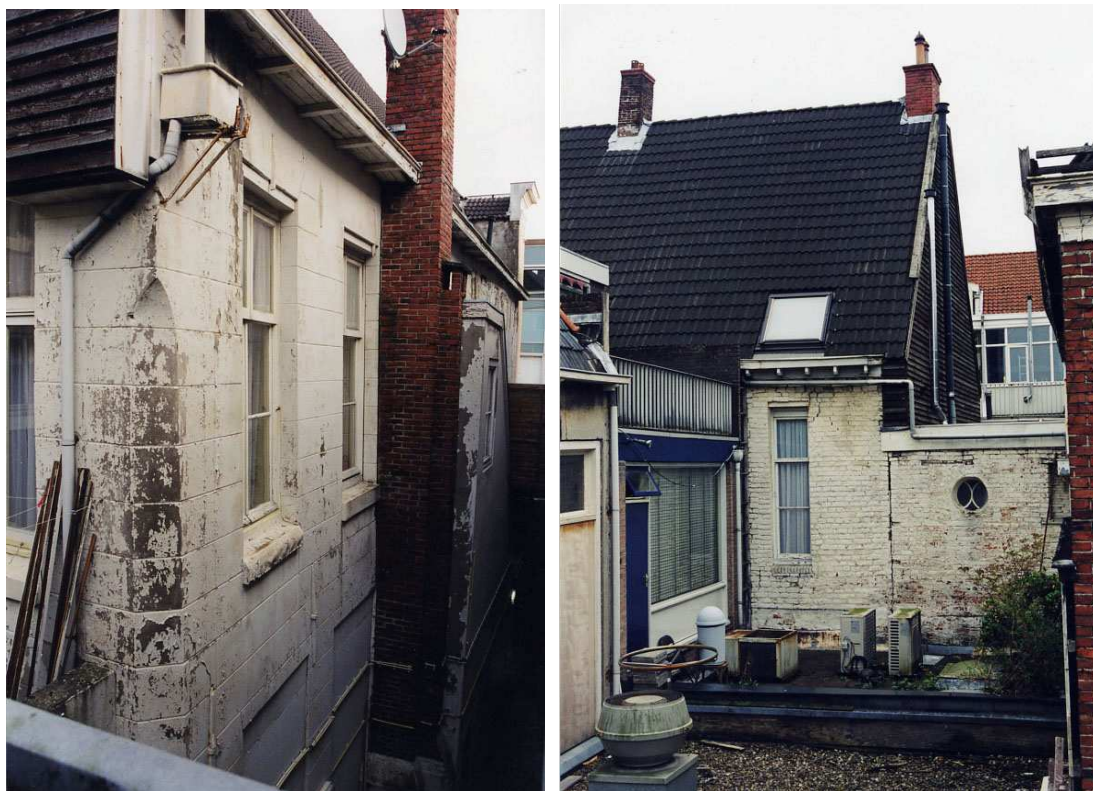
Links de zuidgevel met afgeschuinde muurhoek en westgevel en rechts het achterste gedeelte van de noordgevel.

De voorgevel is een drielaags lijstgevel met een gladde gepleisterde afwerking. De gevel heeft een laat-18de-eeuwse/ vroeg-19de-eeuwse opzet, het pleisterwerk een laat-19de-eeuws karakter. Op de begane grond bevindt zich een hoge pui van recente datum (1980 en later). De eerste verdieping bevat drie getoogde vensters, waarvan de kozijnen waarschijnlijk uit de eerste helft van de 19de eeuw stammen en de ramen uit de 20ste eeuw. Opvallend is dat deze vensters groter zijn dan de verdiepingshoogte, zodat er koven in de zoldervloer noodzakelijk zijn. Ook de tweede verdieping of mezzanino-verdieping heeft getoogde vensters. Hiervan stammen de kozijnen uit de eerste helft van de 19de eeuw, de ramen waarschijnlijk uit de late 19de eeuw of vroege 20ste eeuw.