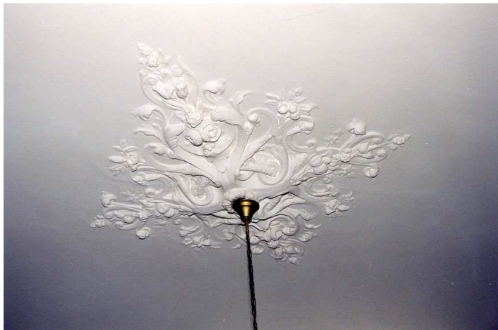
Het stucplafond in een van de achterste kamers op de verdieping van het voorhuis.

De voorkamer is een rechthoekige ruimte, waarvan de interieur-afwerking voor het grootste deel is gemoderniseerd in de 20ste eeuw. Van de 19de-eeuwse afwerking resteren nog de schouw met een zwartmarmeren schoorsteenmantel, een eenvoudig stucplafond met een randlijst en het deurkozijn met de tweepaneelsdeur. Opmerkelijk is de koof ter plaatse van de vensters in de voorgevel, die tenminste uit de vroege 19de eeuw moet stammen. Deze koof was noodzakelijk vanwege de toepassing van de te hoge vensters in de voorgevel. Ook de naastgelegen zijkamer is gemoderniseerd, met uitzondering van de betimmering van de vensternebben en de glasdeur (circa 1870/ 1880). Deze kamer heeft eenzelfde koof ter plaatse van het venster als de voorkamer. De achterkamer vertoont geen bijzonderheden. De zoldertrap dateert vermoedelijk uit de 19de eeuw.