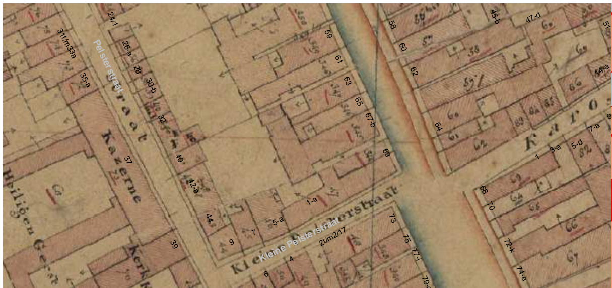
De kadastrale minuut uit omstreeks 1830 met daarop aangegeven de moderne huisnummering. Het huis heeft een achterhuis dat gedeeltelijk achter twee buurpanden ligt en een forse tuin.

In de late 18de eeuw of vroege 19de eeuw is de voorgevel verbouwd tot een drielaags lijstgevel. Om deze gevel een rijzig en voorname aanzicht te geven, heeft men de vensters van de eerste verdieping groter gemaakt dan de verdiepingshoogte. Inwendig is dit opgelost door toepassing van koven in de voorste kamers op de eerste verdieping. Op de eerste verdieping zijn verder nog twee 18de-eeuwse deuren te vinden. Wellicht stammen ook enkele tussenwanden op dit niveau uit deze periode.