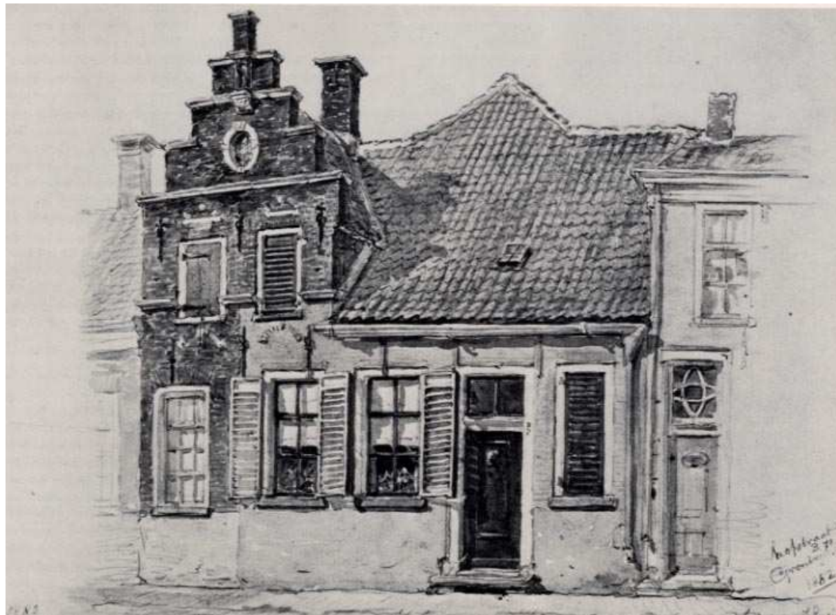
Hofstraat 20 getekend in 1882 door Jan Ensing.

Het afgebeelde trapgeveltje laat zien dat er sinds de bouw al de nodige wijzigingen hebben plaatsgevonden. Zo is alleen het originele ovale venster in de top nog intact en resteren van de overige 17 de eeuwse vensters alleen de ontlastingsbogen met deels nog de natuurstenen architraven. Kenmerkend voor de 17 de eeuw zijn verder de versierde muurankers waarvan de onderste rij doorloopt in het éénlaagse bouwdeel.