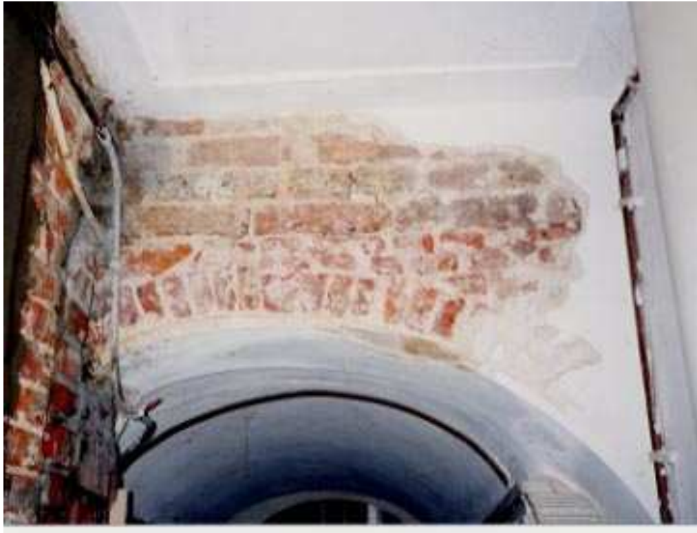
De gemetselde boog in de oude muur tussen het tongewelf en het hoge plafond van de gang.

Ook het muurwerk van de gang daarachter was aan de oostkant geheel kaalgehakt. Het baksteen formaat bedraagt ca. 27 x 13 x 5,5 a 6 cm. De 10 lagenmaat is 66 a 70 cm. Vermoedelijk gaat het om een halfsteens klampmuur. Deze muur en ook de vloer loopt naar achteren ongeveer 18 cm af. Dit duidt op een verzakking. Hierdoor is er een brede naad ontstaan met het oudere dwars geplaatste stuk muurwerk. Dit is opgevuld met brokken baksteen. De verzakking van het achterste ganggedeelte kan verklaard worden door de gracht die hier vroeger gelopen heeft.