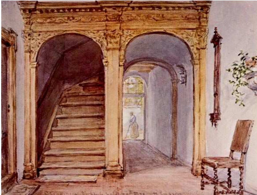
Het dubbelportaal uit 1689 in het pand Hofstraat 20 getekend door Jan Ensing in ca. 1882.