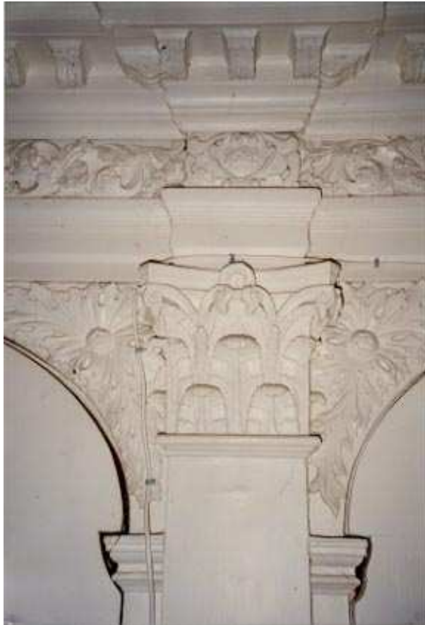
Detail van het dubbelportaal met het jaartal 1689.

Midden boven de beide doorgangen is een engelenkopje aangebracht met vleugels eronder. De kroonlijst wordt gedragen door een serie rijk versierde consoles. De beide doorgangen met de later aangebrachte deuren hebben korbboogvormige openingen. In de zwikken van de bogen zijn acanthusbladeren aangebracht. Onder in de korboggen bevindt zich lijstwerk. Dit lijstwerk loopt door de gang in. Aan de achterkant bevindt zich links een eenvoudige pilaster ter plaatse van de verspringing op de overgang van het voorste naar het achterste ganggedeelte.