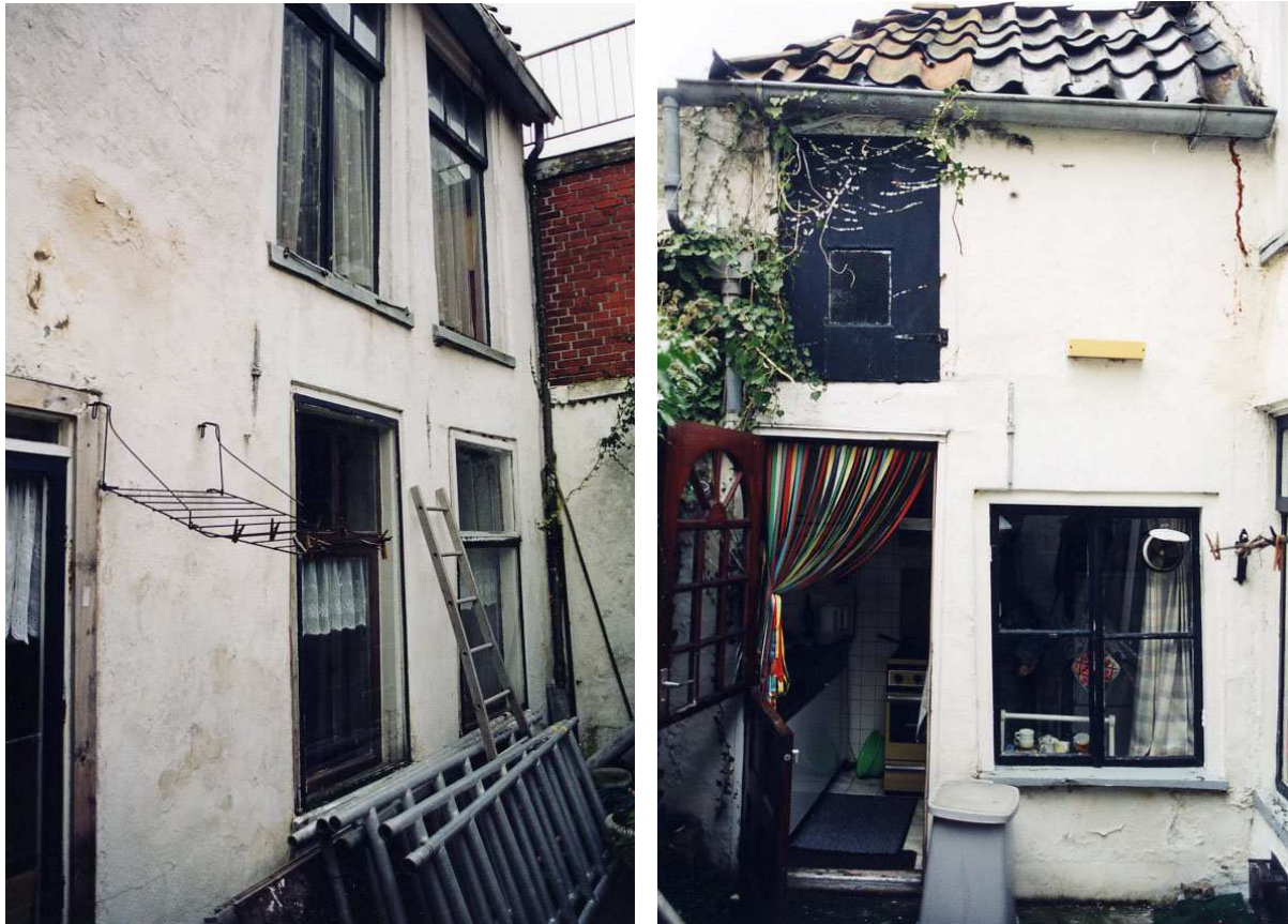
Links de achtergevel en rechts de zijgevel van de achteraanbouw.