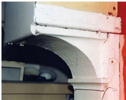
Console van de schouw van de stookplaats aan de rechterkant uit het midden van de 19 e eeuw.

In het voorste gedeelte ligt aan beide zijden van de middenmuur een kamer met een stookplaats in de zijmuur. De linker stookplaats dateert uit de 19de eeuw en heeft een rechthoekige gemetselde rookvanger. Er zijn nog overblijfselen van vermoedelijk 19de-eeuws gekleurd behang aangetroffen.