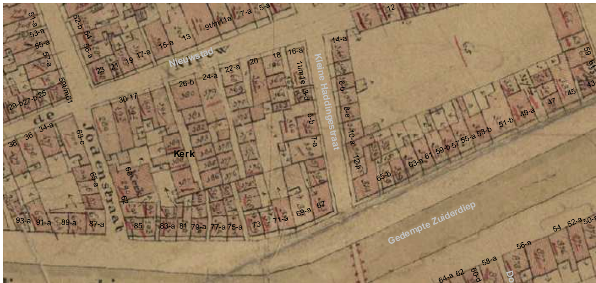
De kadastrale kaart van omstreeks 1830 met daarop aangegeven de moderne straatnamen en huisnummering.

De voorgevel kon wat betreft de kelder en de begane grond uit de 17de eeuw dateren. Een anker dat van boven pijlvormig eindigt suggereert een 17de-eeuwse datering voor de gevel. Het gebouw kan in aanleg 17de-eeuws, mogelijk zelfs 16 e eeuws. De als haanhout hergebruikte spoor zou 16de-eeuws kunnen zijn.