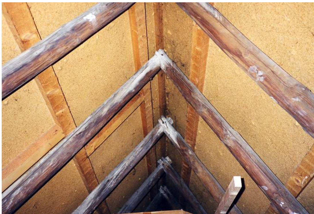
De kapconstructie met de aansluiting van de sporen in de nok.

De kap dateert vermoedelijk uit de bouwtijd van het huis en bestaat uit sporenparen van gekantrechte en rondhouten sporen van naaldhout (mogelijk dennenhout). De sporen zijn gekoppeld door middel van hanebalken en halfhouts aansluitingen in de nok. Een aantal hanebalken zijn hergebruikte eikenhouten hanebalken. De overige hanebalken zijn van grenenhout. Er zijn geen telmerken zichtbaar. Ten behoeve van het windverband zijn schrankhouten aangebracht. De verbindingen zijn genageld.