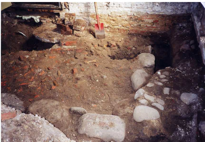
De opgraving nadat de plavuizenvloer was verwijderd, gezien in de richting van de gang.

Aan de buitenzijde van de achtergevel was bovendien een deel van de fundering zichtbaar. Onder de 17 e eeuwse stenen van het opgaande werk waren bakstenen van veel grotere afmeting te zien. Zeer waarschijnlijk zijn dit hergebruikte kloostermoppen omdat de zichtbare stenen vooral bestonden uit ¾ stenen en stenen met andere maten. De dikte van de stenen varieerde van 8 à 9 cm.”