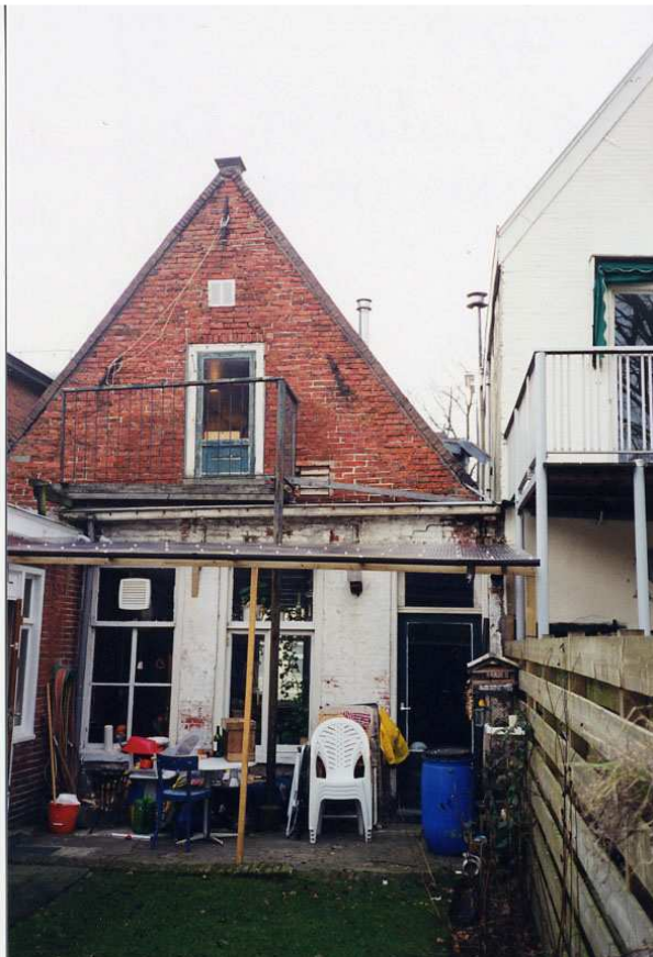
De achtergevel gezien vanuit de tuin.

In de geveltop zit een 20 e eeuwse deur die lange tijd als vluchtdeur heeft gediend maar nu is vastgezet omdat de vluchtroute onbruikbaar is.