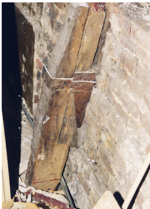
Spantbeen aan de westzijde in de kap van Kleine Pelsterstraat 5. Het spantbeen is aan de onderkant verlengd door middel van stukken eikenhout, met haaklassen.