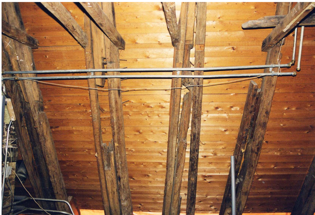
Beschadigde sporen in de kap (achteraan gezien naar het oosten) met later aangebrachte verstevigingen.