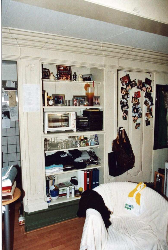
De kastenwand van de woonkamer op de begane grond.

De begane grond heeft een enkelvoudige balklaag, bestaande uit balken met een kraalprofiel (waarneming 1993). Nu zijn deze balken voorzien van betimmering.