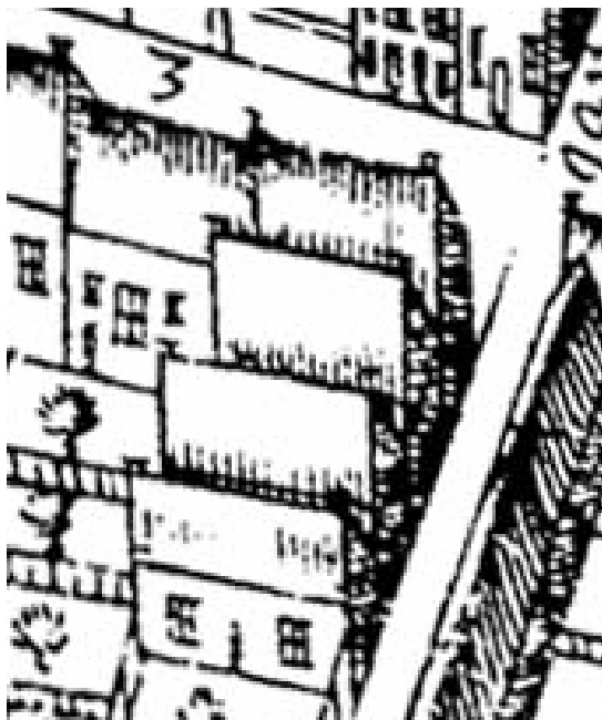
Uitsnede uit de kaart van Haubois uit omstreeks 1643, het noorden is op deze kaart links. Boven is de Kleine Steentilstraat en rechts de Kosterstang.

Het pand Kleine Steentilstraat 7 moet in opzet uit de late 16de of vroege 17de eeuw dateren, zo valt op te maken uit het metselwerk van met name de zijgevel (Kosterstang) en de sporen van kloostervensters. Eveneens op een laat-16de-eeuwse of vroeg-17de-eeuwse datering wijzen enkele balken met sierlijke consoles in renaissancestijl boven de eerste verdieping.