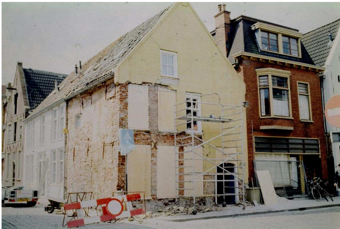
Het pand tijdens de verbouwing in 1993

In zijn huidige vorm heeft het huis Kleine Steentilstraat 7 een overwegend 18de-eeuwse opzet. Dit geldt voor de voorgevel (aan de Kleine Steentilstraat), de voordeur, de indeling van de begane grond met onder meer een bedstedewand en schouw en de balklagen. De samenhang met het 18de-eeuwse huis Kostersgang 38 is niet duidelijk. Wel hebben beide panden een samenhangende bouwmassa. Op de