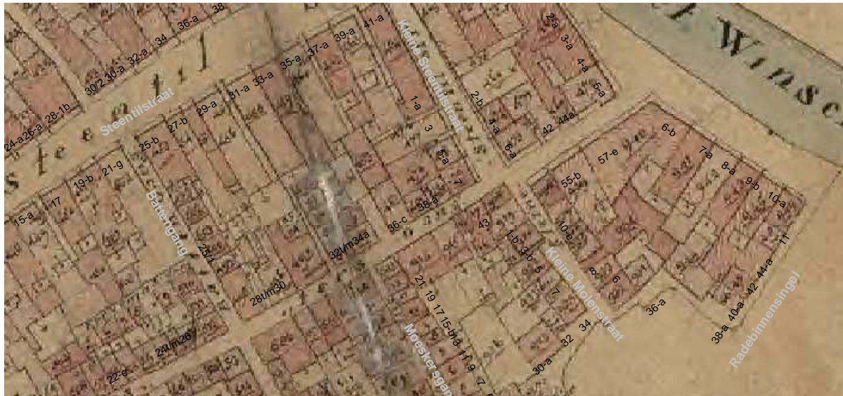
De kadastrale kaart van omstreeks 1830 met daarop aangegeven de moderne huisnummers.

In 1916 zijn de gevels opnieuw bepleisterd. Volgens de opmeting van 1933 bevatte de begane grond van het huis een café en zijkamer (met bedstede en schouw). Een smalle doorgang vormde de verbinding met een keukenaanbouw op het binnenterrein achter Kleine Steentilstraat 5/ Kostersgang 38. Een trap staat niet getekend, maar was volgens de tekening uit 1925 wel aanwezig achter het café. Met de verbouwing in 1933 werd de bestaande keuken gesloopt. De naastgelegen eenkamerwoning in het pand Kostersgang 38 is ingericht tot een nieuwe keuken. Het café bleef ongewijzigd. In 1969 is het café opgeheven, waarna de indeling is aangepast.