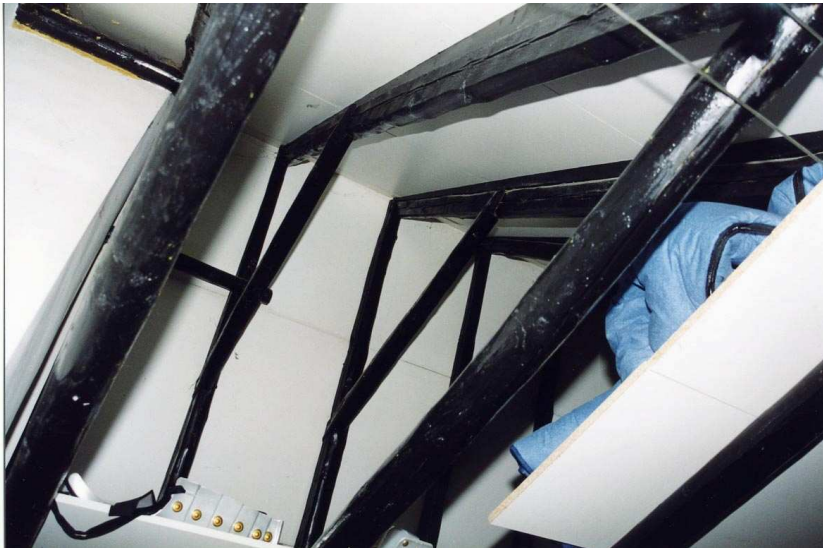
De 17 e eeuwse kapconstructie van het zadeldak van het dwarshuis.

De derde bouwlaag is samengesteld uit het zadeldak van het dwarshuis en de tweede verdieping van de aanbouw. De tweede verdieping van de aanbouw heeft een set-back ten opzichte van de achtergevel van begane grond en eerste verdieping, zodat er binnen de contour van de bouwmassa plaats is voor een stalen trap. Deze trap leidt vanaf de tweede verdieping naar het dakterras op het platte dak (van de drielaags aanbouw).