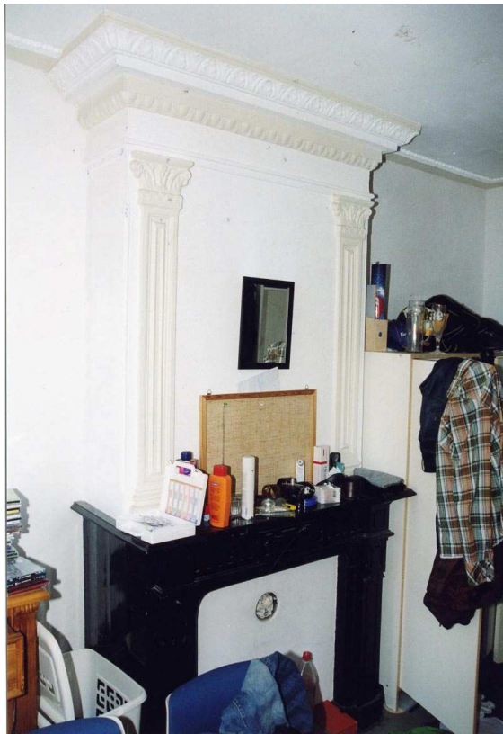
19 e eeuwse schouw op de verdieping tegen de oostwand van de voorkamer.

Ook de ruimte in het uitstek heeft geen bijzonderheden.