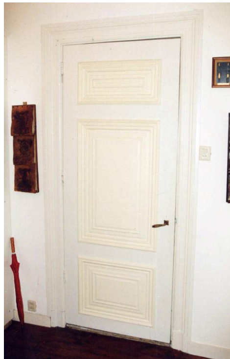
Twee foto's van 19 e eeuwse deuren op de begane grond

De achterkamer heeft een soortgelijke interieur-afwerking. Ook hier is sprake van een eenvoudig stucplafond met een plintlijst, een schouw met zwartmarmeren schoorsteenmantel tegen de linker zijgevel en driepaneelsdeuren. De schuine neggen van de doorgang met schuifdeuren hebben driepaneelsbetimmeringen. Het afwijkende beloop van de plintlijst in het stucplafond markeert de plaats van één of twee verdwenen kasten, eertijds rechts naast de schouw gesitueerd.