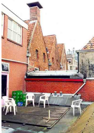
De middelste van de drie topgevels is Noorderhaven 38

puntgevels. Deze gelijkvormige opzet valt nog goed te herkennen in de panden Noorderhaven 36, 38 en 40, zowel in de bouwmassa als de achtergevels.