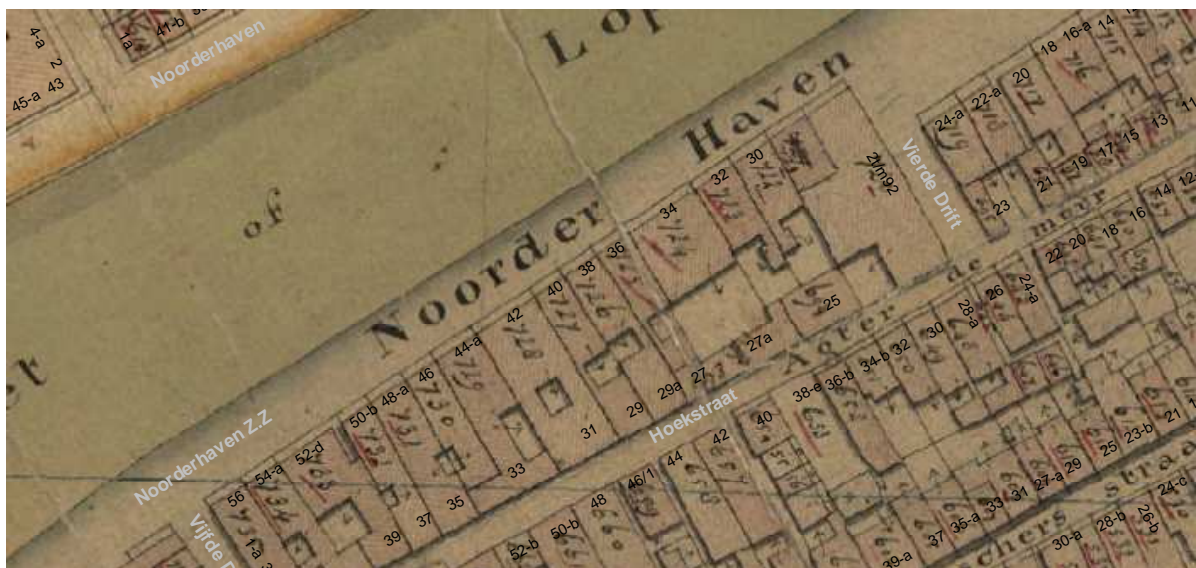
De kadastrale minuut van omstreeks 1830 met daarop aangegeven de moderne huisnummering.

In de 18de eeuw is het pand Noorderhaven 38 gemoderniseerd, waarbij de woonruimten op de begane grond en eerste verdieping een luxe afwerking kregen. Hiervan getuigt onder meer de het rijk gedecoreerde trap tussen de begane grond en eerste verdieping van het voorhuis. Tot circa 1992 bezat het huis bijzondere laat-18de-eeuwse wandbetimmeringen met geschilderde lambriseringen en 'Hollandse' landschappen. Hiervan is een deel behouden gebleven achter een moderne Ook het voorhuis Ook het voorhuis (Hoekstraat 29a) moet grondig zijn vernieuwd in de 18de eeuw, waarbij gevels, constructie, indeling en afwerking zijn vernieuwd. Van de 17de-eeuwse bebouwing op die plaats zijn hooguit restanten behouden gebleven.