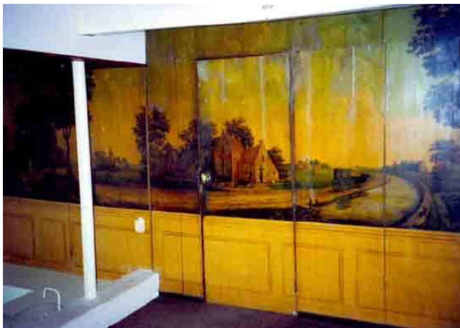
Foto van het interieur van de achterkamer op de begane grond, voor de verbouwing van 1992 waarbij deze wand is verwijderd.