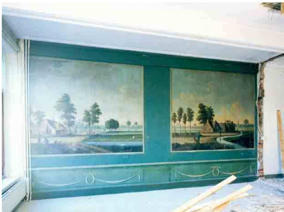
De linker wand op de eerste verdieping met geschilderde lambrizing en landschappen die achter een moderne wand verborgen is.

De zolder is via de vide in open verbinding geplaatst met de eerste verdieping. De constructie is geheel aan het zicht onttrokken door systeemplafonds. De vorm van de afwerking doet vermoeden dat de oude constructie deels of geheel gehandhaafd is bij de verbouwing in circa 1992.