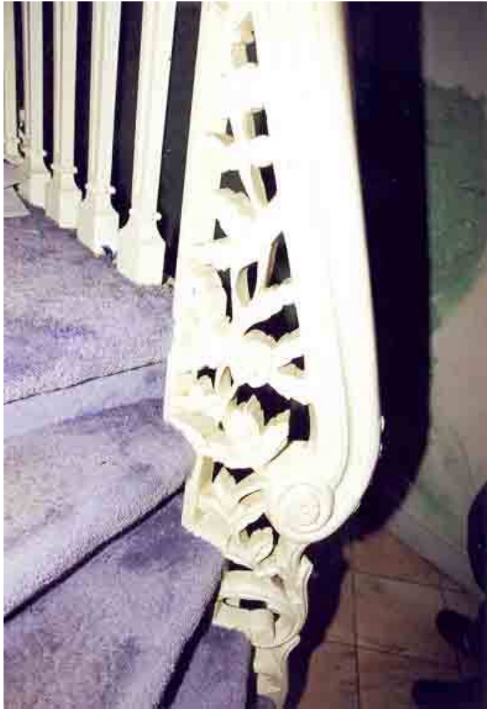
Detail van de 18 e eeuwse trap in de gang

ter hoogte van de opkamer/ achterkamer. De trap heeft een sierlijke leuning met bladwerk en bloemen in de aanzet, opengewerkte balusters en een geprofileerde handlijst. De treden zijn omgezet over de trapboom, terwijl de kardoezen bladwerk bezitten.