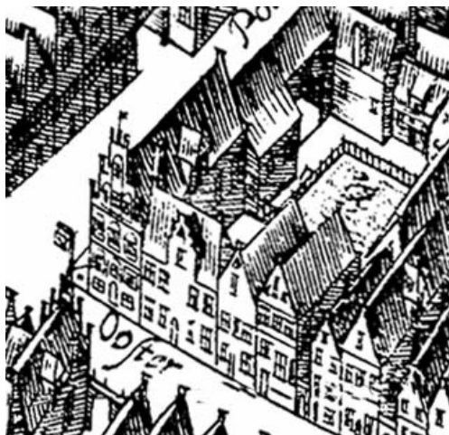
Uitsnede uit de kaart van Haubois uit omstreeks 1643, het noorden is op deze kaart links. Oosterstraat 8 is het vierde huis vanaf de straathoek links. Rechts van het huis is de steeg met poortje aan de straat goed zichtbaar.

Op de kaart van Haubois uit ca.1643 wordt een diep huis met zadeldak en steegje aan de rechterkant aangeduid. Er wordt geen achterhuis aangegeven.