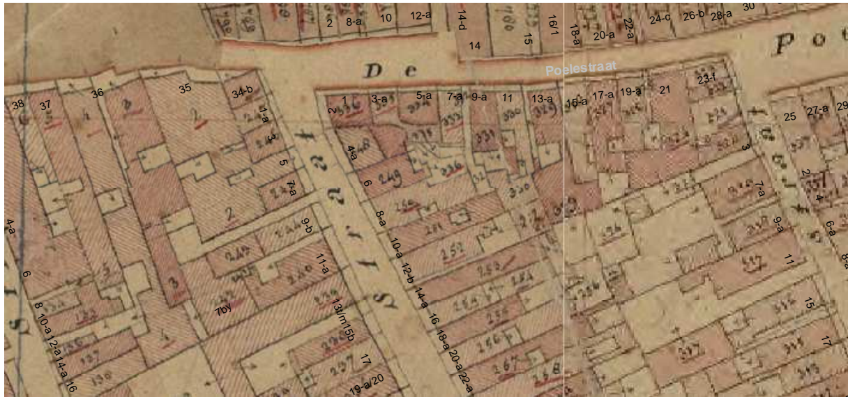
De kadastrale minuut uit omstreeks 1830 met daarop aangegeven de moderne huisnummering.

Op het minuutplan van omstreeks 1830 ziet men het voorhuis waarbij de steeg aan de rechterzijde aan de voorzijde overbouwd is. Aan het voorhuis sluit een achterhuis aan met een binnenplaats aan de linkerzijde. Tot 1930 was deze situatie nog herkenbaar. Het achterhuis had twee bouwlagen en een steil dak. De binnenplaats was toen overbouwd. De huidige lijstgevel kwam vermoedelijk aan het eind van de 18de of in de vroege 19de eeuw tot stand. In ieder geval was de steeg op het minuutplan van omstreeks 1830 al ingebouwd wat betreft het voorste gedeelte. Het achterste gedeelte was een binnenplaatsje geworden. Dat zou erop kunnen wijzen dat de gevel vóór omstreeks 1830 is gebouwd. De voorgevel is van kisklezoren bij de vensterkanten voorzien, waaruit is af te leiden dat deze vóór circa 1830 zou kunnen dateren. De gevel lijkt trouwens zeer sterk op die van de noordelijke buurman nr. 10.