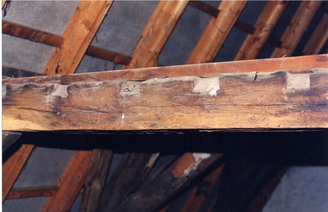
Een van de dekbalken waarin kepen zitten waarin oorspronkelijk kinderbalken in bevestigd zaten.

Over de 15de-eeuwse kap kan nog opgemerkt worden dat de gebintstijlen langer waren dan de tegenwoordige. De dekbalken zaten derhalve hoger. Dergelijke hoge gebinten zijn bijvoorbeeld ook aangetroffen bij Gelkingestraat 14/16 dat volgens dendrochronologisch onderzoek uit 1408 dateert.