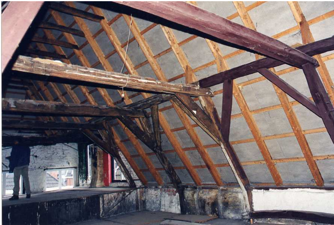
Overzicht van de kapconstructie gezien in de richting van de voorgevel.

In het vierde gebint is aan de zuidelijke gebintstijl een 3 met vlaamse dwarsstreep aangebracht en aan de noordzijde een 3 van gekraste strepen. In het derde gebint bij de noordelijke gebintstijl is een 4 met vlaamse dwarsstreep te zien en in het tweede gebint bij de zuidelijke stijl een 2 met vlaamse dwarsstreep en aan de noordzijde een 2 van gekraste strepen. Kortom, er zijn duidelijk twee systemen door elkaar gebruikt. Het systeem met de gutsen en gezaagde merken is het jongste en de geritste merken met aan één zijde een vlaamse dwarsstreep is het oudere systeem. Dit duidt op hergebruik.