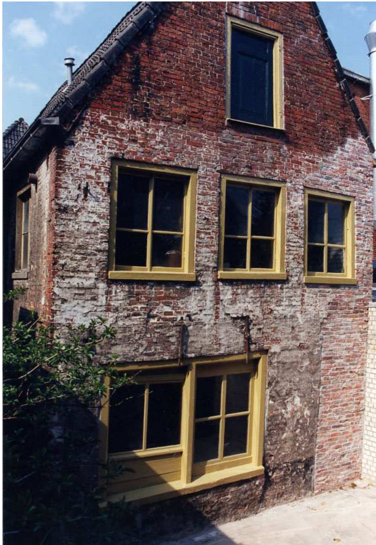
De achtergevel van het achterhuis.

De twee andere vensters zijn vierruiters met een vrij breed roedenkruis.