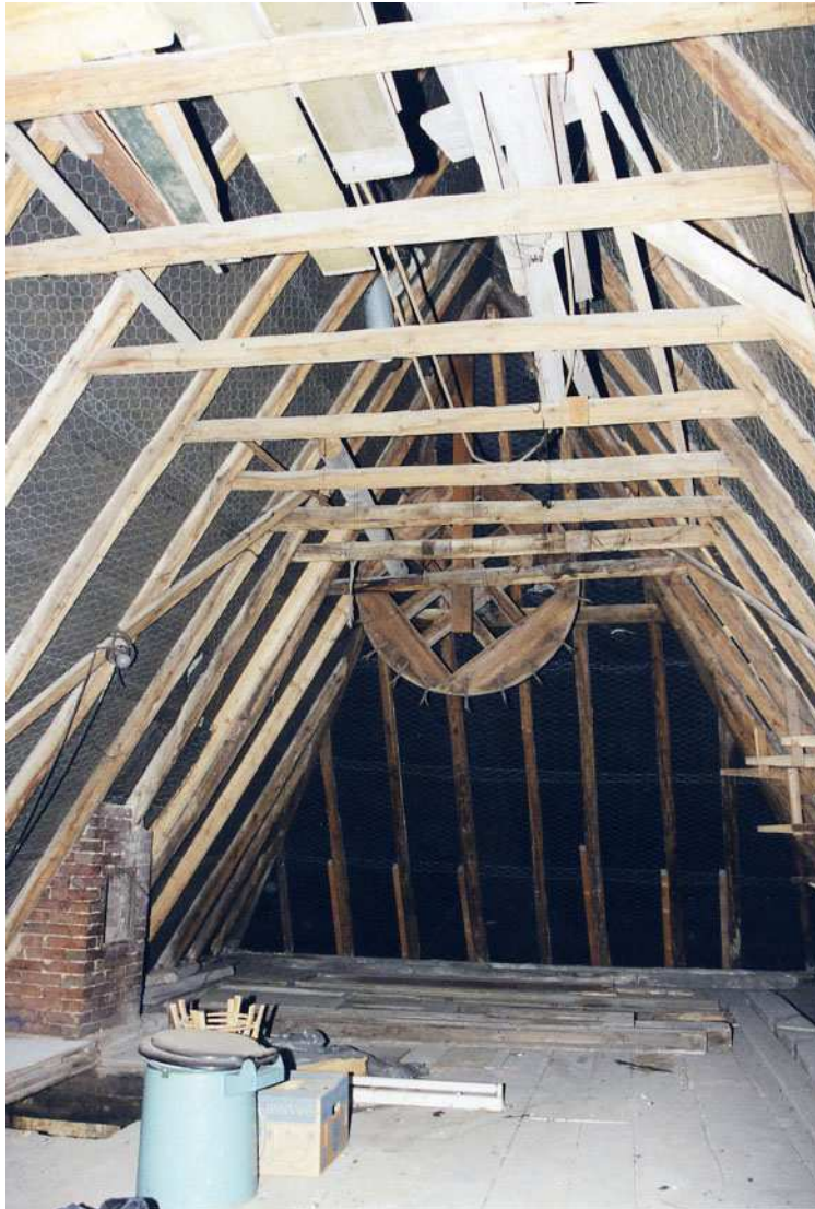
De kapconstructie van het achterhuis.

Waar de nok en het voorschild bij elkaar komen bevindt zich een goed bewaard gebleven hijsrad. Vermoedelijk heeft zich ook dichtbij de achtergevel een hijsrad bevonden. Hier is namelijk een hijsdeur in de topgevel en vlak achter deze deur bevindt zich een oud luik in de zoldervloer dat met de vroegere aanwezigheid van een hijsrad in verband kan staan. De zoldervloer bestaat uit oude grenen delen met losse veren. De delen zijn 2,7 cm dik en zijn soms 30 cm. breed, waarbij de breedte ongelijk is.