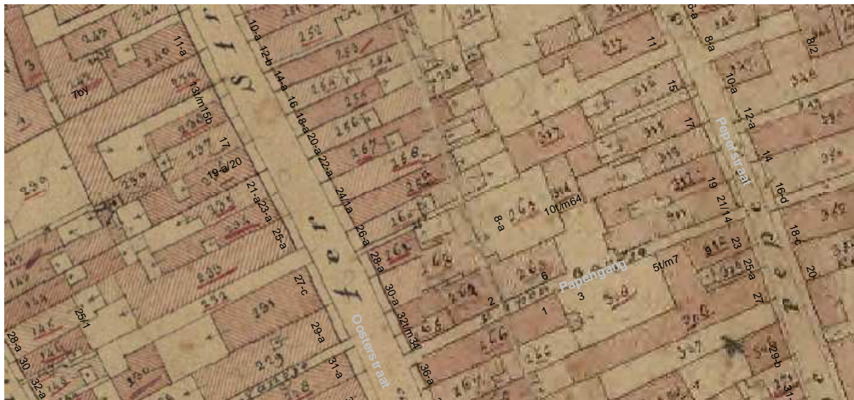
De kadastrale kaart uit omstreeks 1830 met daarop aangegeven de moderne huisnummering. Duidelijk is ook hier de structuur van een voor- en achterhuis herkenbaar evenals de steeg ten zuiden van het pand.

In de 18de eeuw heeft het achterhuis een nieuwe sporenkap en een nieuwe topgevel gekregen en een aantal vensters. Het achterhuis kreeg vermoedelijk een andere hoogte-indeling, waarbij de zijmuren hun oorspronkelijk hoogte behielden. Bij die gelegenheid kan de huidige grenen balklaag die de zoldervloer moest dragen tot stand zijn gekomen en kan de eiken balklaag boven de begane grond op de huidige plek zijn terecht gekomen. In hoeverre de kelder in stand bleef was onduidelijk.