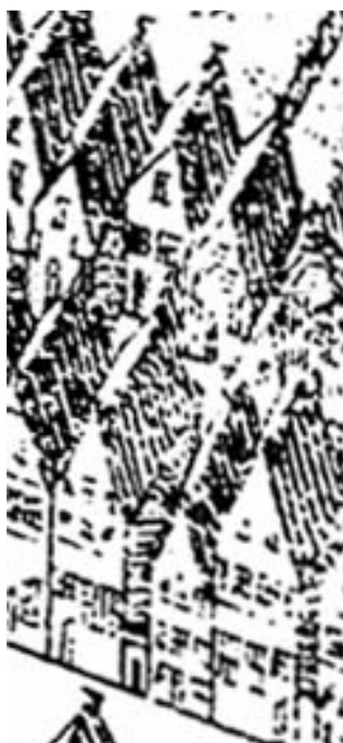
Uitrsnede uit de kaart van Haubois uit omstreeks 1643, Oosterstraat 26 is het pand links van het steegje dat aan de straatkant met een poortje is aangegeven. Het noorden is op deze kaart links.

Het voorhuis is opgezet als een onderkelderd huis met twee bouwlagen waarbij de beide zijmuren ca. 45 cm (anderhalfsteens) dik waren. In de rechter muur zal de oorspronkelijke haard gelegen hebben. In deze muur konden twee haardpartijen gezien worden, dat betekent dat aan de andere kant de doorloopzijde was. Hier was in latere tijden inderdaad de gang. Ook op de kaart van Haubois (ca. 1643) wordt de deur aan deze zijde aangeduid. De kern van dit voorhuis kan 15de-eeuws zijn gezien de tienlagenmaat van 87,5-91 cm. Mogelijk is hiervan de kap bewaard gebleven gezien de steile dakhelling.