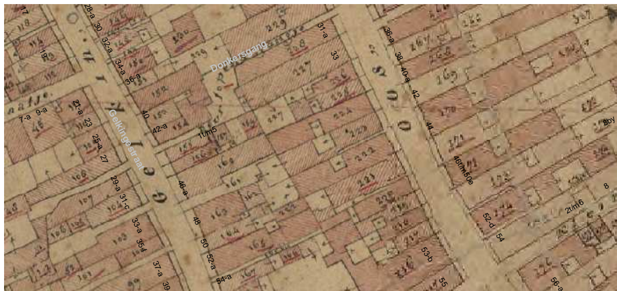
De kadasterkaart uit omstreeks 1830. Oosterstraat 41 ligt tegenover Oosterstraat 42/44.

Het huidige achterhuis heeft zijgevels die mogelijk uit de 18de of 19de eeuw dateren. Op het minuutplan van omstreeks 1830 heeft het achterhuis in ieder geval de huidige omtrek en is ook de binnenplaats met de gang aan de linkerkant te zien. De steeg naast het voorhuis was toen nog niet overbouwd.