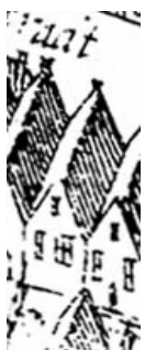
Uitsnede uit de kaart van Haubois uit omstreeks 1643.

Op de kaart van Haubois uit ca. 1643 wordt het huis zonder achterhuis weergegeven. Het is echter niet zeker of het huis ook inderdaad geen achterhuis had in de 17de eeuw omdat dergelijke huizen doorgaans achterhuizen hadden.