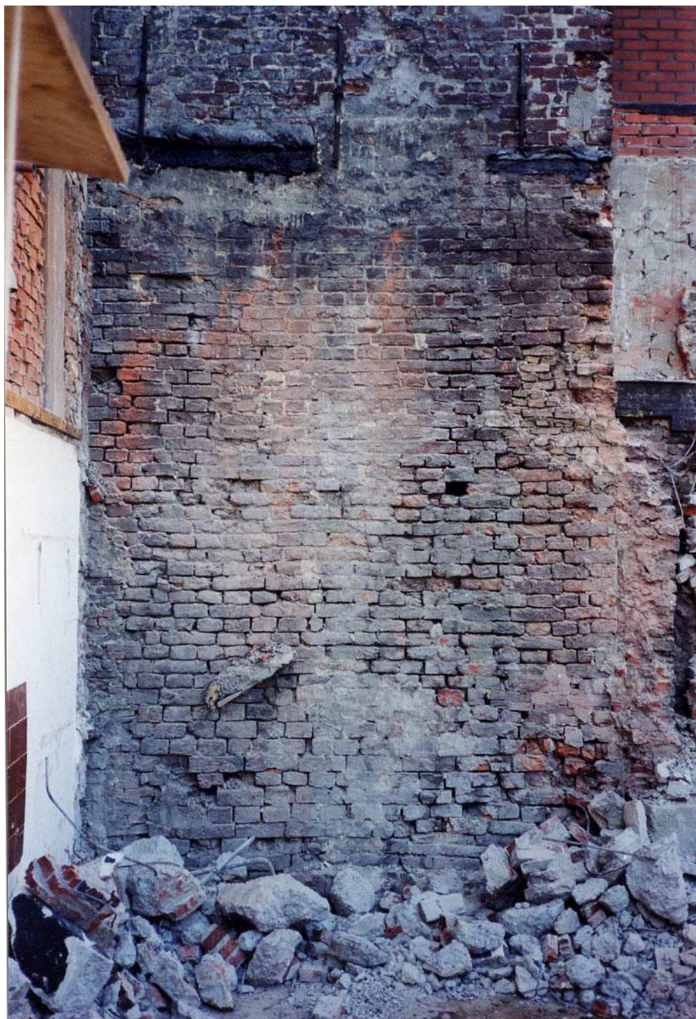
De zuidelijke zijmuur van de achterkamer gefotografeerd in 1997.