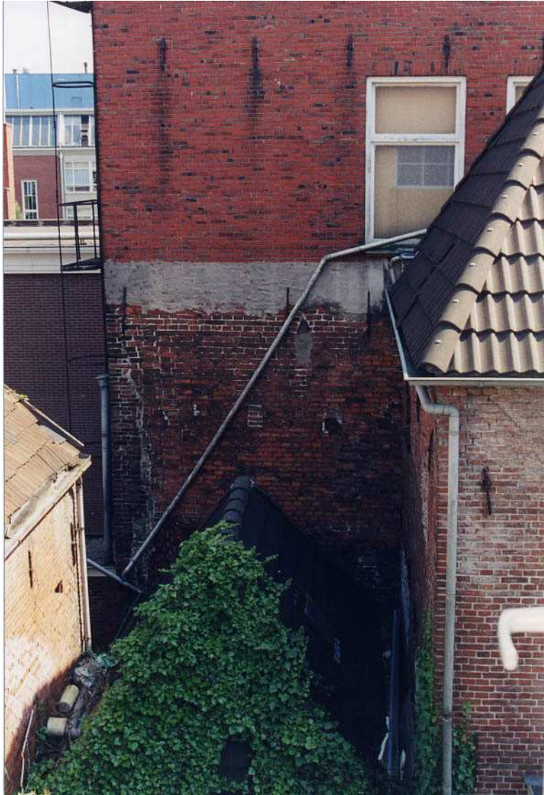
Het achterste gedeelte van de linker zijgevel (noord) van het achterhuis.

Het voorste gedeelte van de noordelijke zijmuur is tot en met de eerste verdieping in staand verband gemetseld en heeft een 10-lagenmaat van 76 cm. Dit muurwerk kan uit de 17de eeuw stammen en geeft de afmeting van het voorste achterhuis aan. Op de verdieping bevinden zich twee vierruitsvensters met dikke kozijnen met kwartrondprofiel. Het betreft in aanleg mogelijk 18de-eeuwse vensters.