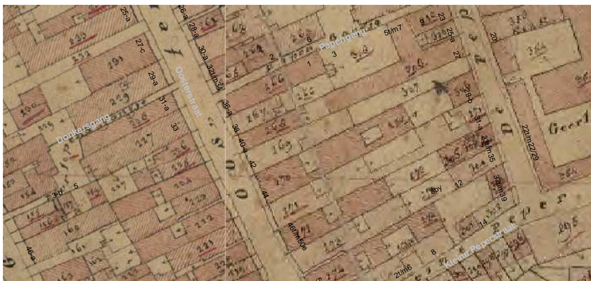
De kadastrale kaart uit omstreeks 1830 met daarop aangegeven de moderne huisnummering.

Achter dit achterhuis geeft Haubois een open ruimte aan ter breedte van het perceel die doorloopt tot de Peperstraat. Aan de Peperstraat was een poort die toegang tot de open grond gaf. Het lijkt erop dat Oosterstraat 42 een eigen toegang tot de Peperstraat had. Dit duidt erop dat het pand van oudsher een belangrijk pand met een groot perceel is geweest.