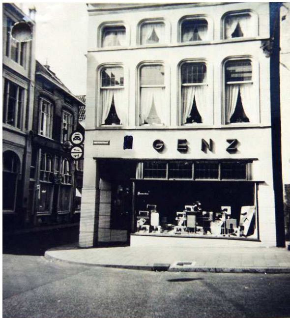
De voorgevel gefotografeerd in 1960.

In de tweede helft van de 20ste eeuw moeten meerdere verbouwingen hebben plaatsgevonden, waarbij onder meer de pui is gemoderniseerd en een luifel is toegevoegd. Ook inwendig hebben grondige veranderingen plaatsgevonden. Zo is de indeling op de begane grond en eerste verdieping geheel verwijderd, terwijl in de vloer van de eerste verdieping een vide is gemaakt. Een steile trap midden in de winkel vormt de verbinding met de resterende omloop op de eerste verdieping.