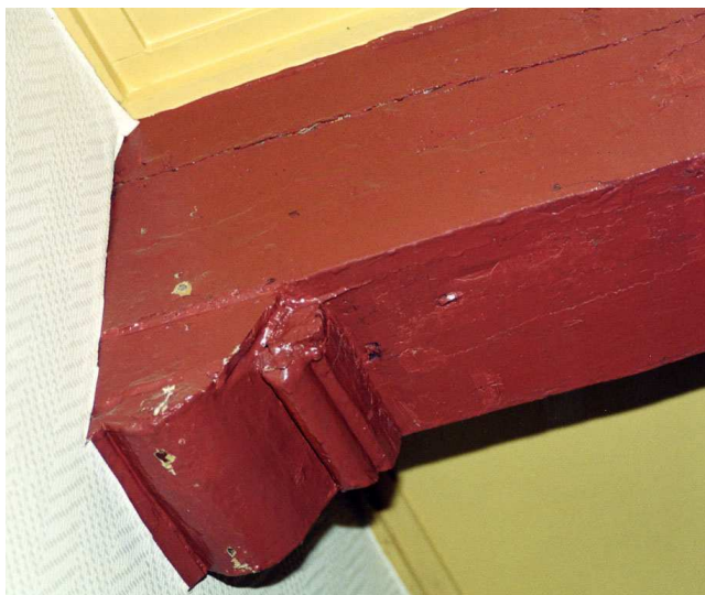
Een van de 17 e eeuwse consoles boven de eerste verdieping.

De begane grond en de eerste verdieping zijn ingericht als een winkelruimte. Door verwijdering van vloerdelen is de verdiepingvloer gereduceerd tot een omloop (langs de noordgevel, voor- en achtergevel), bereikbaar via een steile, vrijstaande trap in de winkel. De enkelvoudige balklaag boven de begane grond bestaat uit smalle, hoge balken, die gezien de maatvoering waarschijnlijk uit de late 19de eeuw of vroege stammen. Blijkens de bouwtekening van 1939 is de (bestaande) balklaag met 40 cm verlaagd. Boven de eerste verdieping bevindt zich een enkelvoudige balklaag met grenenhouten balken (in zeven velden), die aan de noordzijde nog gedeeltelijk voorzien is van geprofileerde houten consoles. Zowel de balken als de vier bewaard gebleven consoles stammen evident uit de 17de eeuw.