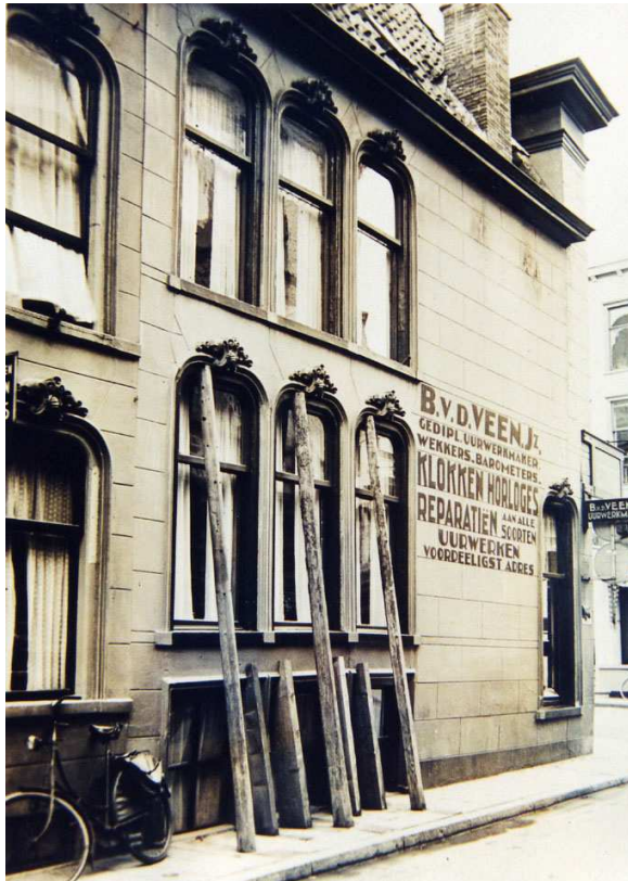
De zijgevel aan de Carolieweg in 1938.

In het derde kwart van de 19de eeuw is het hoekpand zowel uitwendig als inwendig zeer grondig verbouwd. Zo werd de voorgevel gewijzigd van een top- of trapgevel in een brede lijstgevel en kregen beide gevels een gepleisterde afwerking met schijnblokken en geprofileerde lijsten rond de vensters. De voorgevel kreeg bij die gelegenheid ook een winkelpui. Zeker is dat het voorste deel van het huis op dat moment geen souterrain (meer) bezat. Verder moeten de indeling en de interieur-afwerking vrijwel geheel zijn vernieuwd. In de huidige situatie valt nog slechts vast te stellen dat de balklaag boven de begane grond en de resterende interieurelementen alle uit het derde kwart van de 19de eeuw stammen.