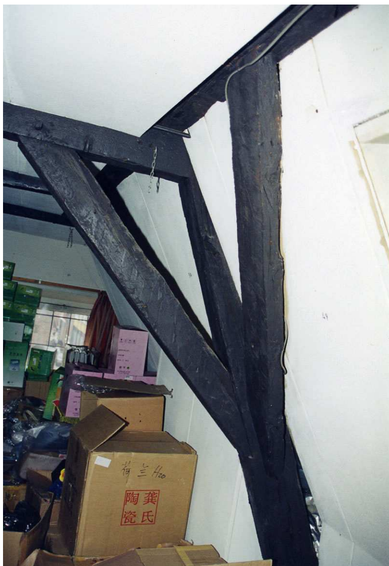
De 17 e eeuwse kapconstructie.

Het trappotaal van de trap tussen de eerste verdieping en zolder wordt afgesloten door een eenvoudig deurkozijn met een spiegelklampdeur (waarschijnlijk 19de-eeuws), dat klaarblijkelijk van elders afkomstig is.