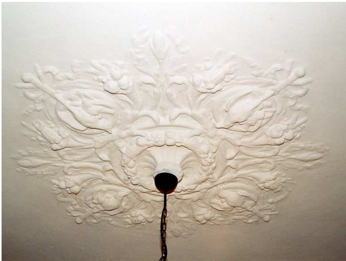
Het middenornament van het stucplafond van de achterkamer.

De keuken heeft een keukenschouw in de oostelijke wand. Bij de overloop is vooraan een steektrap naar de zolder met links daarvan een WC. Deze ruimte heeft een lichtkoker gehad die dichtgezet is. Daarachter ligt de bordestrap van de begane grond naar de verdieping.