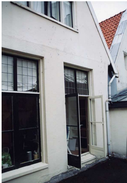
De achtergevel gezien vanaf het platte dak van de aanbouw.

Het voorschild is belegd met zwart geglazuurde 20ste-eeuwse verbeterde Hollandse pannen.