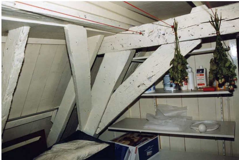
Een van de kapgebinten van de dakconstructie.

Op het linker korbeel van gebint 2 is een gekraste 2 te zien, op het rechterkorbeel van gebint 4 een gekraste 3, en op het linkerkorbeel van dit gebint een gekraste gebroken 3, waarvan één teken gebroken is.