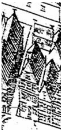
Uitsnede uit de kaart van Haubois omstreeks 1643, het noorden is links. Oude Boteringstraat 41 is afgebeeld met links van het huis een steegje.

Het is denkbaar dat het pand ooit opgehoogd is, waarbij de kap werd aangepast of iets dergelijks. Hoe deze bouwgeschiedenis er precies uitziet moet door nader bouwhistorisch onderzoek vastgesteld worden.