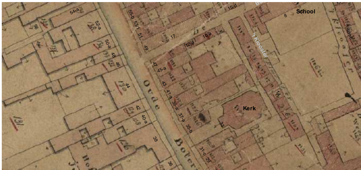
De kadastrale minuut van omstreeks 1830 met daarop aangegeven de moderne huisnummering.

Haubois geeft geen diep achterhuis aan, maar toch is het goed mogelijk dat dit desondanks wel degelijk bestaan heeft omdat er op het minuutplan van ca. 1830 achter het huis een achterhuis aangeduid wordt. Dit is in de loop der tijden bij de noordelijke buurman terechtgekomen, zodat het perceel niet meer zo lang is als de andere percelen van dit blok van de Boteringstraat. Op het minuutplan is achter het huidige voorhuis een zeer ondiepe binnenplaats met een gang aan de rechterzijde en daarachter een slechts 2 m diepe achterbouw dat de hele breedte van het perceel in beslag neemt. Op een plattegrond uit 1919 is deze situatie nog goed herkenbaar. De ondiepe achterbouw was toen een keuken. Uit de opmeting valt af te leiden dat de voormuur van de achterbouw heel licht was en de achtermuur vrij zwaar. Deze achtermuur kan vermoedelijk geïnterpreteerd worden als de voormuur van een ouder achterhuis.