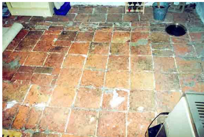
Links een van de gebinten van de eikenhouten kapconstructie en rechts de zeldzame zoldervloer van grote dikke vloertegels op houten ribben.

De zolder heeft een grote voorkamer toegankelijk via een 19de-eeuwse tweepaneelsdeur met knierscharnieren. In de afscheidingswand bevindt zich overigens ook een dichtgezette driepaneelsdeur met glas in de panelen.