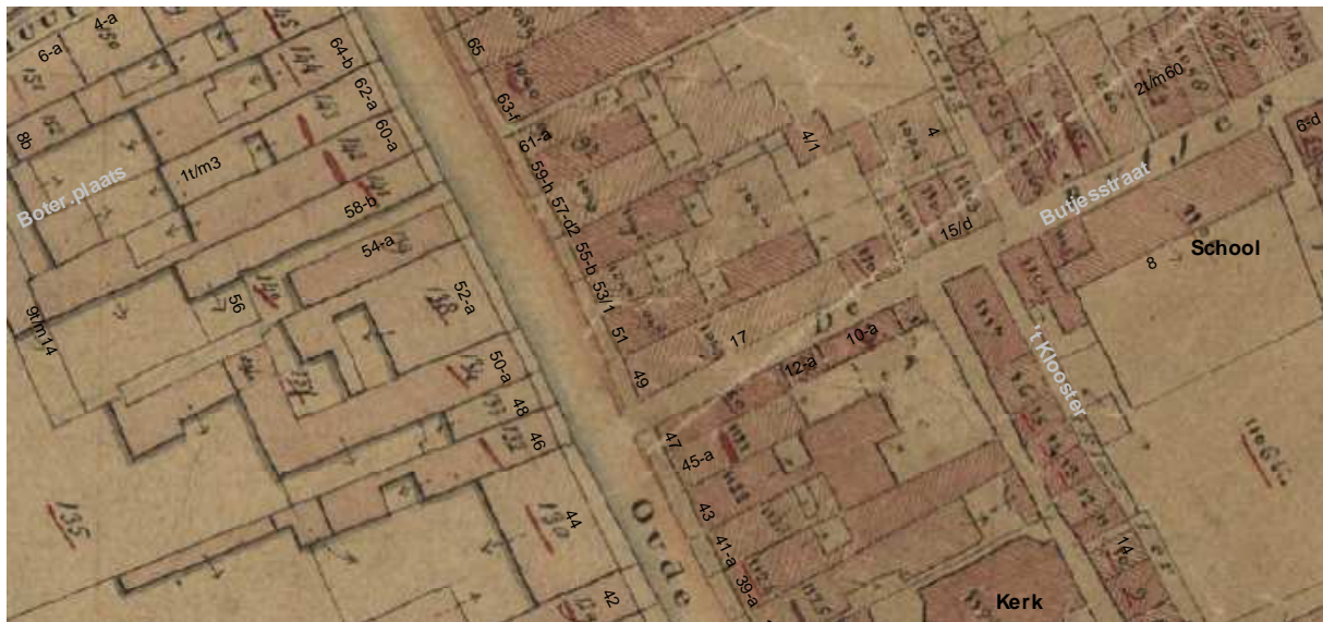
De kadastrale minuut uit omstreeks 1830 met daarop aangegeven de moderne huisnummering.

Op het minuutplan van omstreeks 1830 worden een diep voorhuis en een diep achterhuis aangegeven met een binnenplaats ertussen met aan de rechterkant een gang. Het voorhuis en de gang zijn in het huidige pand nog terug te vinden. De open grond achter het achterhuis hoorde er ook bij en het terrein kon via een dwarssteeg naar de Butjesstraat achter de zuidelijke buurman bereikt worden. De achterste 15 meter van het oorspronkelijke perceel zijn afgescheiden en bebouwd met huizen die haaks aan de Butjesstraat staan.