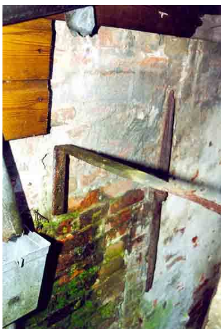
Het achterste gedeelte van de linker zijgevel met daarin een dichtgemetseld venster met een zandstenen latei.

Tussen beide vensters zit vermoedelijk een uitgemetseld rookkanaal. De bekleede gevel springt in het midden althans naar voren. Op de zolderverdieping is links een klein houten draairaampje en rechts een groter recent venster.