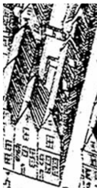
Detail van de kaart van Haubois uit omstreeks 1643, het noorden is links. Oude Boteringstraat 51 staat links van het hoekpand met de Butjesstraat.

Het huis is in ieder geval wat betreft het achterste deel onderkelderd. Het is denkbaar dat het oorspronkelijk geheel onderkelderd is geweest. Dit huis heeft aan de linkerzijde een stookplaats gehad, omdat er in latere tijd ook aan deze zijde een reeks stookplaatsen zit en de gang en de trap rechts gesitueerd zijn. Achteraan de linkerzijde heeft op de begane grond ten minsten één kloostervenster met zandstenen latei gezeten. Het aanbrengen van een venster op deze plek was zinvol doordat de rooilijn van het linkerbuurpand hier terugsprong zodat daar een binnenplaats was waarvandaan de vensters licht konden ontvangen.