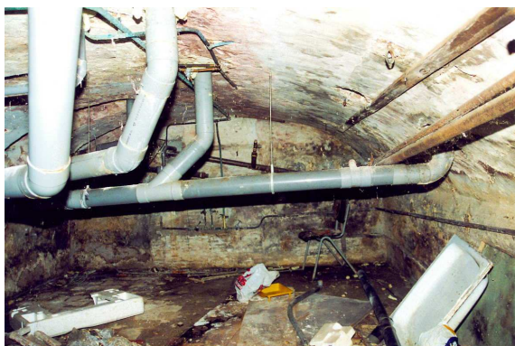
De kelder onder het eerste achterhuis.

De kelder is toegankelijk via een gemetselde trap in de kopse oostkant. De kelder heeft een vloer van plavuizen (ca. 21,5 x 21,5 cm). De plavuizen zijn zo afgesleten dat de meesten geen glazuur meer hebben; bij sommigen zijn nog sporen van groene glazuur zichtbaar. Bij een gat in de vloer kon geconstateerd worden dat er nog enige oudere vloeren van bakstenen op hun plat onder de huidige vloer liggen. Deze kelder zou uit de 16 de of vroege 17 de eeuw kunnen dateren.