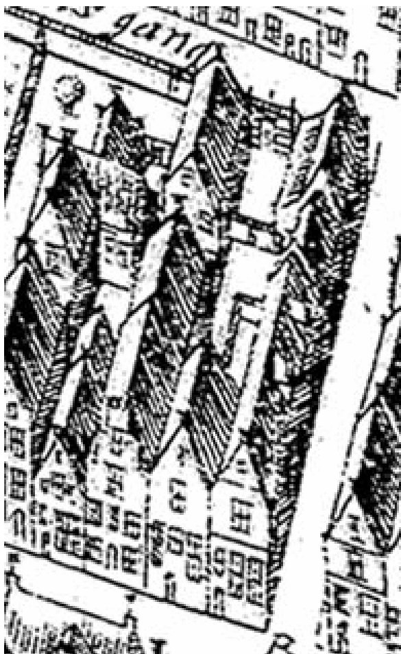
Oude Boteringstraat 53 is het derde huis vanaf de straathoek rechts.

Ook de vogelvluchtkaart van E. Haubois uit ca. 1643 geeft aanwijzingen voor het bestaan van achterhuizen. Het voorhuis is op de kaart dieper dan tegenwoordig en kennelijk nog niet ingekort. Gelijk hierachter staat een fors achterhuis waarin de twee afzonderlijke bouwdelen niet zijn te herkennen, vermoedelijk vanwege de schematische weergave. Achteraan op het perceel in het verlengde van het voor- en achterhuis is nog een huis getekend dat niet bij Oude Boteringstraat 53 hoort. Momenteel is dit onderdeel van Oude Boteringstraat 57.