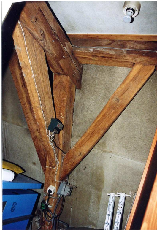
Een van de kagebinten van het achterhuis.

eikenhouten) sporen. Achter de opleggingen van de flieringen op de dekbalken zijn pennen aangebracht. Het vierde gebint heeft geen korbeels, wellicht omdat hier eertijds een tussenwand stond. Bij de opname omstreeks 1990 is in het balkveld tussen de gebinten III en IIII één hangbalk aangetroffen. Pal daarnaast bevond zich een schoorsteen.