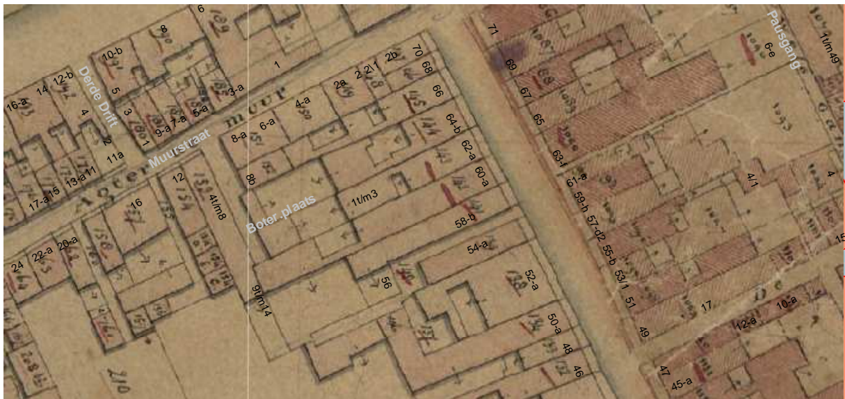
De kadastrale minuut van omstreeks 1830 met daarop aangegeven de moderne huisnummering.