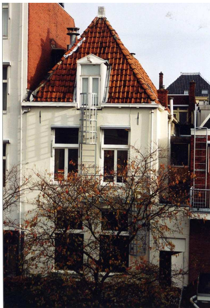
De achtergevel van het achterhuis.

De achtergevel van de aangebouwde eenlaags gang is eveneens gepleisterd en wit geschilderd. Hier bevindt zich een breed deurkozijn met een vluchtdeur (late 20ste eeuw).