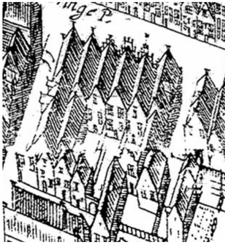
Uitsnede uit de vogelvluchtkaart van Haubois uit omstreeks 1643. Links de Muurstraat en boven de Oude Boteringstraat. Oude Boteringstraat 60 is het vijfde huis vanaf de hoek links.