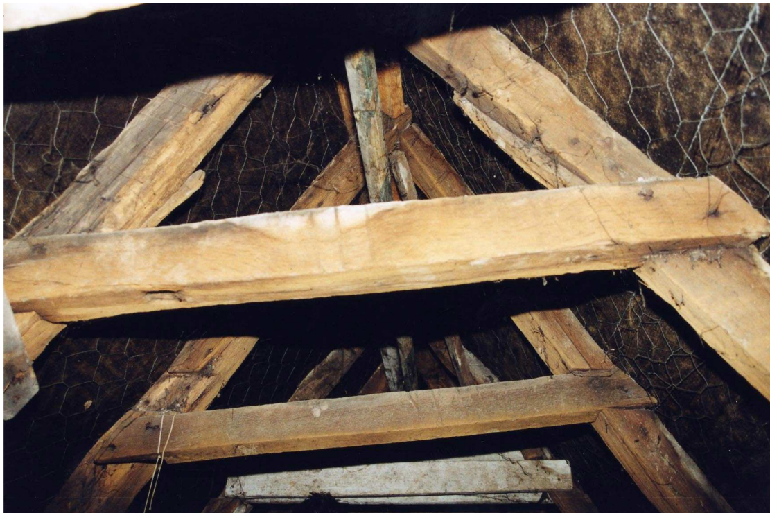
Foto van de eikenhouten sporenkap met gezaagde merken.

De overloop is geheel afgetimmerd, zodat slechts kon worden geconstateerd dat er sprake is van schaargebinten en flieringen (wurmtten). 4 In de spantvakken zijn hangbalken geconstateerd. Zowel de dekbalken van de gebinten als de hangbalken zijn omtimmerd met geprofileerde houten delen. Op de vliering van de zadeldak van het achterhuis bleek sprake te zijn van eikenhouten sporenparen, voorzien van gezaagde merken. Het merendeel van de sporenparen is compleet, zoals kan worden opgemaakt uit de samenhangende merken op de sporen en hanenbalken. Opmerkelijk is de tamelijk willekeurige volgorde van de sporenparen, namelijk van voor naar achteren: III, IV, XII, XX, I, Λ met II (samengevoegd uit twee sporenparen), IIIIAX, III, IIIXX, X, XI en XΛIII. Op grond van deze beperkte waarneming kan niet worden geconcludeerd of de sporen afgenomen en herplaatst zijn of reeds bij de bouw in willekeurige volgorde zijn geplaatst. Diverse herstellingen en opnieuw vastgezette hanenbalken doen het eerste vermoeden, te meer omdat er een sporenpaar blijkt te zijn samengesteld uit sporen van twee verschillende paren, namelijk Λ met II. Er zijn ook diverse sporen nieuw ingevoegd (19de en 20ste eeuw).