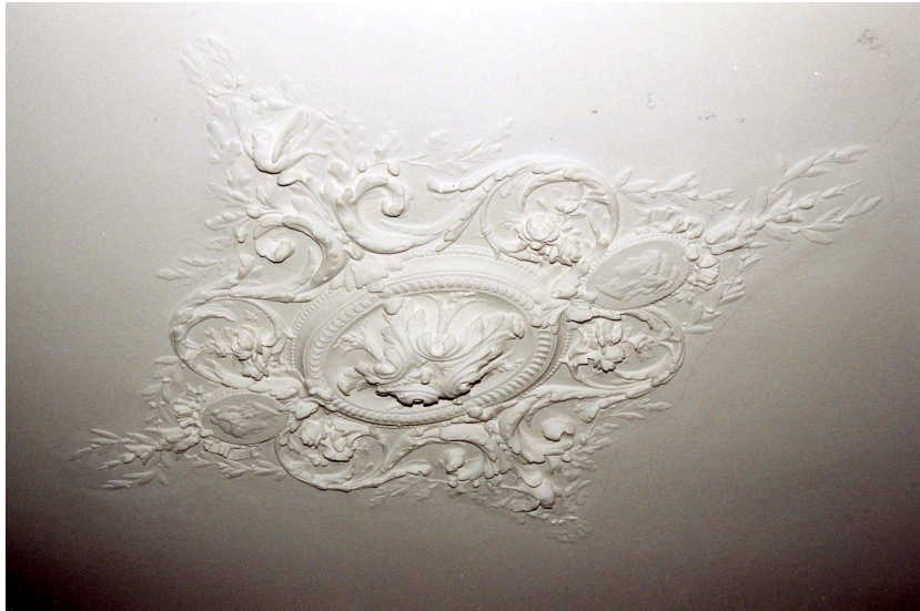
Het middenornament van het 19 e eeuwse stucplafond van de opkamer.

deze kamer wordt gemarkeerd door het hogere vloerniveau van het achterste deel van het huis (over de volle breedte). Trappen leiden naar dit hogere niveau en het lagere niveau van het souterrain. Het souterrain beslaat niet de volle breedte van het huis, maar de breedte van de voormalige achterkamer. De zoldering van het souterrain is geheel vernieuwd. 3 De omvang van de oude opkamer valt te herkennen aan het stucplafond uit de periode 1870-1880. Dit 19de-eeuwse stucplafond heeft een middenornament, rijkelijk versierd met onder meer een omkranste rozet, bladwerk en portretmedaillons. Ook de vier hoekornamenten zijn versierd met bladwerk en portretmedaillons. Een geprofileerde perklijst verbindt de hoekornamenten. De plaats van de trap naar de verdieping tussen voor- en achterkamer tekent zich af door vlak stucwerk. Het beloop van de gang wordt gemarkeerd door een onderslagconstructie en het vlakke stucwerk.