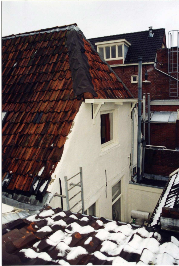
De achtergevel van het voorhuis.

zijn ingevuld met glas-in-lood. De tweede verdieping bevat drie eveneens 19de-eeuwse vensters met kalven, voorzien van stolpramen en drieruitsbovenlichten.