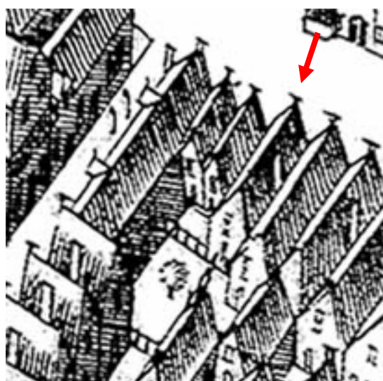
Oude Ebbingestraat 68 op de kaart van Haubois uit omstreeks 1643 is het vierde huis vanaf de hoek links.

De bouwgiedenis van het pand is onduidelijk omdat we van het voorhuis geen metselwerk van de zijmuren en geen balklagen hebben kunnen waarnemen. Het voorhuis zal vermoedelijk een oude mogelijk 16 de -eeuwse kern hebben, zoals vele andere huizen in de Oude Ebbingestraat. Nader onderzoek zal meer uitsluitsel kunnen geven.