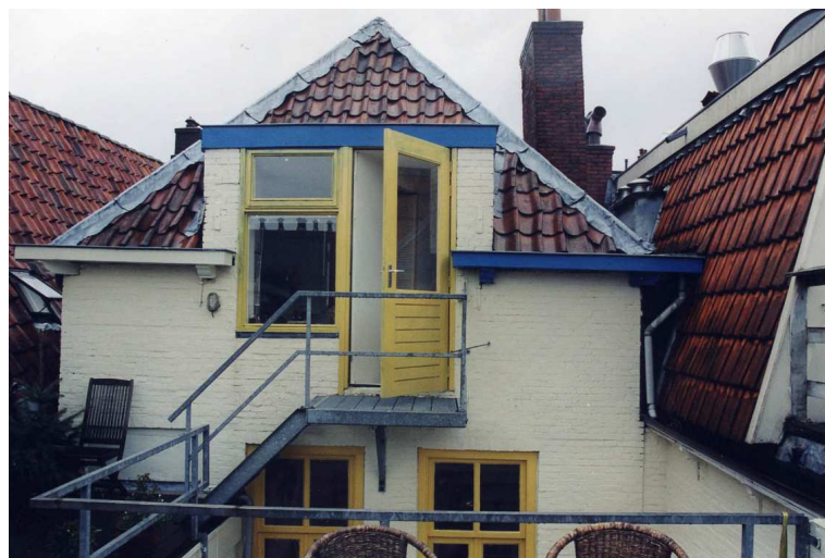
De achtergevel van het voorhuis.

Ter hoogte van de borstwering is deze gevel opgemetseld met 19de-eeuwse rode steen en voorzien van 19de-eeuwse ankers die een enkelvoudige zolderbalklaag aangeven. Een aantal van de balkkoppen is door een plavuis afgedekt.