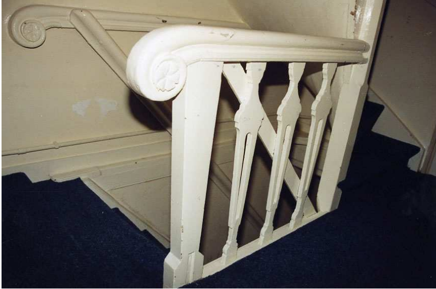
Het traphek op de verdieping waarvan de opengewerkte platte balusters mogelijk uit de 18 e eeuw dateren.

de onder- en bovenzijde. Een 19de-eeuws spiltrapje leidt naar de zolder (in het schilddak). Opmerkelijk is de holle, halfronde spil van deze trap. De zolder in het schilddak is geheel afgetimmerd. Achter de knieschotten viel vast te stellen dat de constructie een laat-19de-eeuwse karakter heeft (circa 1870), waarbij echter wel onderdelen van het gesloopte voorste deel van het 17de-eeuwse zadeldak zijn hergebruikt (hergebruikte eiken sporen).