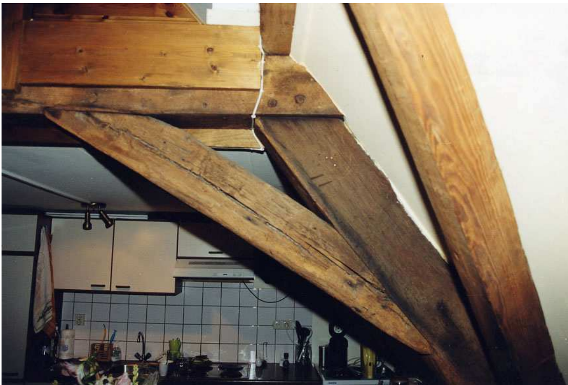
Een van de kapgebinten. Op het pantbeen is het telmerk II afleesbaar.

Het achterste deel van het huis heeft een 17de-eeuwse kapconstructie. Dit is het achterste deel van het oorspronkelijke zadeldak, voorzien van een schildeind aan de achterzijde. Dit schildeind moet bij een 18de- of 19de-eeuws verbouwing zijn aangebracht.