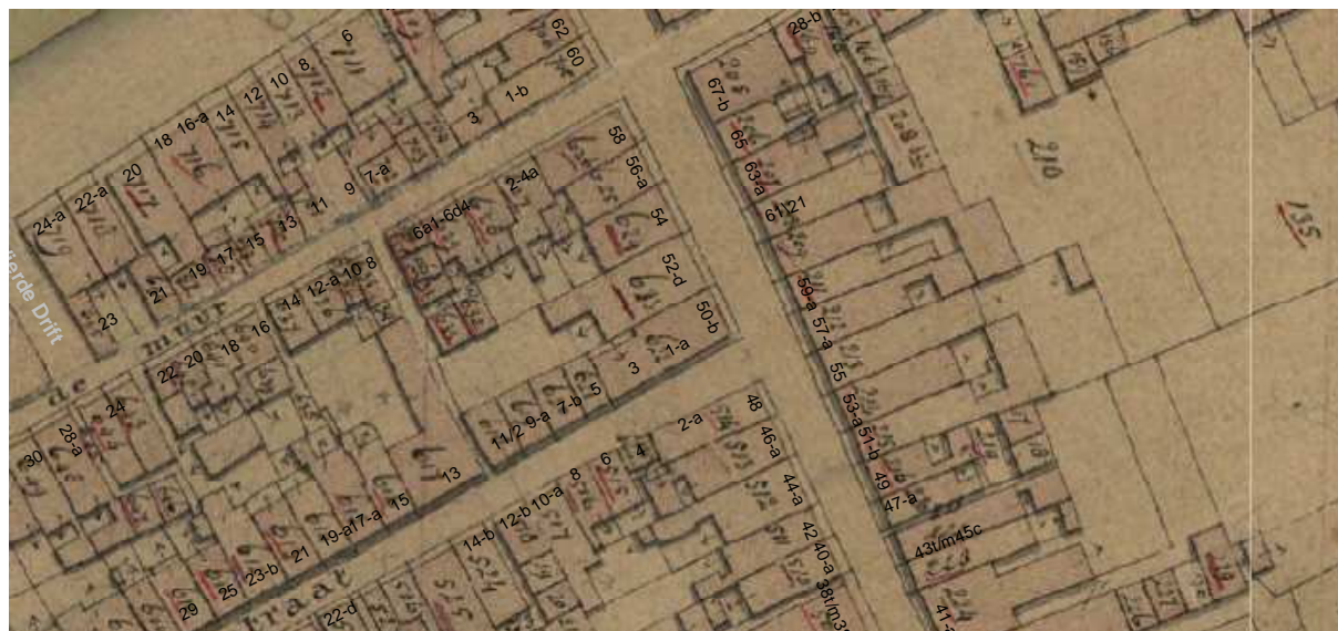
De kadastrale minuut van omstreeks 1830 met daarop aangegeven de moderne huisnummering.

Het volgende ijkpunt is de kadastrale minuut van circa 1830. Op deze tekening staat het huis op een smal en langgerekt perceel, dat aan de achterzijde wordt ontsloten door een dwarsgang tussen de Visserstraat en de Hoekstraat. Achter het huis ligt een tuin. Tegen de achtergevel van het huis zelf staat een uitstek. Sinds de bouw in de vroege 17de eeuw moeten diverse verbouwingen hebben plaatsgevonden, maar daarvan zijn bij deze verkenning geen sporen gevonden. Zelfs is het niet bekend of de voorgevel al in de 18de eeuw is verbouwd tot een lijstgevel of dat dit pas is gebeurd bij de verbouwing in het tweede helft van de 19de eeuw. In het interieur zijn geen aanwijzingen voor een 18de-eeuwse verbouwing, afgezien van mogelijk de balusters van het traphekje op de eerste verdieping. Deze balusters hebben weliswaar een 18de-eeuwse vormgeving, maar kan sprake zijn van hergebruik of kopieën. Nader (kleur)onderzoek kan dit uitwijzen.