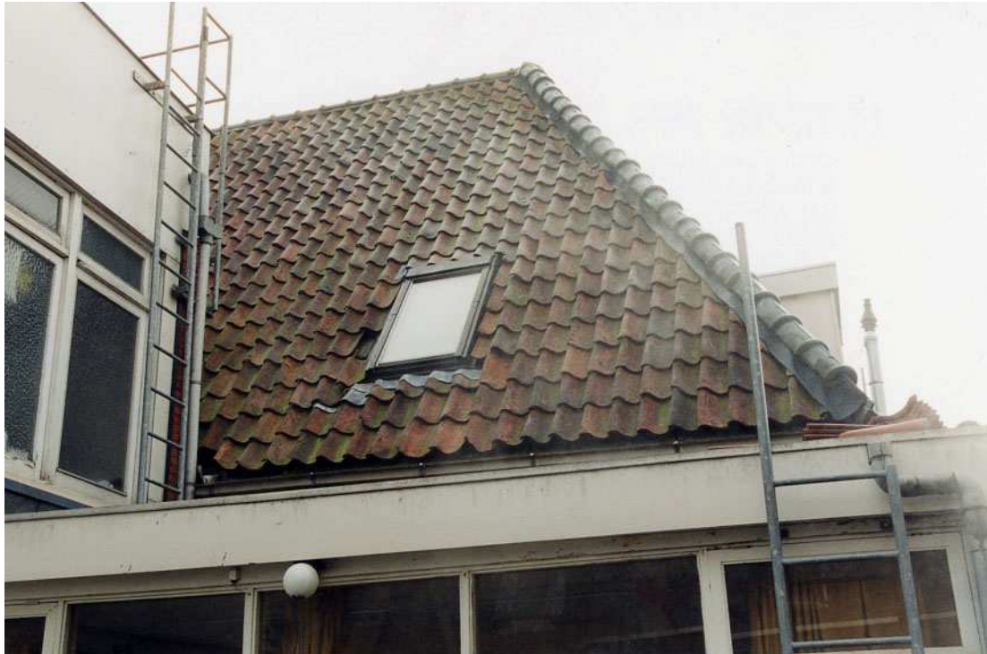
Het achterste gedeelte van het dak aan de noordzijde. De dakpannen zijn linksdekkend (de rechter pan valt over de linker).

Het schilddak aan de voorzijde wordt gedekt door orangerode Oudhollandse pannen. Ook het achterste schilddak heeft een dekking van orangerode Oudhollandse pannen, respectievelijk linksdekkende op het noordelijke dakvlak en rechtsdekkende voor het zuidelijke dakvlak.