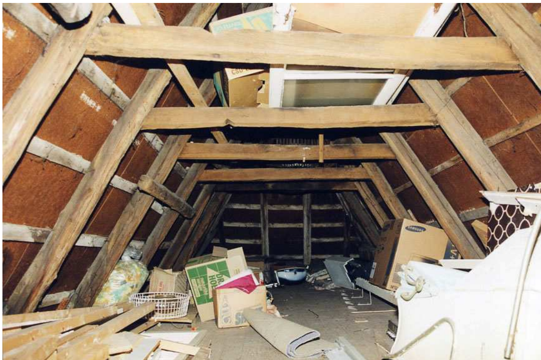
Overzicht van de kapconstructie ter hoogte van de flieringzolder.

Een gedeelte van de kap heeft een behouwen rondhouten nokrib. Op de samenkomst van nok en voorschild bevindt zich een zeer eenvoudige makelaar. Het voorschild bestaat uit naaldhouten behouwen oplangen. Ook zijn er hier en daar horizontale rondhouten in de dakvlakken tegen de sporen aangebracht. Overigens zijn latten en 20ste-eeuwse beplating aangebracht.