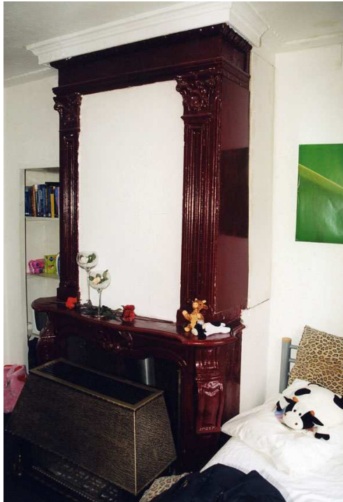
De schouw van de achterkamer op de verdieping.