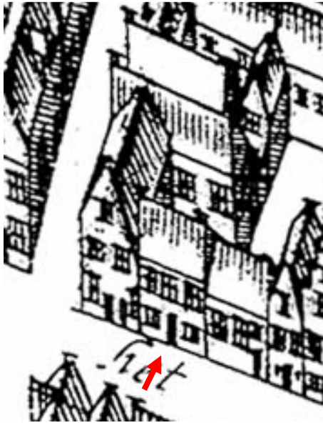
De kaart van Haubois uit omstreeks 1643.