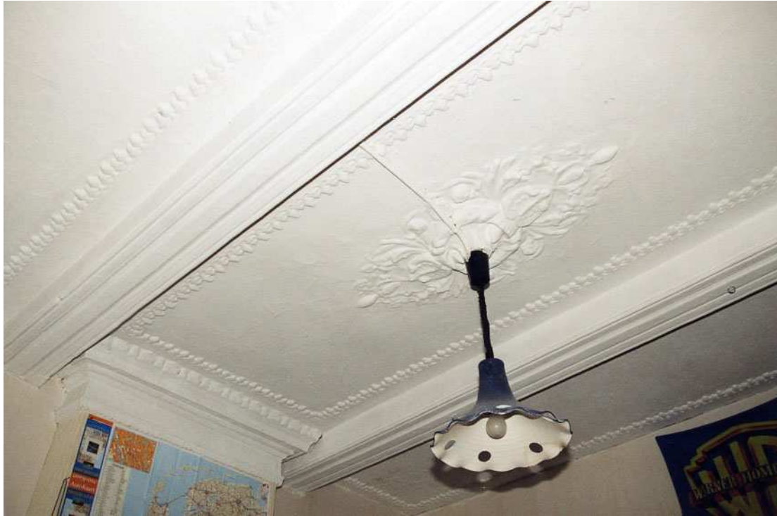
Het stucplafond van de voorkamer op de verdieping.

De achterkamer heeft een verlaagd stucplafond uit het eerste kwart van de 19de eeuw met een omlopende lijst en een rozet in het midden. Tegen de linkermuur zit een houten schouw met gesneden consoles en een rookvang met Korinthische pilasters die een kroonlijst dragen. Ernaast bevindt zich een muurkast. De achterkamer heeft houten vensterbanken uit het eerste kwart van de 19de eeuw met eenvoudige rechthoekige panelen.