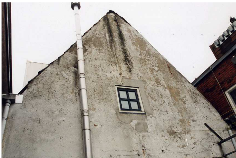
De top van de achtergevel.

De voorgevel dateert in deze vorm uit de tweede helft van de 19de eeuw maar de ankers suggereren een oudere kern en ook de pleistering kan op een oudere mogelijk 17de-eeuwse gevel duiden met bouwsporen die verborgen moesten worden.