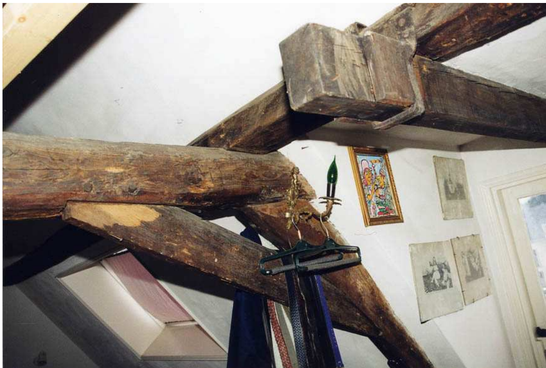
De kapconstructie met rechts de dakkapel met hijsbalk.

Ook in de scheidingsmuur met de achterkamer geeft een tweepaneelsdeur toegang tot de achterkamer. Ook deze deur is van elders afkomstig en is via Monument & Materiaal hier terecht gekomen.