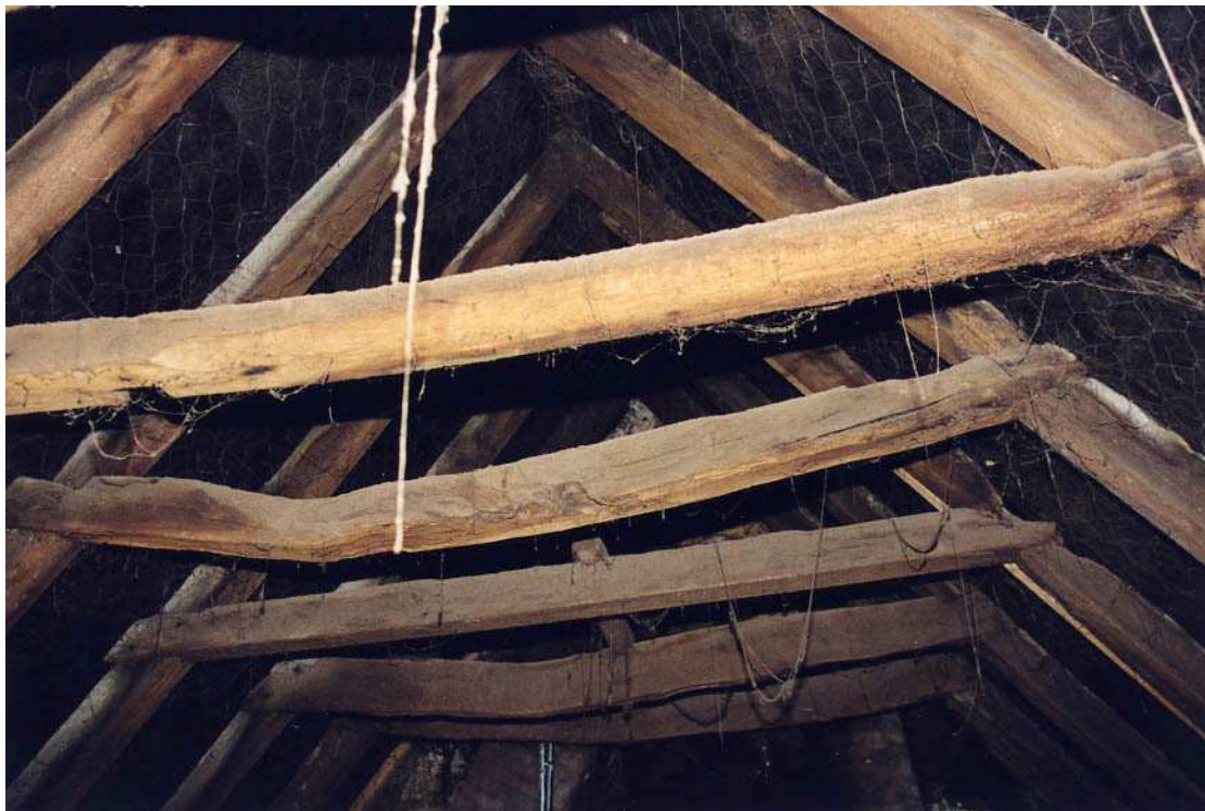
Het bovenste gedeelte van de sporenkap.

Ondanks de afwerking van stuc op steengas, valt in het plafond van de begane grond nog een enkelvoudige grenenhouten balklaag (in vijf balkvakken) te herkennen. Opvallend is de toepassing van het smalle balkvak aan de linkerzijde, dat tevens functioneert als een raveling voor het rookkanaal. Aan de voor- en achterzijde zijn onder de balken nog de contouren van houten consoles te zien. De onderslagbalk is van recenter datum (circa 1971?). Tegen de linkergevel is een hangnis zichtbaar, behorend bij een potkachel in de bedrijfsruimte. De schouw van de voorkamer was waarschijnlijk verder naar voren geplaatst. De betonvloer is van betrekkelijk recente datum (circa 1971?).