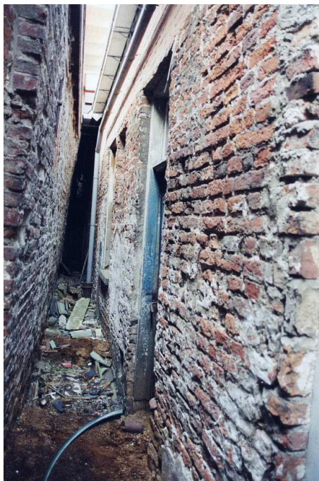
De achtergevel van Pluimerstraat 5 (rechts) gezien in westelijke richting.

In de achtergevel bevindt zich een vermoedelijk verplaatst 19de-eeuws deurkozijn met bovenlicht, voorzien van een 19de-eeuwse glasdeur met mousselineglas en blauw glas. Volgens de opmetingstekening uit 1941 bevond deze deur zich midden in de achtergevel van Pluimerstraat 5. Verplaatsing was noodzakelijk als gevolg van de plaatsing van een breed kozijn voor een deurstel (tweede helft van de 20ste eeuw).