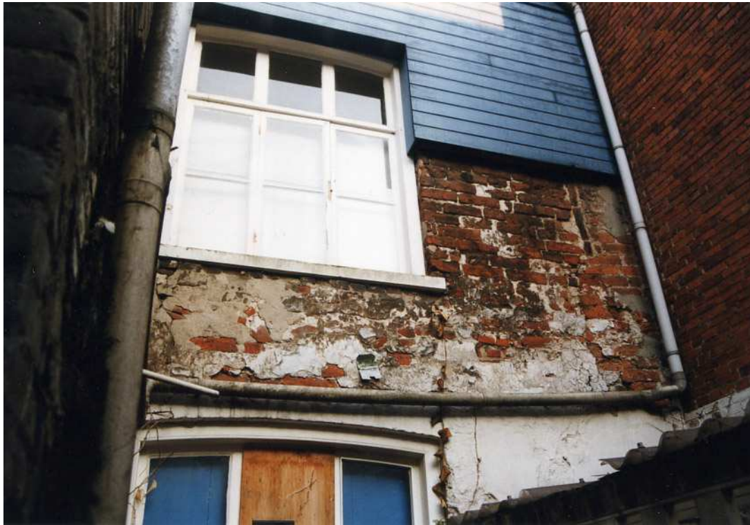
De achtergevel met middeleeuws muurwerk.

De zuidwestelijke achterhoek van het gebouw is verstevigd met grote 19de-eeuwse ankers.