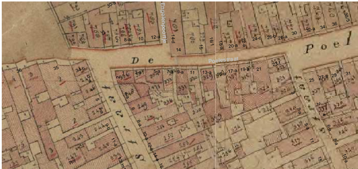
De kadastrale kaart uit omstreeks 1830 met daarop aangegeven de moderne huisnummering.

Aan het eind van de 18de of in de vroege 19de eeuw is de voorgevel gemoderniseerd. De oude gevel werd in een lijstgevel veranderd en van houten vensters en een blokpleister voorzien.