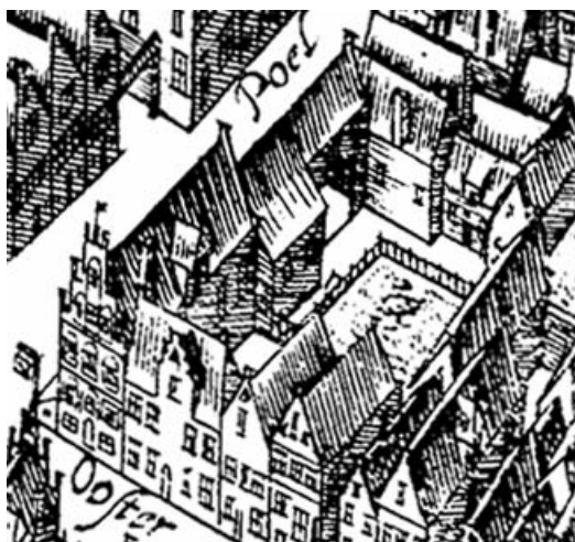
Uitsnede uit de kaart van Haubois uit omstreeks 1643 met een deel van de bebouwing ten zuiden van de Poelestraat. Het noorden op deze kaart is links. Poelestraat 9 is het eerste huis met het dak haaks op de straat achter het langgerekte hoekhuis met de Oosterstraat.

Het achterste deel (mogelijk ook de gehele kelder) van de kelder werd mogelijk in de 16de of 17de eeuw voorzien van twee gedrukte tongewelven, waarbij de onderslagbalk verdween en vervangen werd door een steens middenmuur in de lengterichting van het huis.