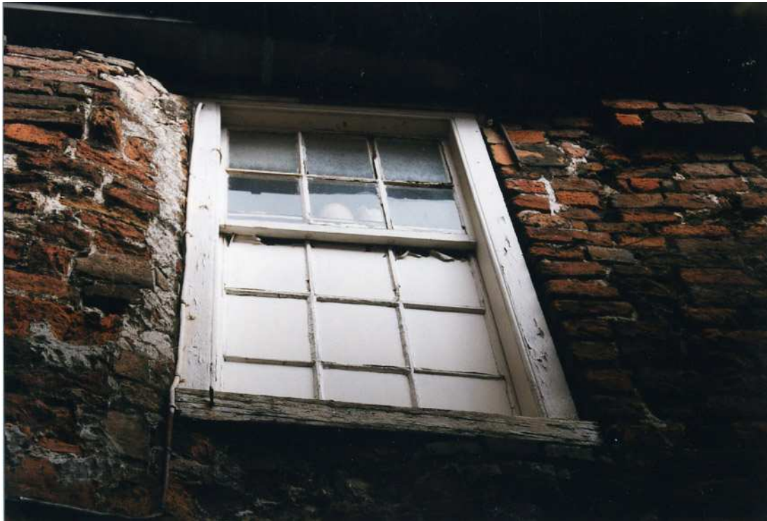
De westgevel met venster op de verdieping.

De huidige vormgeving van de gevel zou, afgezien van de onderpui, uit het einde van 18de of de vroege 19de eeuw kunnen stammen. Gezien de aanwezigheid van pleister en de twee ankers is het waarschijnlijk dat ook oudere bouwsubstantie nog aanwezig is.