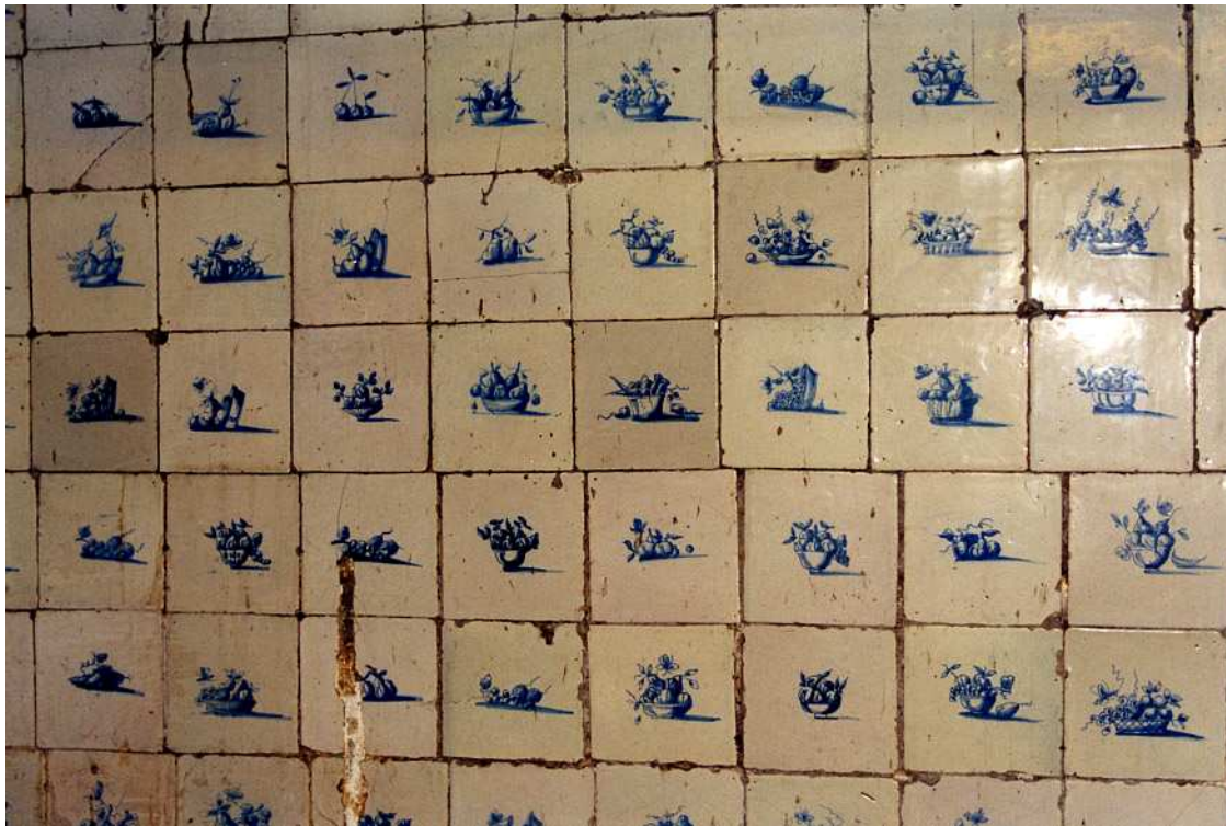
De met tegels afgewerkte westwand op de begane grond van het achterhuis.

In het voorste vertrek aan de rechterkant zijn tegen de rechtermuur (westmuur van het achterhuis) mogelijk 18de-eeuwse tegeltjes (12,5 x 1 2,5 cm) met voorstellingen (ondermeer kinderspelletjes en fruit) aangebracht. Deze zijn hier secundair aangebracht. Het voorste vertrek heeft een modern plafond. In de scheidingswand tussen het voorste en het achterste vertrek bevindt zich een schuifdeur die uit 1909 kan dateren.