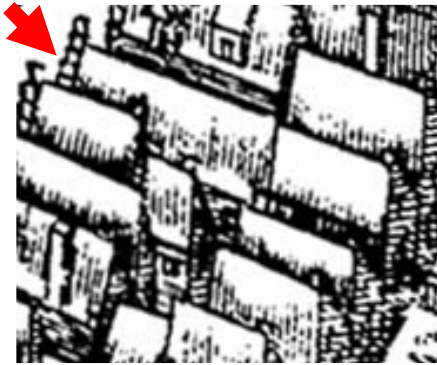
Detail van de kaart van Haubois uit omstreeks 1643 met daarop aangegeven Poelestraat 19.

het achterhuis ervan dan Achterhuis 19. Gezien het gebruik van de grenenhouten balken voor het achterhuis lijkt een eind 16de-eeuwse of vroeg 17de-eeuwse datering mogelijk. De 16de-eeuwse datering wordt ondersteund door de tienlagenmaten van 86-88 cm van de rechterzijmuur.