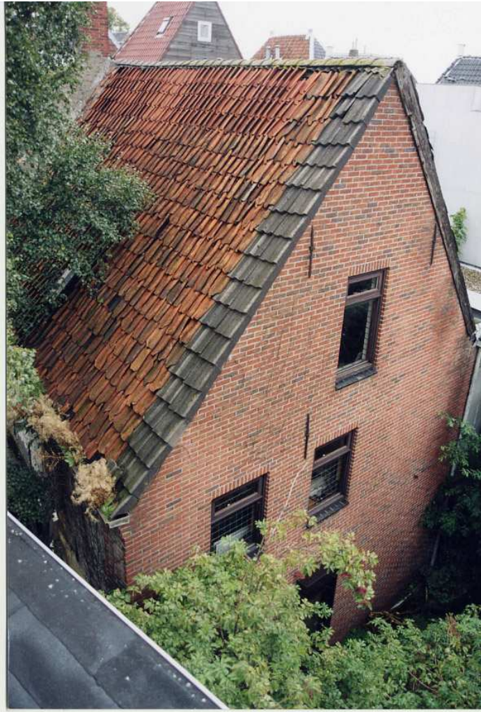
De achtergevel van het achterhuis.

waargenomen. Deze lage venstertjes waren vermoedelijk oorspronkelijk luikvensters geweest. Ook bevindt zich op de verdieping nog een breed houten venster met tweedelig raam. Dit venster kan op de plek van een vroeger oorspronkelijk venster zitten. In deze zijgevel geven twee rijen ankers de enkelvoudige balklaag boven de begane grond en de verdieping aan.