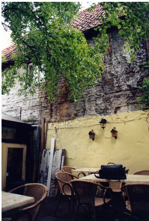
De westgevel van het achterhuis.

De linker (oostelijke) zijmuur van het achterhuis is mandelig met het achterhuis van Poelestraat 21, of beter gezegd het is in feite de muur van het achterhuis van 21, waarin de balken van het achterhuis van nr 19 gebalkt zijn. Dit is een anderhalfsteens dikke muur waarvan de 10-lagenmaten variëren van 82-87cm. De steenmaat bedraagt 28-29,5 x 14,5 x 6,7-7,6 cm; de meest voorkomende dikte is 7,2 cm. Deze muur dateert vermoedelijk uit de 16de eeuw.