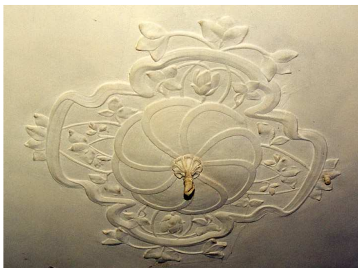
Het middenornament van een stucplafond uit 1909 op de begane grond van het achterhuis.

In het achterste vertrek bevindt zich tegen de rechtermuur een houten? vermoedelijk eind-19de-eeuwse stookplaats in zeer eenvoudige eclecticismische stijl. Aan de linkerkant bevinden zich drie ingebouwde kasten. Dit vertrek heeft een zachtboard plafond.