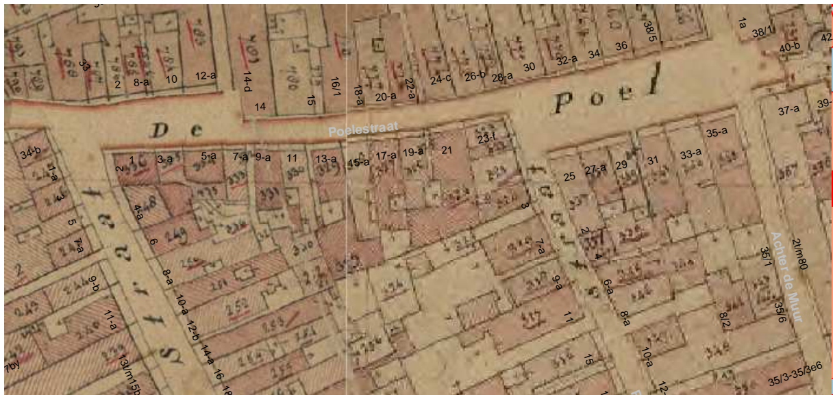
De kadastrale kaart van omstreeks 1830 met daarop aangegeven de moderne huisnummering.

Het achterhuis heeft lange tijd bij het buurpand (Poelestraat 21) gehoord, dit was al zo omstreeks 1830 toen de oudste kadastrale kaart werd vervaardigd. Ook een bouwtekening uit 1909 lijkt deze situatie te bevestigen aangezien het achterhuis niet is getekend. Wanneer het achterhuis bij nr 19 is getrokken is niet duidelijk.