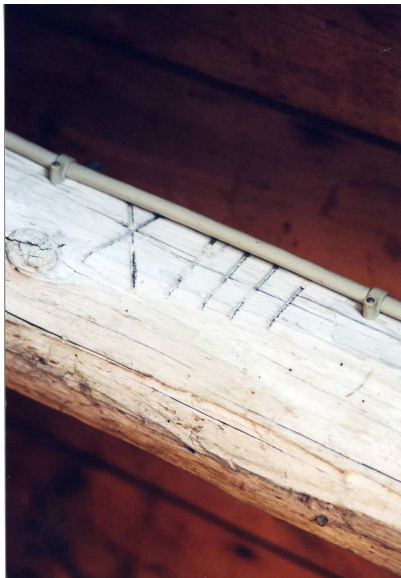
Een van de telmerken van de kapconstructie.

De kapconstructie van het zadeldak op het voorste deel van het huis bestaat uit gekoppelde sporenparen, elk met twee hanebalken. Deze gehele constructie is samengesteld uit gekantrecht grenenhout. Op zowel de sporen als alle hanebalken zijn gezaagde telmerken herkenbaar, gerekend van voor naar achteren: XV, XIII, V, VII, XII, II, XI en I. Er is geen verschil tussen links en rechts. Op grond van de constructiewijze, het materiaalgebruik en deze telmerken, wordt de kap gedateerd in de 17de eeuw. De voorste sporenparen worden gekoppeld door middel van korte balken, die verankerd zijn in de voorgevel (sierankers). Gelet op de positie van de bovenste twee reeksen hanebalken in de sporenparen, behoort de vlieringvloer niet tot de oorspronkelijke constructie. Waarschijnlijk in de 19de eeuw zijn extra hanebalken aangebracht, die de drager vormen voor de verlaagde plafonds van de zolderkamers. De nieuwe hanebalken vormden tevens de oplegging voor de vlieringvloer. Het achterste deel van de kap stamt uit 1902. Aangezien deze nieuwe kap lager is dan het zadeldak van het voorste deel van het pand, is de punt van dit zadeldak aan de achterzijde afgewerkt met hout.