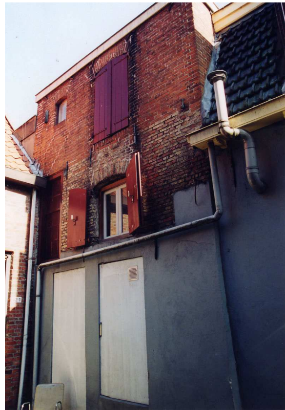
Foto links, de zijgevel van het pakhuis gemaakt in 1964 door A. van der Wal (RDMZ) en rechts dezelfde gevel in 2003.

In of kort na 1968 is de kap van het pakhuisje gesloopt. Het is een 'gelukkig toeval' dat de oude situatie in 1966 nog is vastgelegd door A. van der Wal, werkzaam bij de Rijksdienst voor de Monumentenzorg. Er was sprake van een zadeldak, haaks op de Poelestraat gesitueerd. Op het westelijke dakschild bevond zich een trijshuisje met een ver overstekend zadeldak.