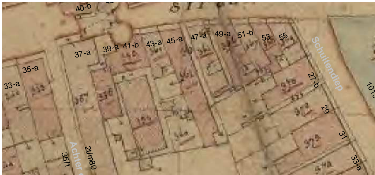
De kadasterkaart uit omstreeks 1830 met daarop aangegeven de moderne huisnummering.

Daarachter kwam een eenlaags achterhuis. Mogelijk is hierachter toen ook al een tweede achterhuis geweest. In ieder geval is op het minuutplan van omstreeks 1830 al aaneengesloten bebouwing tot achter aan het perceel te zien.