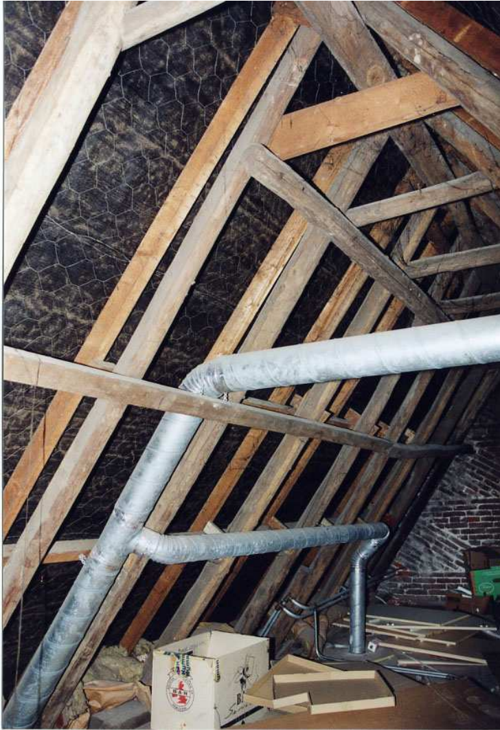
De kapconstructie van het voorhuis.