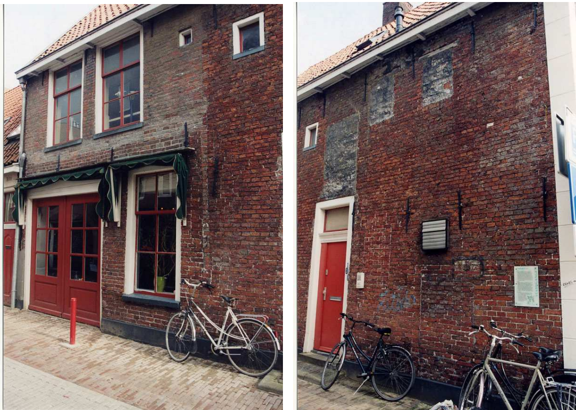
De zijgevel van het voorhuis aan de Tuinstraat.

Op de verdieping zitten in het tweede en derde vak dichtgezette oorspronkelijke vensteropeningen, overdekt door vermoedelijk houten (eiken?) lateien. (Deze lateien zijn volgens het verslag van M&M van zandsteen). Aan de onderkant van deze vensteropeningen zitten rollagen. Gezien de plaatsing en de grootte van de openingen waren het vermoedelijk luikvensters. In het derde vak zit een dichtgezette secundaire opening. Gezien de plaatsing en de grootte kan dit een pakhuisdeur geweest zijn. In het vijfde vak zit een WC-raampje.