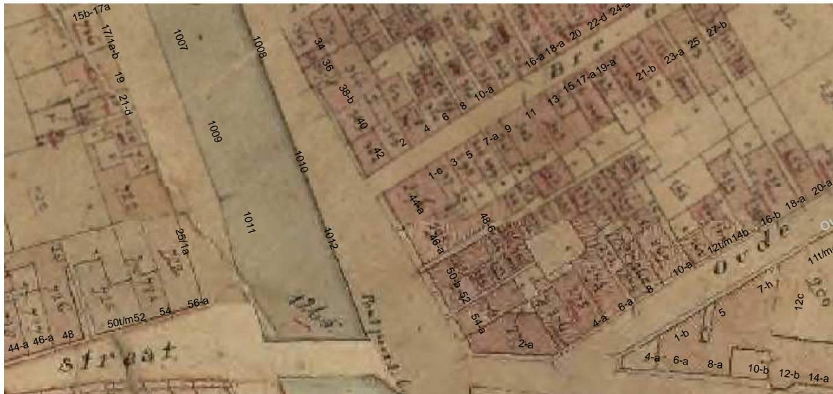
De kadastrale kaart van omstreeks 1830 met daarop aangegeven de moderne huisnummering.

Een eenpaneelsdeur die toegang geeft tot Tuinstraat 3 dateert uit de 18 de -eeuw en het is denkbaar dat toen nieuwe vensters in de noordgevel aangebracht zijn. De huidige vernieuwde vensters hebben een kwartholprofiel. Wellicht heeft men het oude profiel min of meer gevolgd.