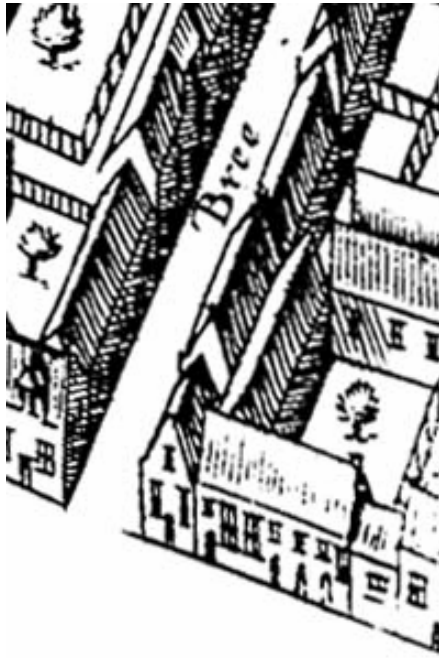
De kaart van Haubois uit omstreeks 1643.