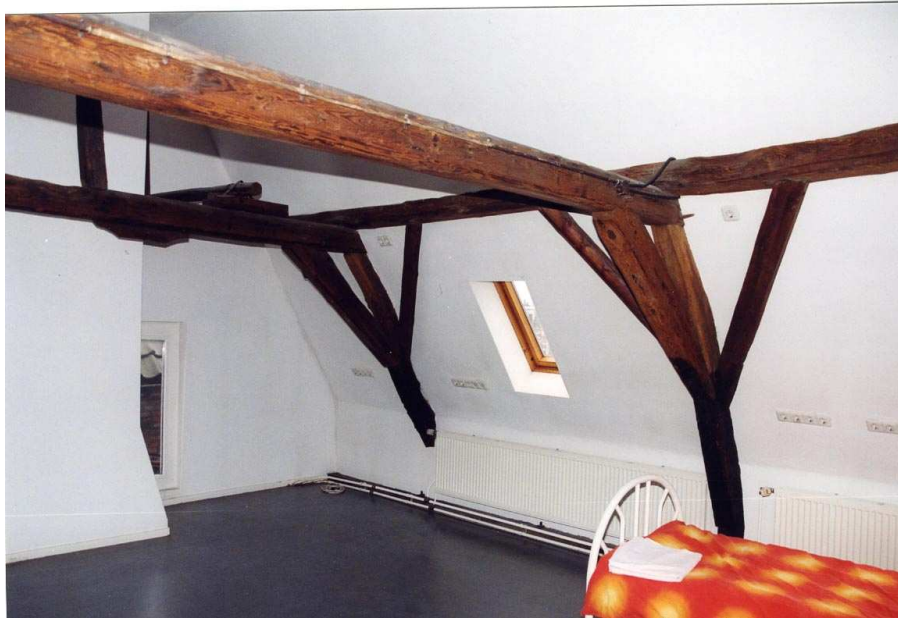
De 17 e -eeuwse kapconstructie van de voorbeuk.

Links naast het rookkanaal bevindt zich een deur met ongekleurd glas in lood die toegang geeft tot de afgescheiden trap. Een enkelvoudig venstertje met een eenvoudige omtimmering verlicht dit gedeelte. Mogelijk zit dit venstertje op de plek van een oud venster.