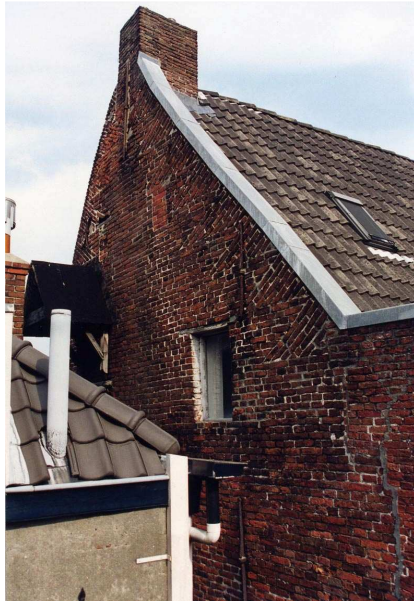
De kopse noordelijke gevel van de voorbeuk.

Ter hoogte van de vliering bevinden zich twee kleine dichtgezette venstertjes (vermoedelijk luikvensters). Het linkervenster is nog overdekt met een latei. Er kon niet goed waargenomen worden of deze latei van hout of zandsteen is.