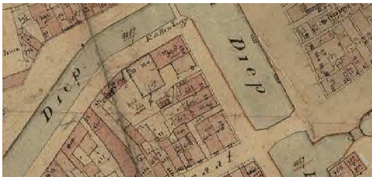
De kadastraal kaart van omstreeks 1830 met daarop aangegeven de moderne huisnummering.

De kern van het huis is een dwarse voorbeuk die zich over nr 51 en 53 uitstrekt. Het heeft twee bouwlagen met een zolder die een borstwering heeft. In opzet en constructiewijze heeft dit duidelijk 17 e eeuwse kenmerken. Zo heeft het een steil zadeldak en bestaat de kapconstructie uit gebinten die gedeeltelijk van eikenhout en gedeeltelijk van grenenhout zijn gemaakt. Ook het metselwerk van de rechter kopse gevel van het huis (bij de steeg in het zicht) past, gezien de tienlagenmaten en steenmaten (een tienlagenmaat van 76,3 cm; de steenmaat bedraagt 28-27,8 x 13,5-14 x 6,1-6,5 cm), goed bij deze periode. Tenslotte wijst ook het profiel van een console onder een balk boven de verdieping op een datering in de eerste helft van de 17de eeuw. Vermoedelijk zaten de oorspronkelijke stookplaatsen in de beide kopse dwarsgevels. Of het huis van het begin af aan is opgezet als ‘twee onder een kap woning’ is niet bekend. Wanneer het later is gesplitst dan is dat vóór circa 1830 gebeurd aangezien op de kadastraal uit dit tijd twee percelen staan aangegeven. Het rechter (noordelijke) gedeelte (nr. 51) heeft een achterbeuk van ruim 5 meter diep. Tegen de achtergevel bevond zich aan de zuidkant een vierkant uitbouwje waarvan geen sporen teruggevonden zijn.