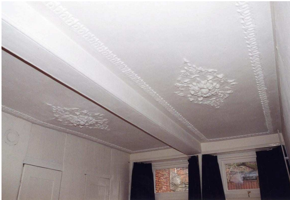
Het stucplafond van de linker achterkamer op de verdieping.

De linkerachterkamer heeft een gestuct balkenplafond van twee vakken. De balken zijn omstuct en in ieder vak is een stucplafond met perklijst en een floraal middenornament aangebracht. De balken hebben een grove duivejagerprofilering in stucwerk. De kamer heeft in- en uitzwenkende vensterbanken met kraalschroten en een neggebetimmering met staande bolle panelen. Deze ruimte heeft een 19de-eeuwse houten vloer. Tegen de linker (zuidelijke) muur is een 19de-eeuwse kastenwand aangebracht waarbij de vier deuren aan de binnenzijde steeds twee panelen hebben. De buitenkant was vermoedelijk oorspronkelijk beplakt met behang op jute.