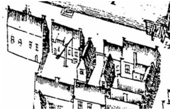
Schuitendiep westzijde tussen het Kattendiep en de Steentilstraat op de kaart van Haubois uit omstreeks 1643.

Op de kaart van Haubois uit ca. 1643 wordt op de plaats van Schuitendiep 53 en 51 een dwars huis afgebeeld waarvan de kern in de beide huidige huizen nog goed zichtbaar is. Aan de noordkant van dit dwarse huis was een steeg en achter het huis wordt een haal voor een put afgebeeld.