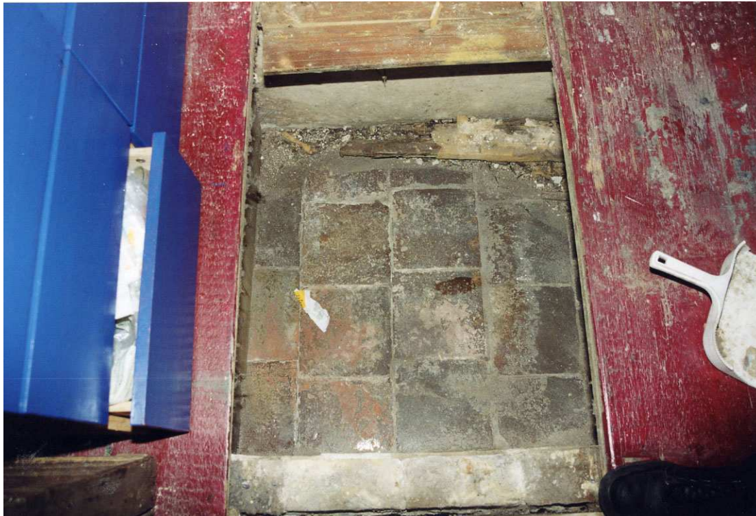
De vloer van het keldertje.

een 'aardappelkeldertje'. De vloer daarvan is geplaveid met 19de-eeuwse bruin geglaazuurde plavuizen (21½ x 21½ cm).