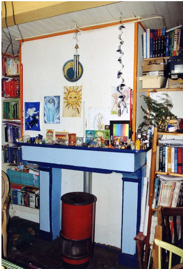
De kamerschouw uit de 18 e eeuw.

De zoldering bestaat uit een (ziende) enkelvoudige balklaag van vier balkvakken, waarvan de grenenhouten balken zijn opgelegd in voor- en achtergevel. In de voorgevel rusten deze balken op de penanten naast en tussen de (smalle) vensters. De balken meten circa 18 x 18 cm (hart-op-hartmaat: ca 1,2 meter). De balkvelden zijn afgetimmerd.