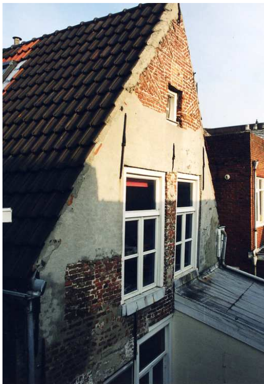
De achtergevel van het voorhuis.

Op het niveau van de zolder zijn in de 19de eeuw twee grote vensters aangebracht. Deze vensters zijn voorzien van stolpramen (20ste eeuw). De vliering bevat een klein venstertje (19de eeuw?).