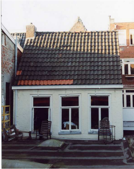
De achtergevel van het achterhuis. Boven het dak is de top van de achtergevel van het voorhuis zichtbaar.

De achtergevel van het achterhuis is eveneens een tweelaags langsgewel. De begane grond gaat schuil achter de eenlaags bebouwing op het binnenterrein. De verdieping is uitgevoerd in metselwerk, dat later is beschilderd. Er is sprake van drie (19de-eeuwse?) vensters met T-stolpramen.