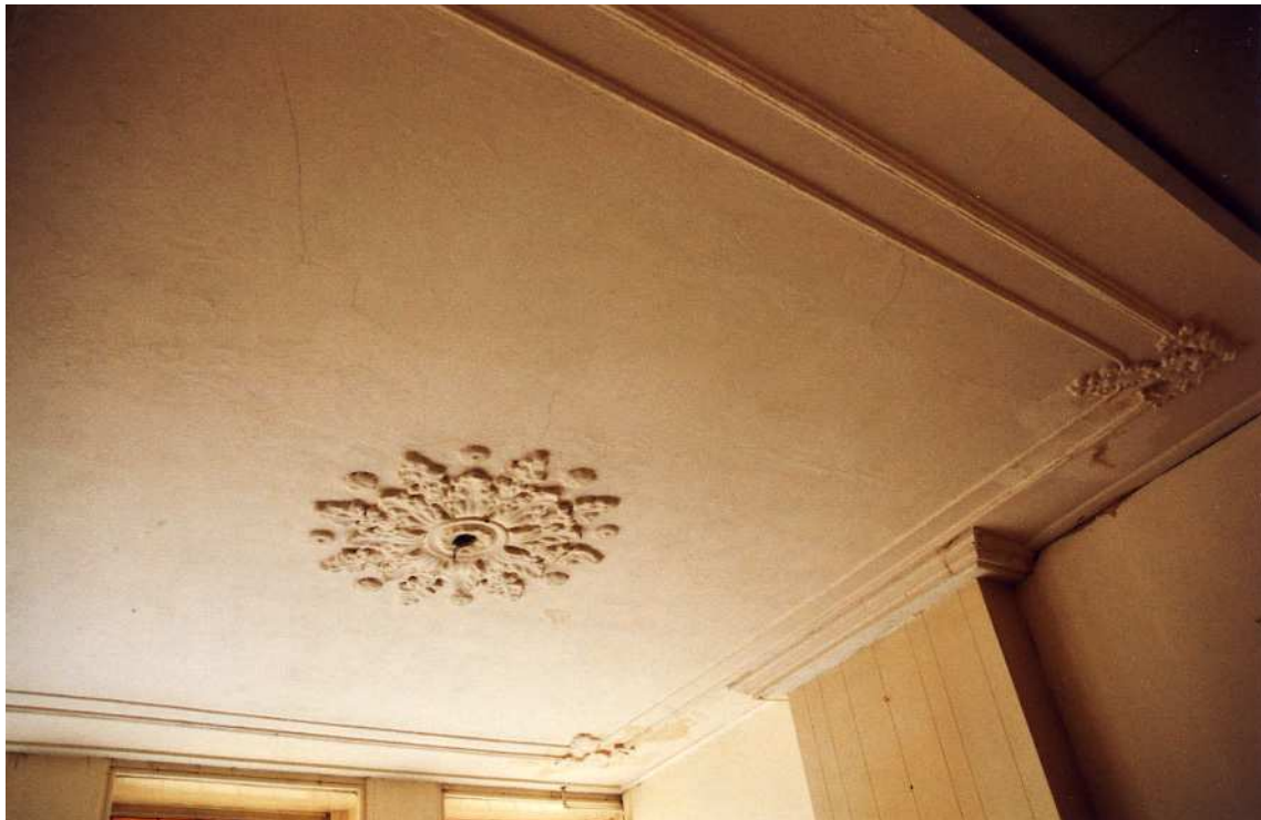
Het plafond van de voorkamer op de verdieping.

De voorkamer in de brede beuk heeft diverse elementen van de 19de-eeuws interieur-afwerking behouden, waaronder een stucplafond met perklijst, hoekstukken en een middenornament. De voor-gevel heeft een vensterwandbetimmering. Tegen de oostelijke zijgevel staat een forse schouw, waarvan de schoorsteenmantel van tamelijk recente datum is. De voorkamer heeft een grotere hoogte dan de rest van de verdieping, omdat de bovenliggende zoldervloer in de 19de eeuw is verhoogd. De voorkamer heeft tegenwoordig een open verbinding met de achterliggende alkoof. Deze alkoofruimte heeft nog zijn 17de-eeuwse hoogte. De interieur-afwerking is vernieuwd. Dit is ook het geval in de dijk kanalen (beuk) en de gang.