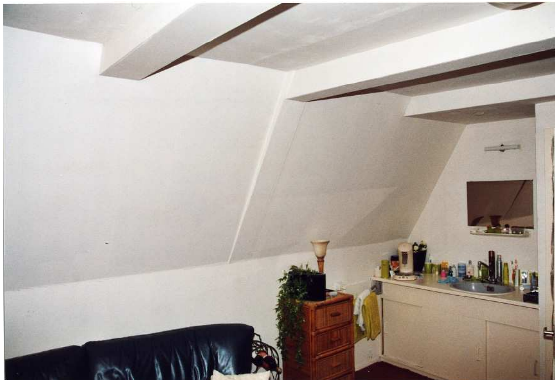
Het achterste deel van de zolder van het voorhuis. In het schuine gedeelte tekent zich een spantbeen af.