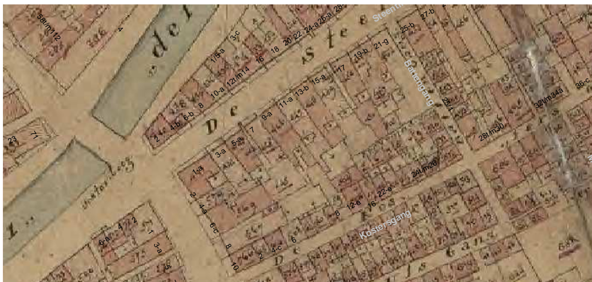
De kadastrale minuut van omstreeks 1830 met daarop aangegeven de moderne huisnummering.

In het derde kwart van de 19de eeuw zijn voor- en achterhuis grondig verbouwd. Eén van de voornaamste wijzigingen betrof de verhoging van de voorkamer(s) op de eerste verdieping. Dat gaf tevens gelegenheid om hogere vensters in de voorgevel te plaatsen. De aloude topgevel werd in die periode gewijzigd tot een drielaags lijstgevel, terwijl de kap aan de voorzijde is afgewolfd. De tweede verdieping kreeg lage vensters, mezzanino-vensters. Ook de gepleisterde afwerking en de vensters stammen uit deze periode. Verder moeten de indeling en interieur-afwerking zijn vernieuwd. Uit deze periode stammen diverse stucplafonds, betimmeringen en paneeldeuren.