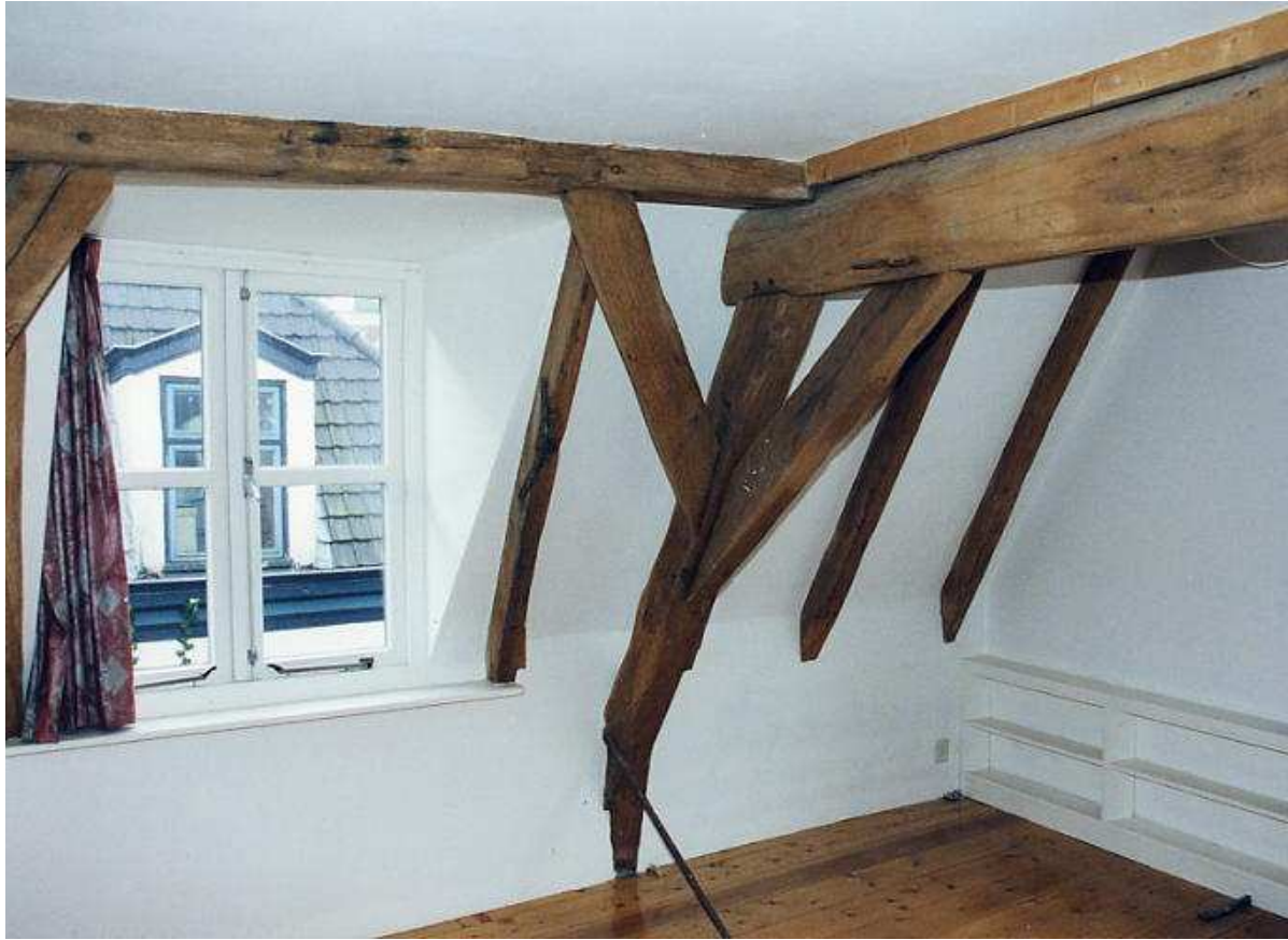
Boven: de kap van het voorhuis gezien naar het westen aan de voorgevelzijde (foto: H. Wierts) Onder: telmerk op het vijfde spant aan de westzijde (foto: H. Wierts)

De plaatsing van de korbeels in de spantbenen en dekbalken is asymmetrisch: de dunnere korbeels zijn langs een van de zijkanten in plaats van in het hart van de spantbeen en dekbalken geplaatst. De aanbouw bezit een eenvoudige sporenkap, vermoedelijk uit het eind van de 18 de of het begin van de 19 de eeuw, gemaakt van gekantrecht naaldhout. Hierin zijn enkele gehakte merken aanwezig.