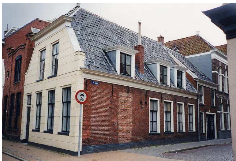
Visserstraat 66